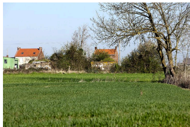
Vue générale vers le nord des deux casemates A et B IVR31_20145905238NUCA