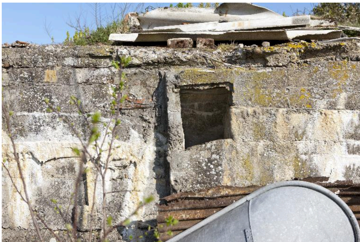
Casemate A. Ouverture sur l'élévation sud