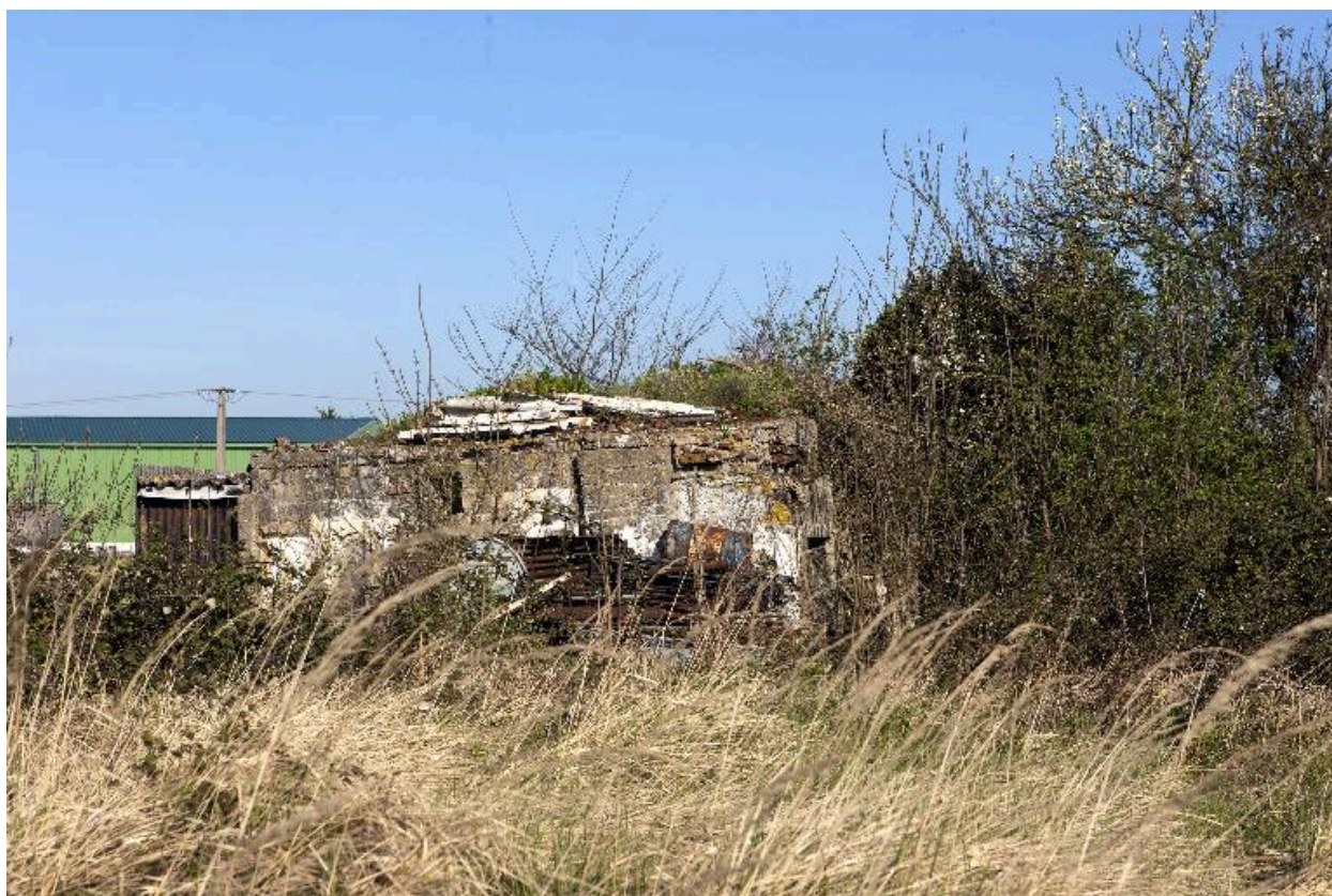
Casemate A, vers le nord