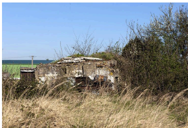
Casemate A, vers le nord IVR31_20145905239NUCA