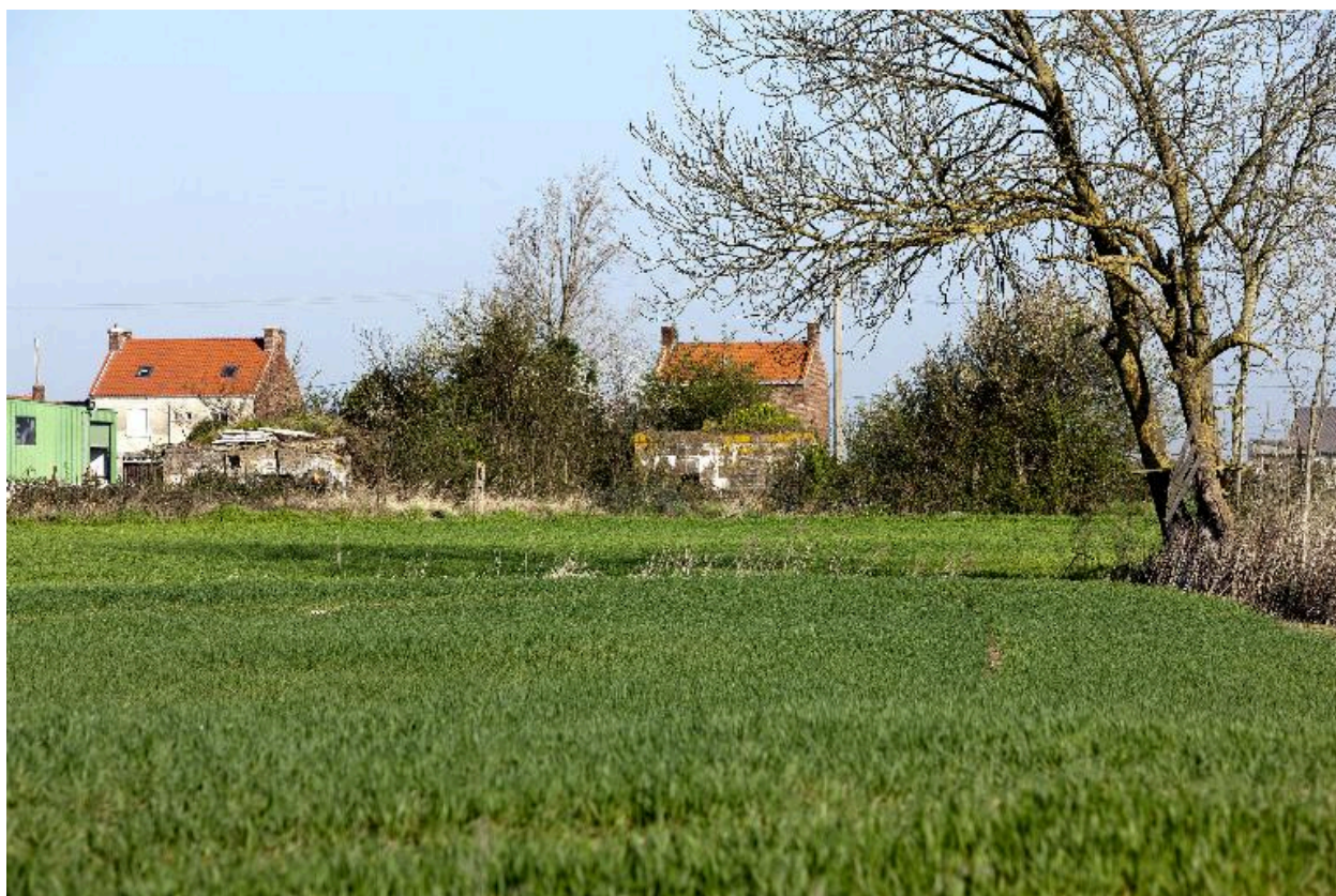
Vue générale vers le nord des deux casemates A et B