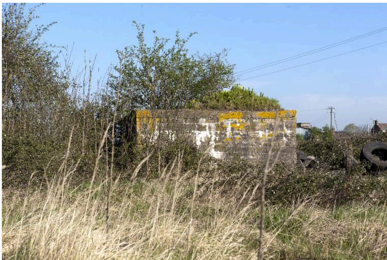
Casemate B, vers le nord