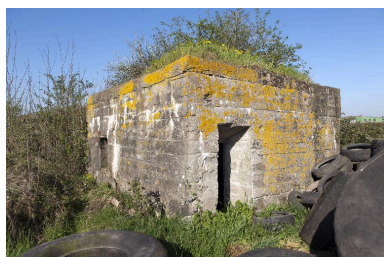
Casemate B, vue de trois-quarts vers l'ouest