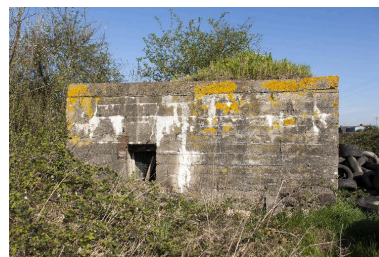
Casemate B, fenêtre sur l'élévation sud