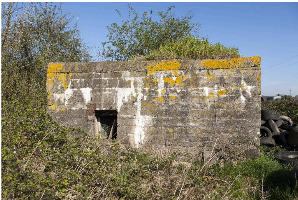
Casemate B, fenêtre sur l'élévation sud