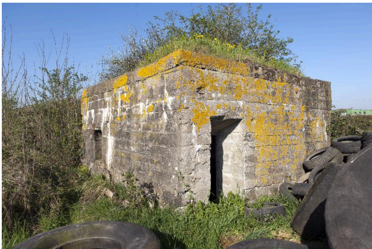
Casemate B, vue de trois-quarts vers l'ouest