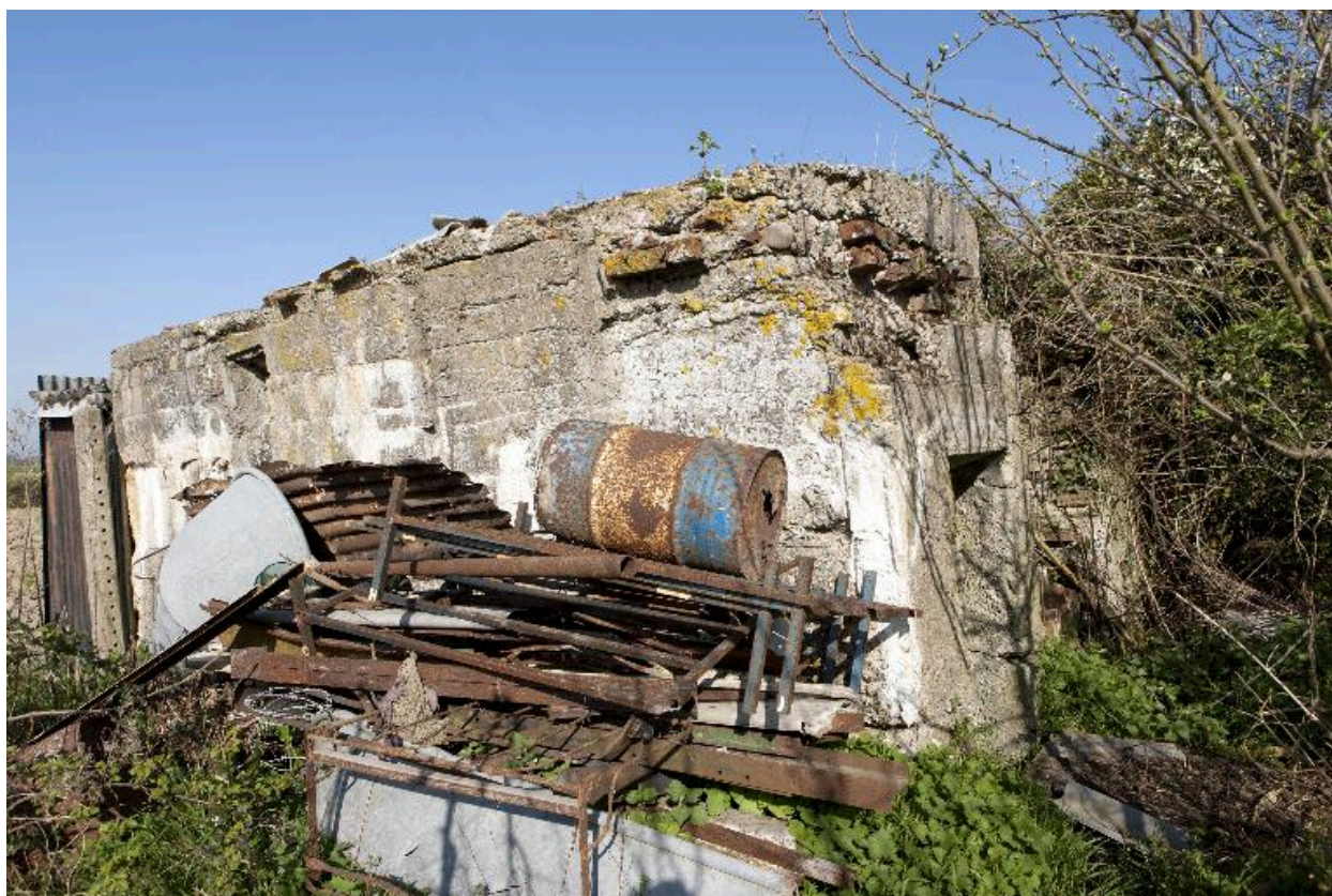
Casemate A vue de trois-quarts vers l'ouest