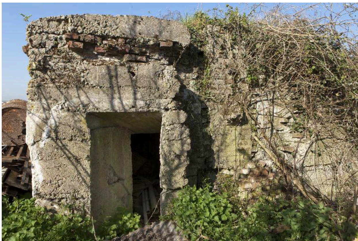
Casemate B, entrée sur l'élévation est