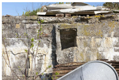
Casemate A. Ouverture sur l'élévation sud IVR31_20145905241NUCA