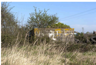
Casemate B, vers le nord IVR31_20145905243NUCA