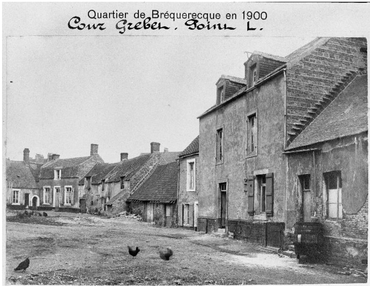
Vue générale sur cour, état en 1900.