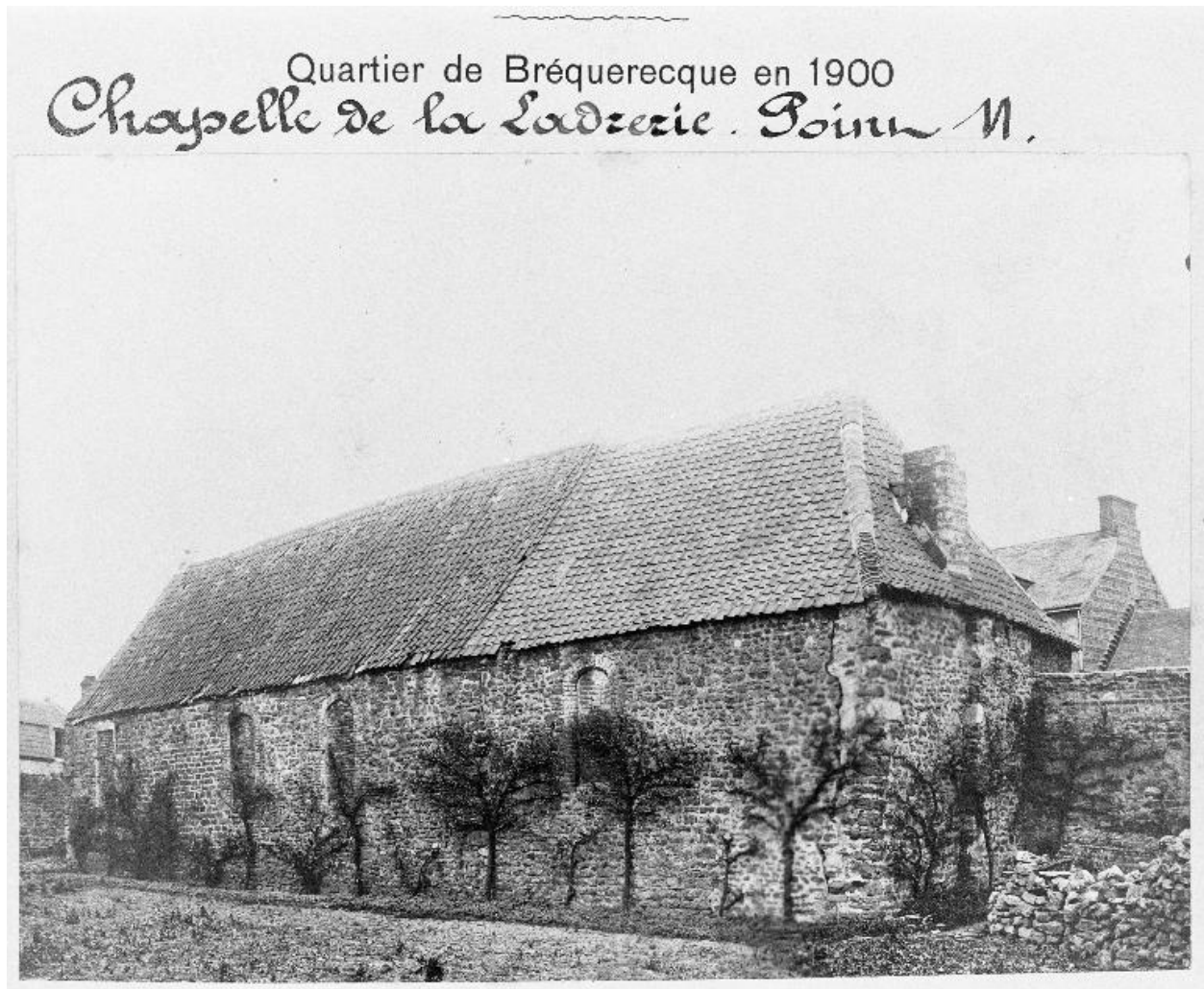
Chapelle, façade sur jardin potager, état en 1900.