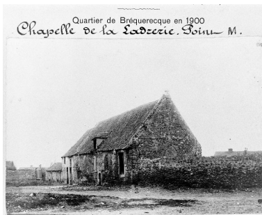
Chapelle, façade d'angle sur cour, état en 1900

Chapelle, bâtiments, vue générale sur cour, clichés vers 1900