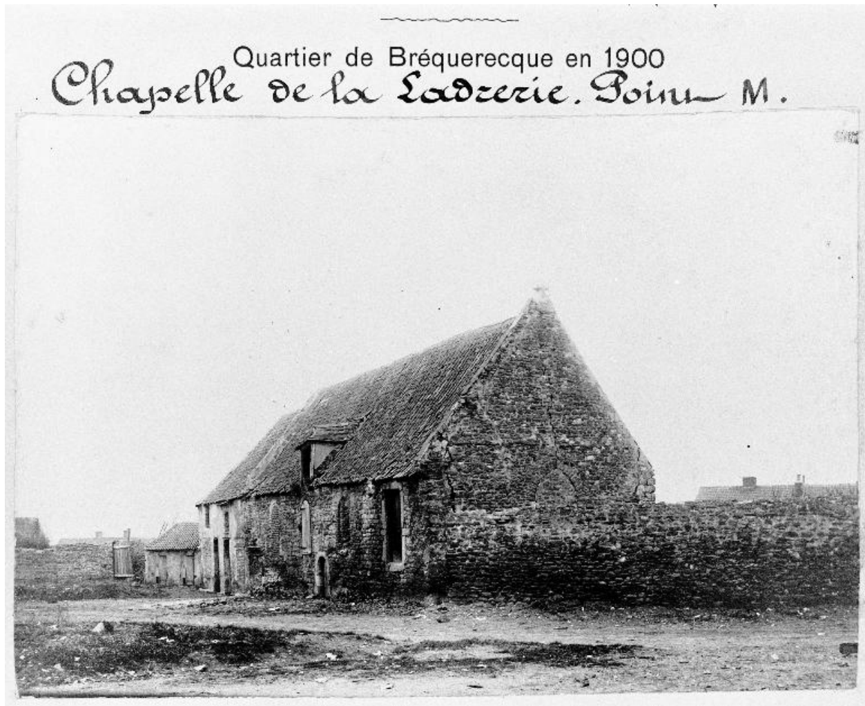
Chapelle, façade d'angle sur cour, état en 1900.