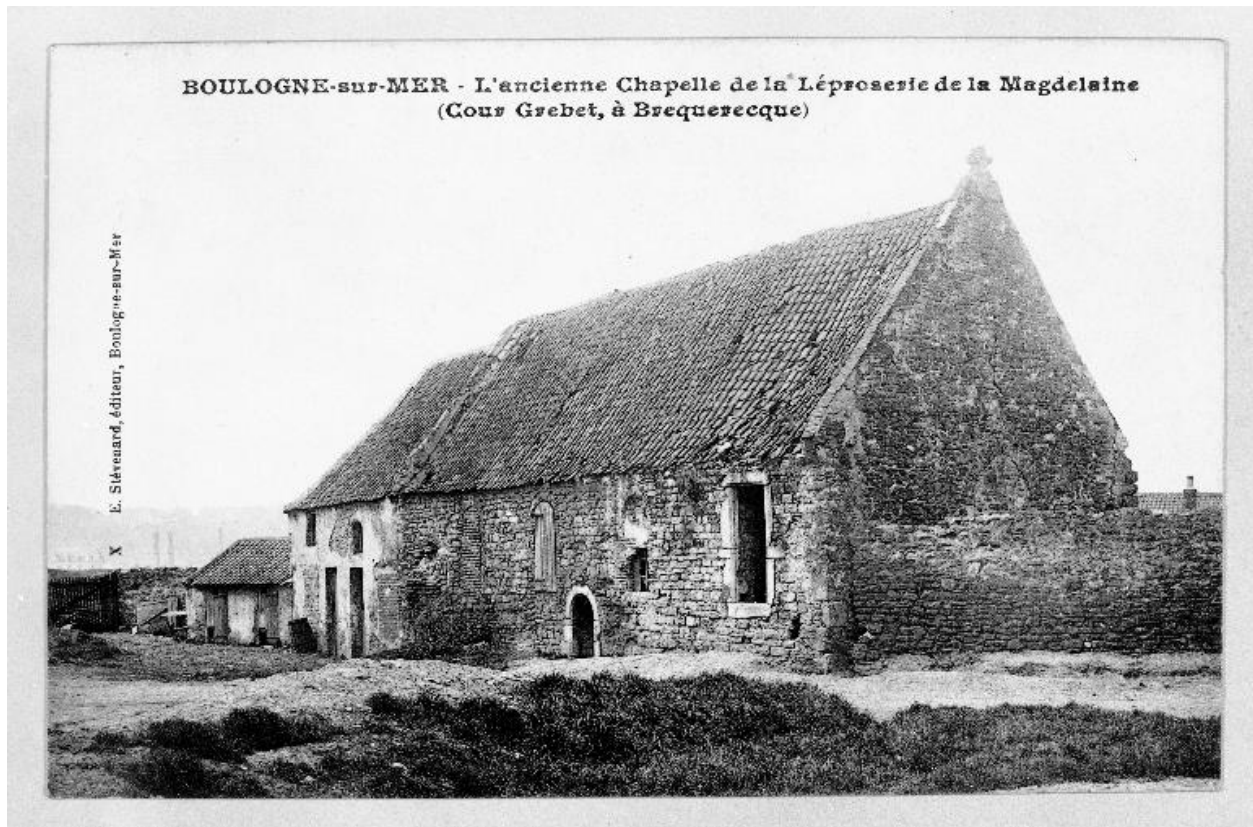
Chapelle, vue d'angle sur cour (BM Boulogne-sur-Mer).