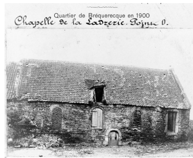
Chapelle, façade sur cour, état en 1900 (AC Boulogne-sur-Mer).

Vue générale sur cour, état en 1900 (AC Boulogne-sur-Mer).