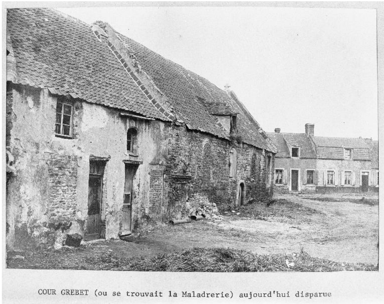
Chapelle, bâtiments, vue générale sur cour, clichés vers 1900.