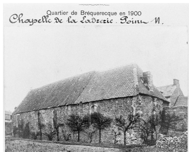
Chapelle, façade sur jardin potager, état en 1900 (AC Boulogne-sur-Mer). IVR31_19806201979XB