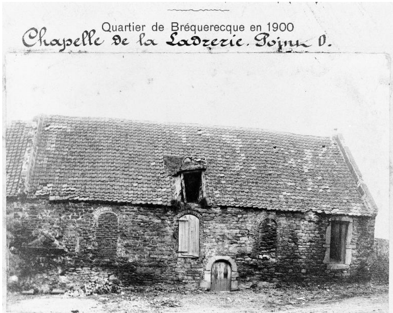
Chapelle, façade sur cour, état en 1900.