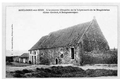
Chapelle, vue d'angle sur cour (BM Boulogne-sur-Mer). IVR31_19816200337XB