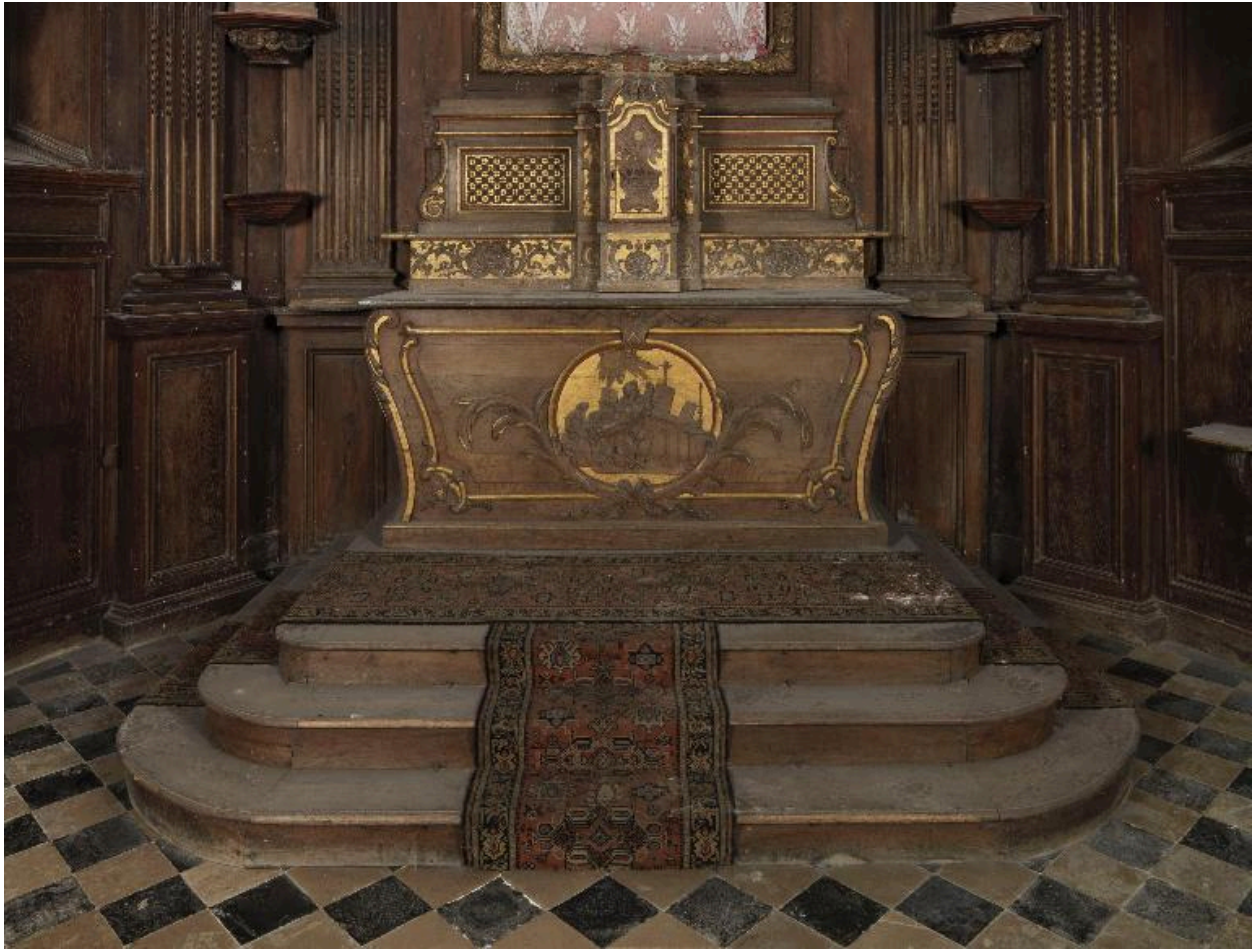
Maître-autel, gradin d'autel et tabernacle.