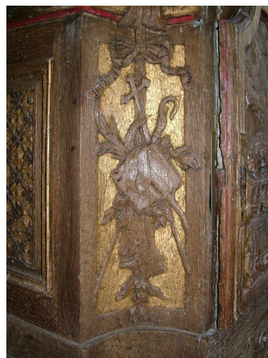
Détail du panneau concave gauche du tabernacle : trophée avec livre, croix, crosse et croix en sautoir, palme et rameau en sautoir, livre ouvert entouré d'une étoile. IVR22_20098005353NUCA