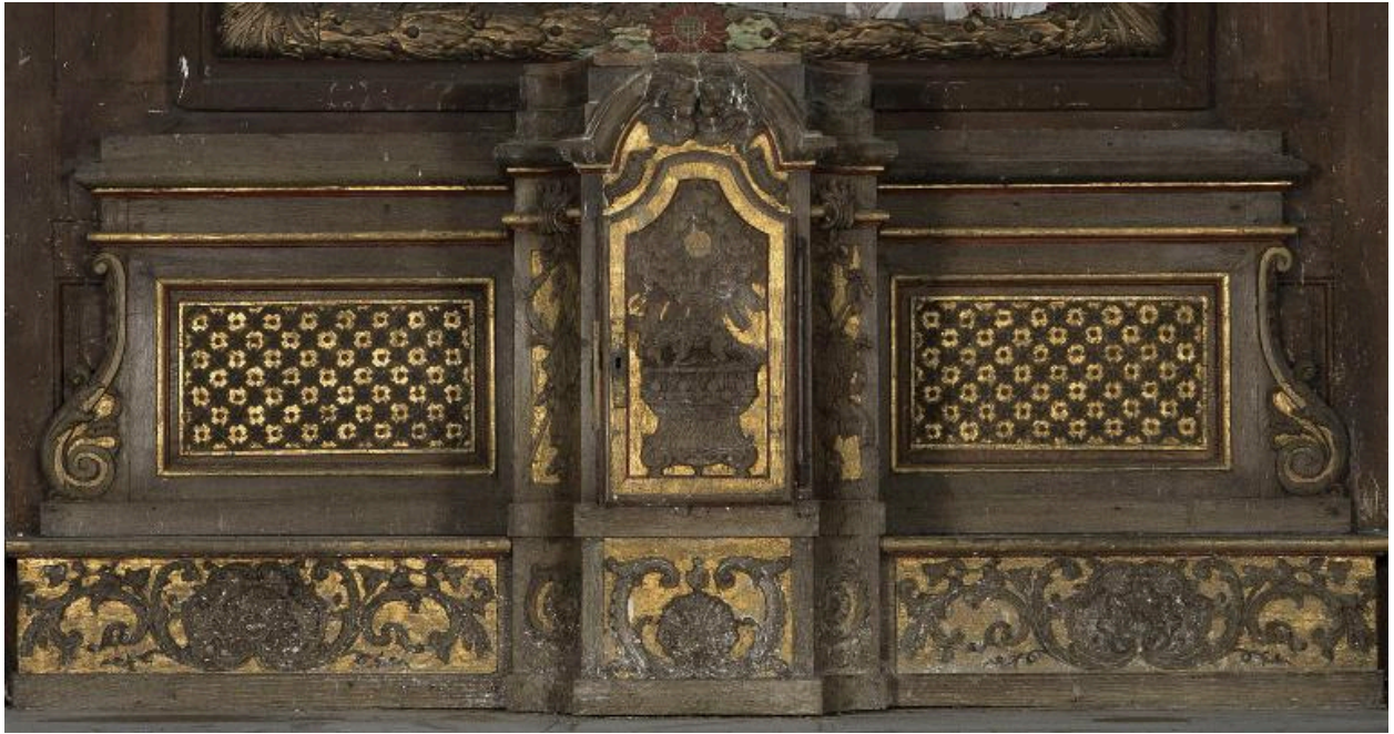
Gradin d'autel et tabernacle orné de l'agneau aux sept sceaux.