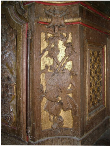
Détail du panneau concave droit du tabernacle : trophée avec aiguière, cartouche, étole, mitre, livre.

IVR22_20098005354NUCA