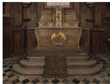
Maître-autel, gradin d'autel et tabernacle.