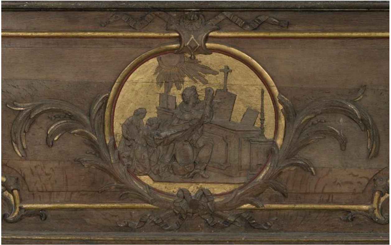
Détail du devant d'autel : la messe de saint Martin.