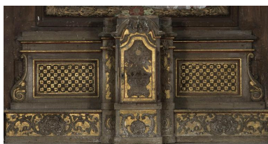
Gradin d'autel et tabernacle orné de l'agneau aux sept sceaux. IVR22_20138000623NUC2A