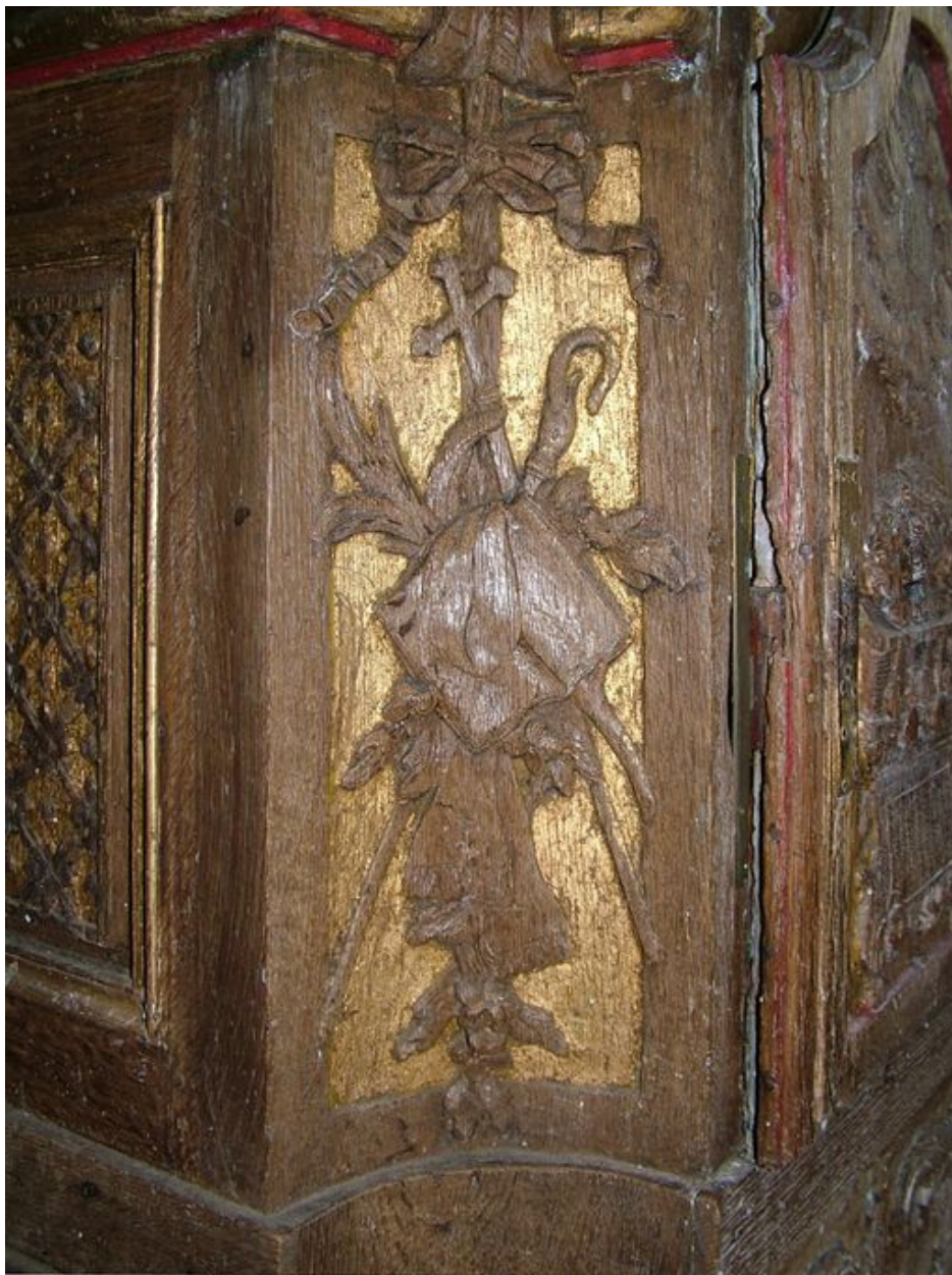
Détail du panneau concave gauche du tabernacle : trophée avec livre, croix, crosse et croix en sautoir, palme et rameau en sautoir, livre ouvert entouré d'une étoile.