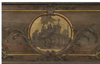
Détail du devant d'autel : la messe de saint Martin.