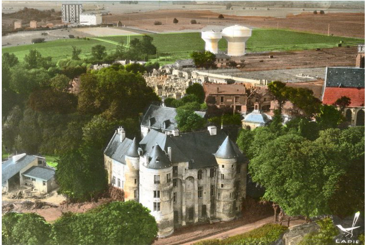
Construction d'une maison pour la société Usinor dans le parc du château de Montataire, début 1970.