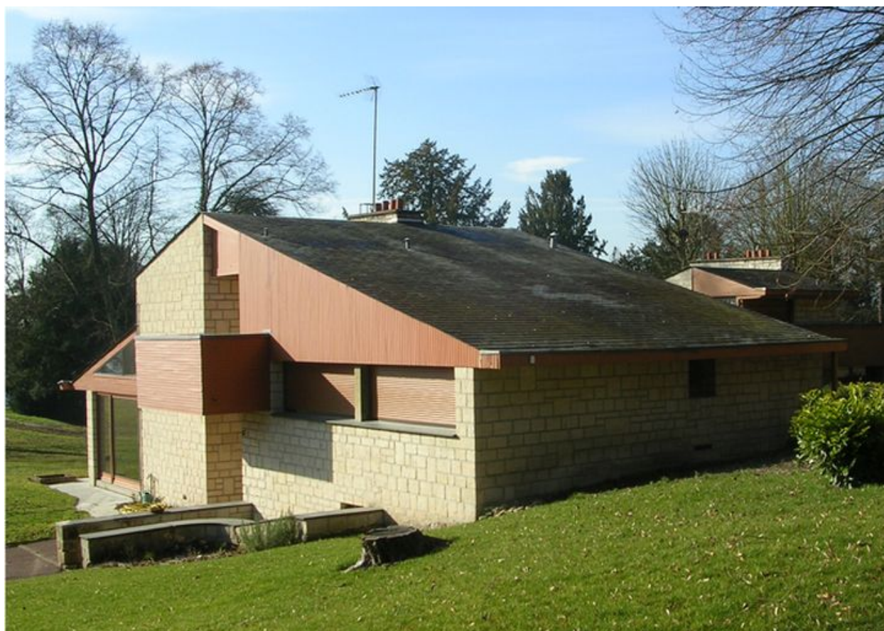
Une maison de la cité.