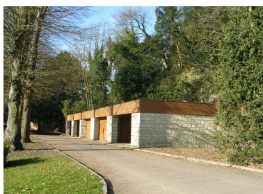
Garages de la cité. IVR22_20086005002NUCA