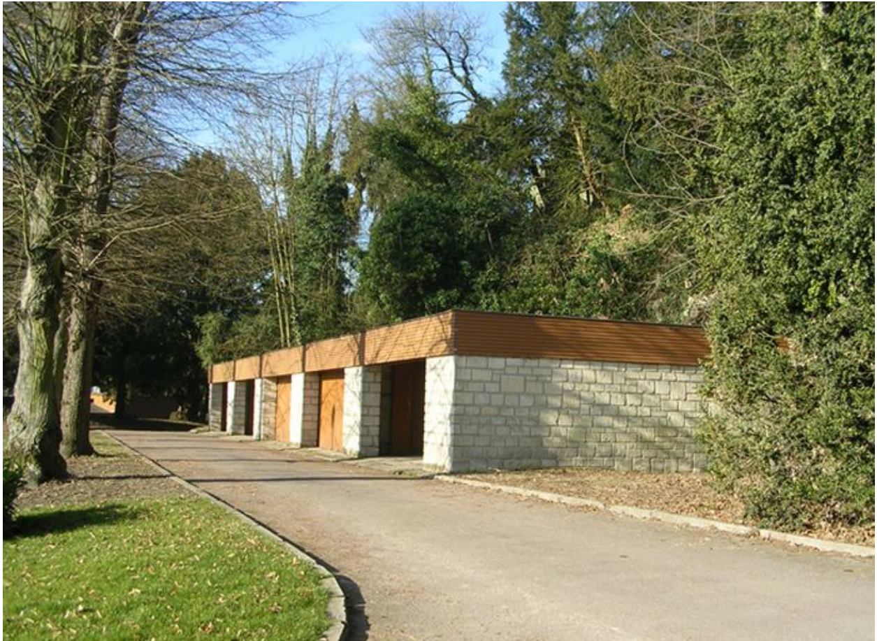
Garages de la cité.