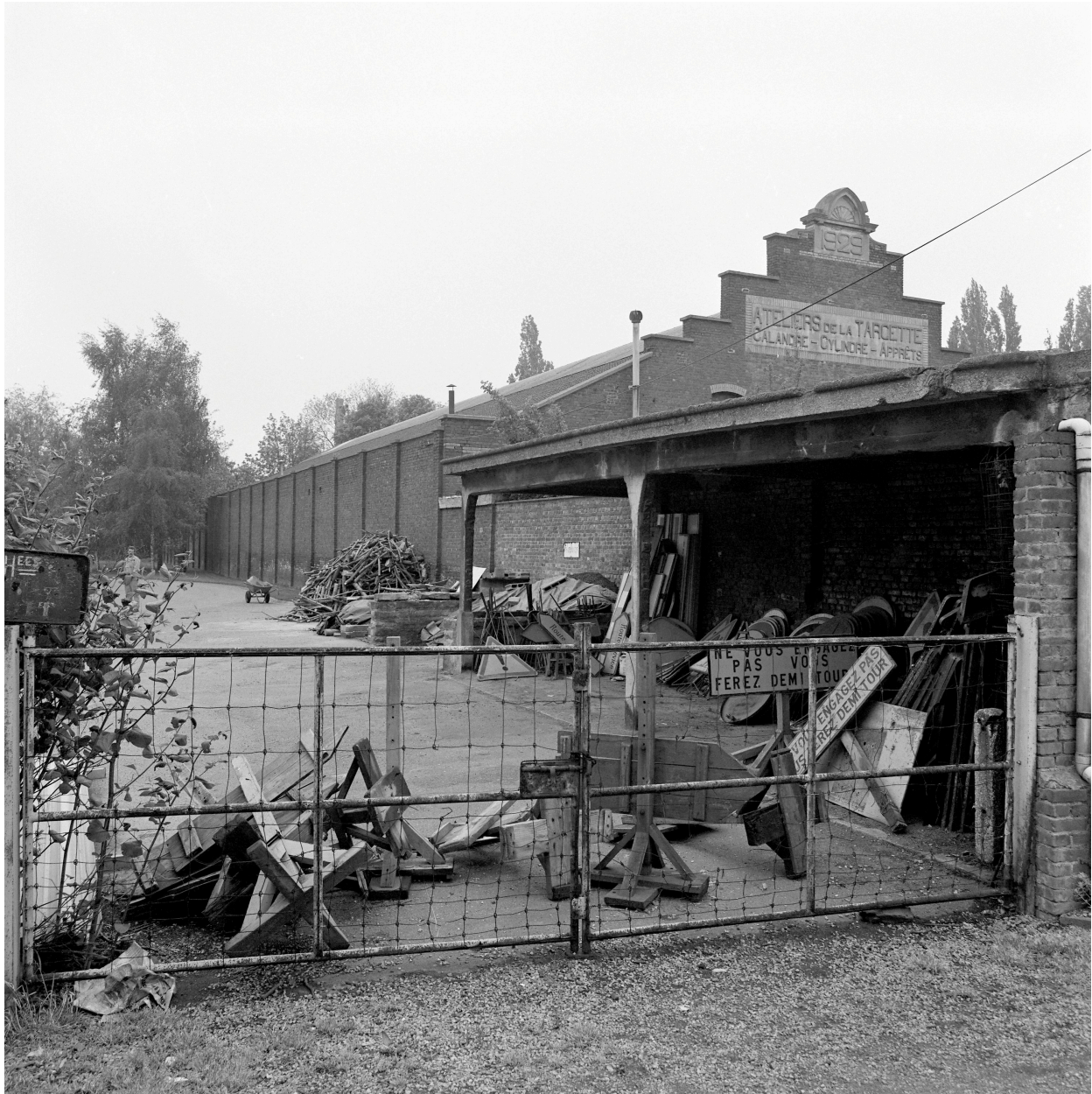
Atelier de fabrication. Vue prise depuis le quai de la Dérivation.