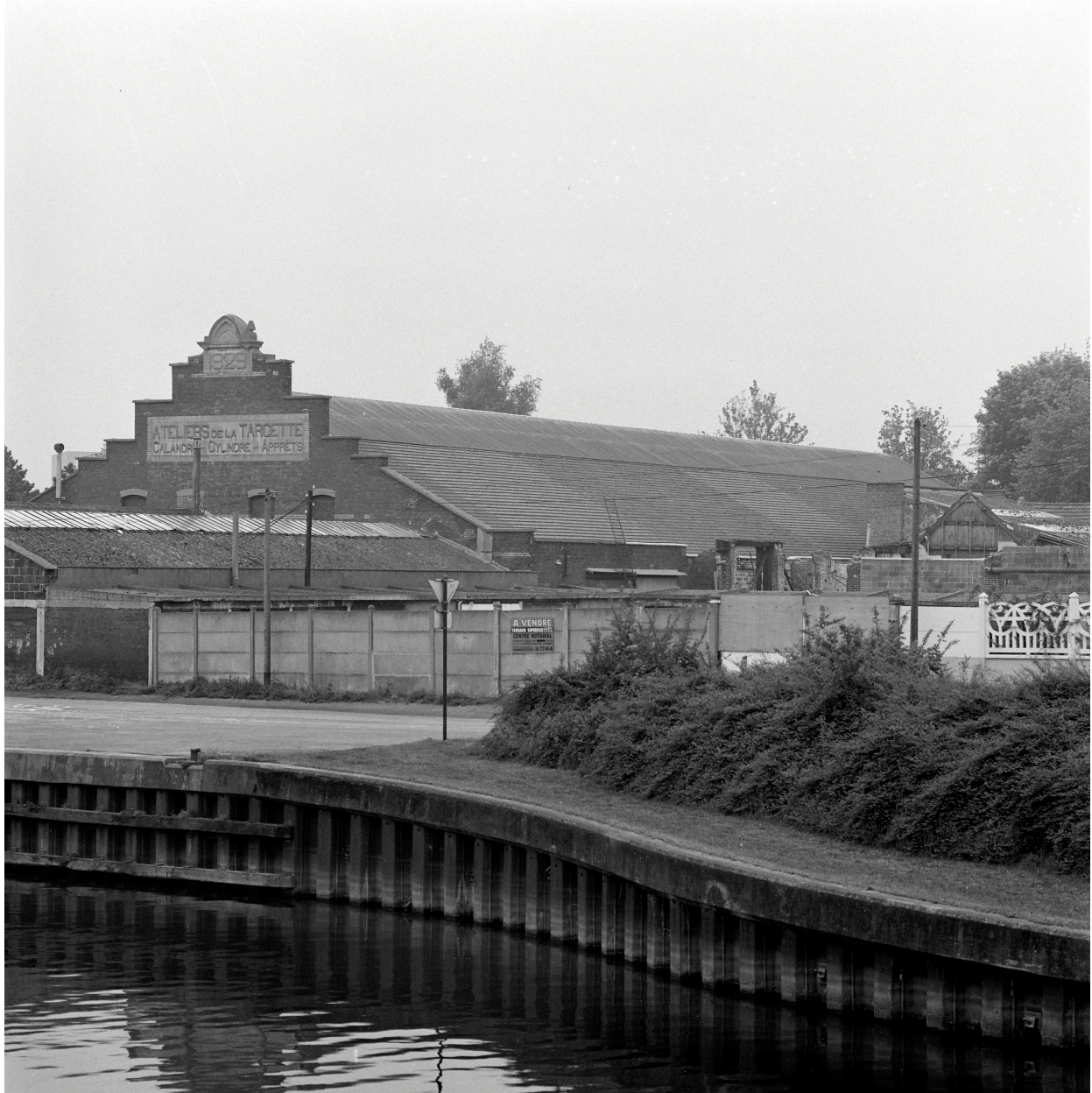
Atelier de fabrication. Vue prise depuis le pont de l'Attargette.