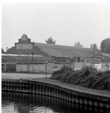
Atelier de fabrication. Vue prise depuis le pont de l'Attargette.

IVR31_19875901916X