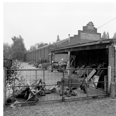
Atelier de fabrication. Vue prise depuis le quai de la Dérivation.

IVR31_19885900745X