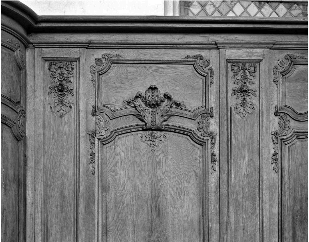
Détail du décor sculpté du lambris recouvrant la partie nord du sanctuaire.