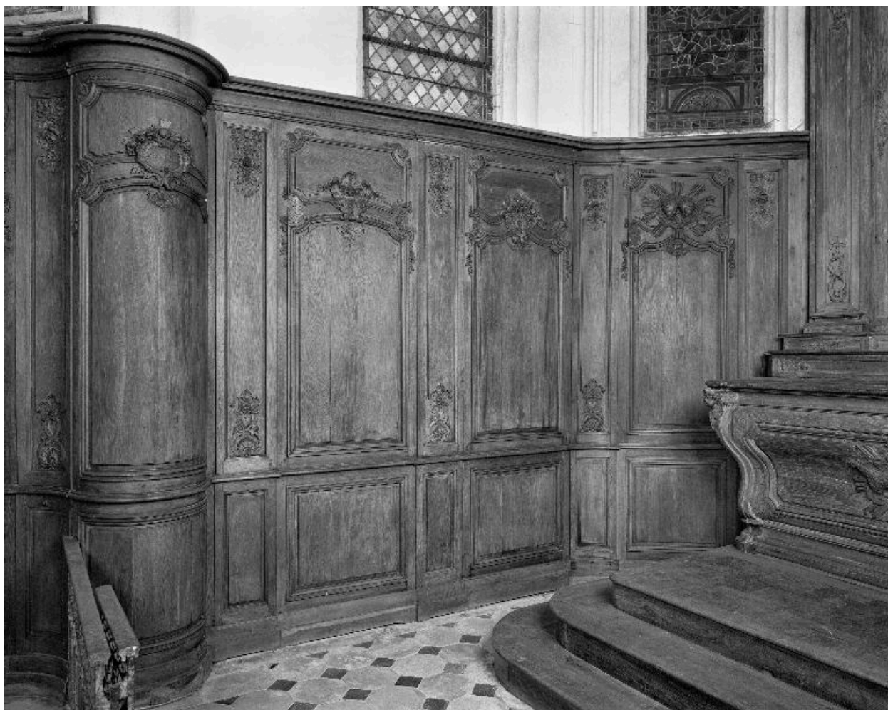
Vue du lambris qui recouvre la partie nord du sanctuaire.