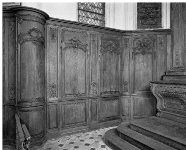
Vue du lambris qui recouvre la partie nord du sanctuaire.