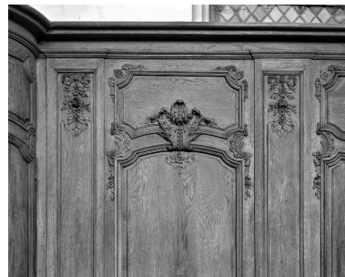
Détail du décor sculpté du lambris recouvrant la partie nord du sanctuaire. IVR22_19920202337V