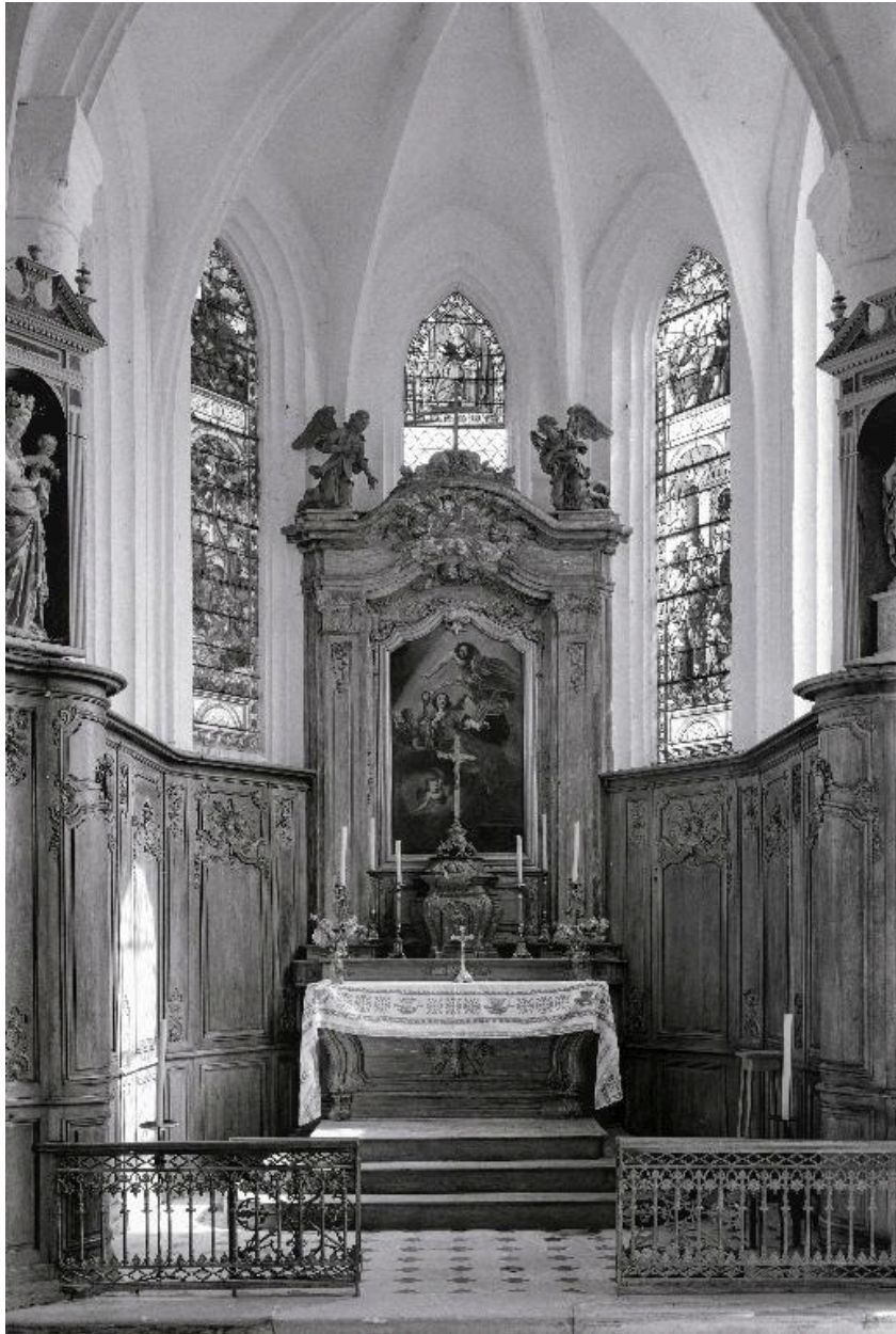
Vue générale du sanctuaire et de son lambris de demi-revêtement.