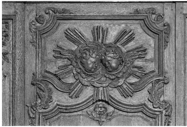
Détail du décor sculpté du lambris du sanctuaire.