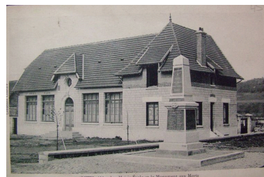
Edifice juste après sa reconstruction.