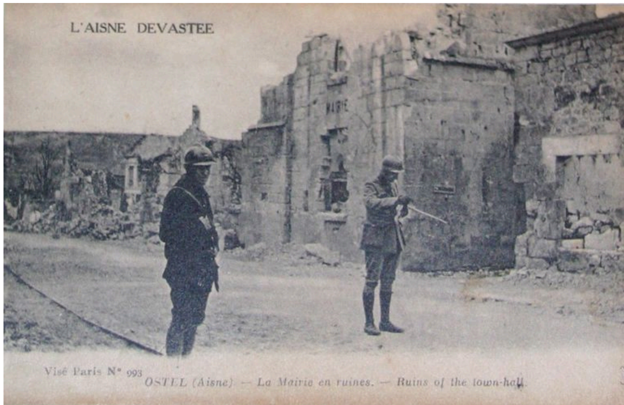
Vue de la mairie pendant les conflits.