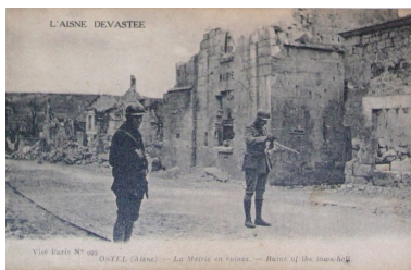
Vue de la mairie pendant les conflits (coll. part).