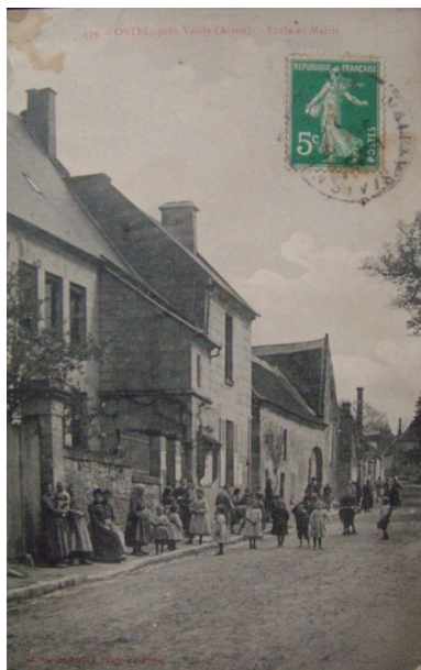
Vue de l'ancien édifice.