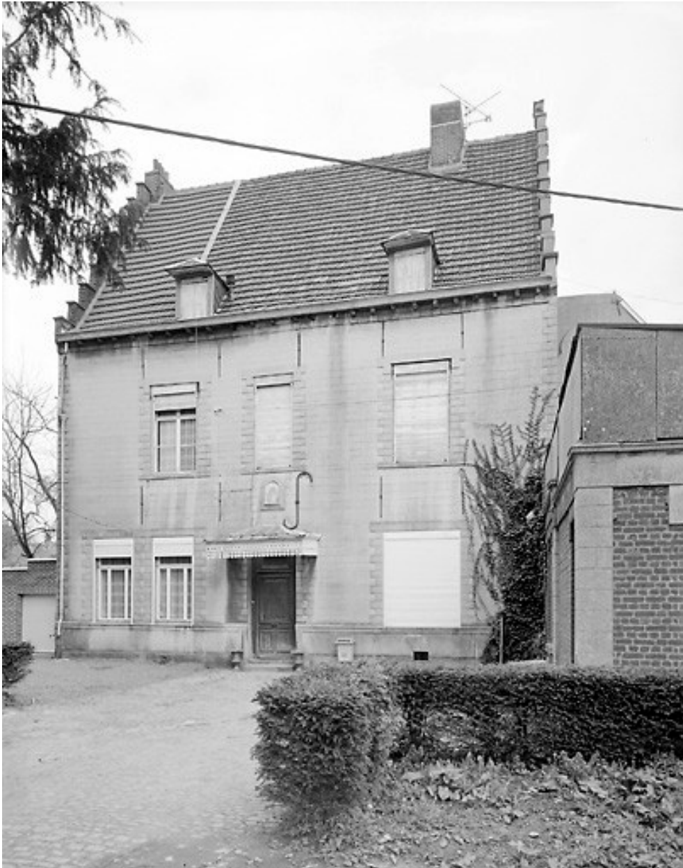
Élévation principale côté place Saint-Wasnon.