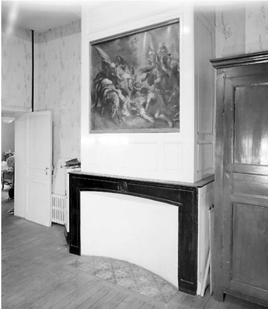
Intérieur, premier étage, pièce sud-est, vue partielle : cheminée.