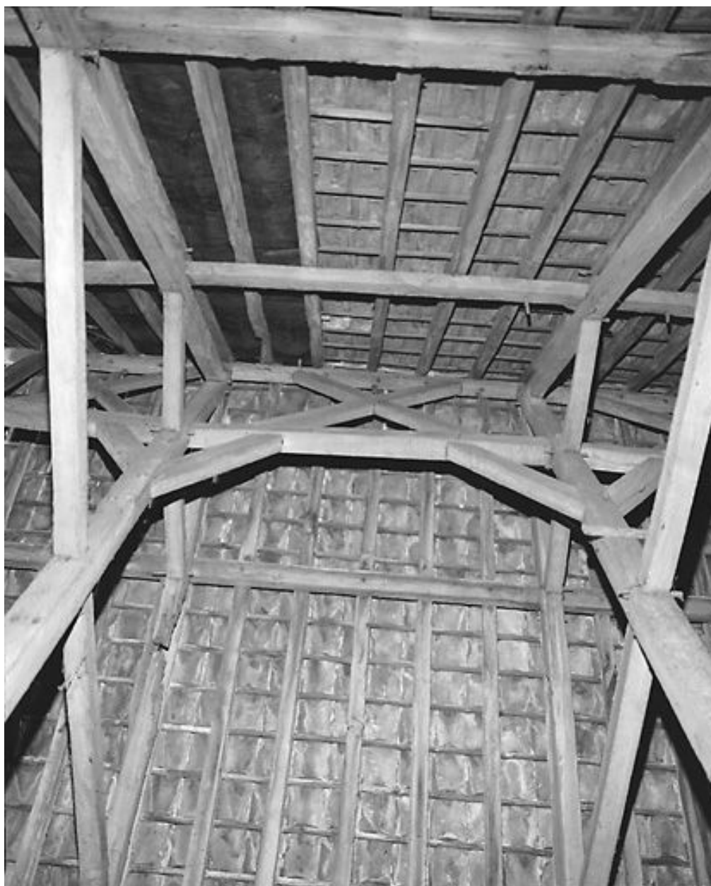
Intérieur, étage de comble : charpente, vue d'une travée entre deux fermes.