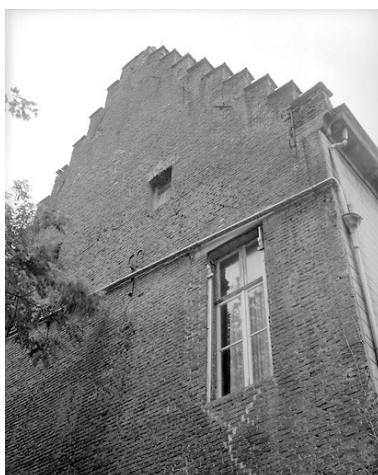
Mur pignon côté nord-ouest : détail, vue de la partie supérieure. IVR31_20035900968X