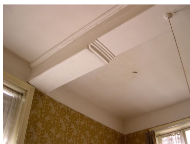
Intérieur, premier étage, pièce sud-ouest : plafond, vue partielle, about de poutre mouluré. IVR31_20065906123NUCA