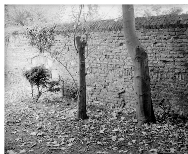
Jardin, mur de clôture en mitoyenneté avec le terrain de l'ancien cimetière, vue partielle : porte condamnée (à gauche) ; au ras du sol, date dessinée par des briques en saillie : 1732. IVR31_20035900970X