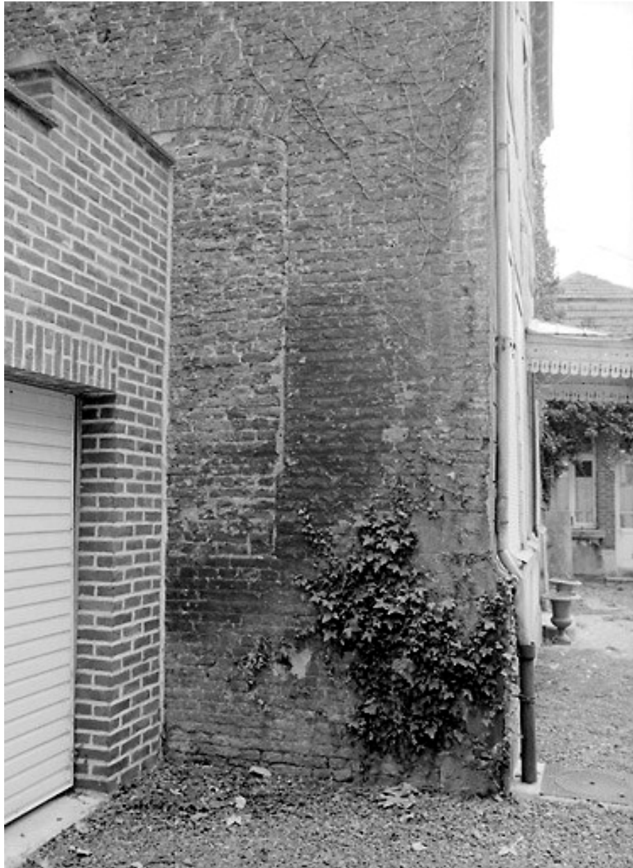
Mur pignon côté nord-ouest, vue partielle : baie condamnée comprenant un ébrasement chanfreiné ; solin de façade taluté en pierre.