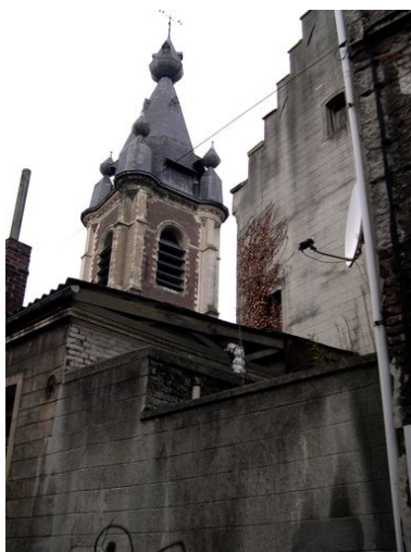
Vue depuis la rue Dervaux vers la tour de l'église Saint-Wasnon.