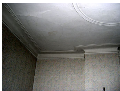
Intérieur, rez-de-chaussée, pièce nord-ouest : plafond, vue partielle. IVR31_20065906114NUCA