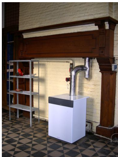
Intérieur, rez-de-chaussée, pièce sud-est : manteau de cheminée. IVR31_20065906115NUCA