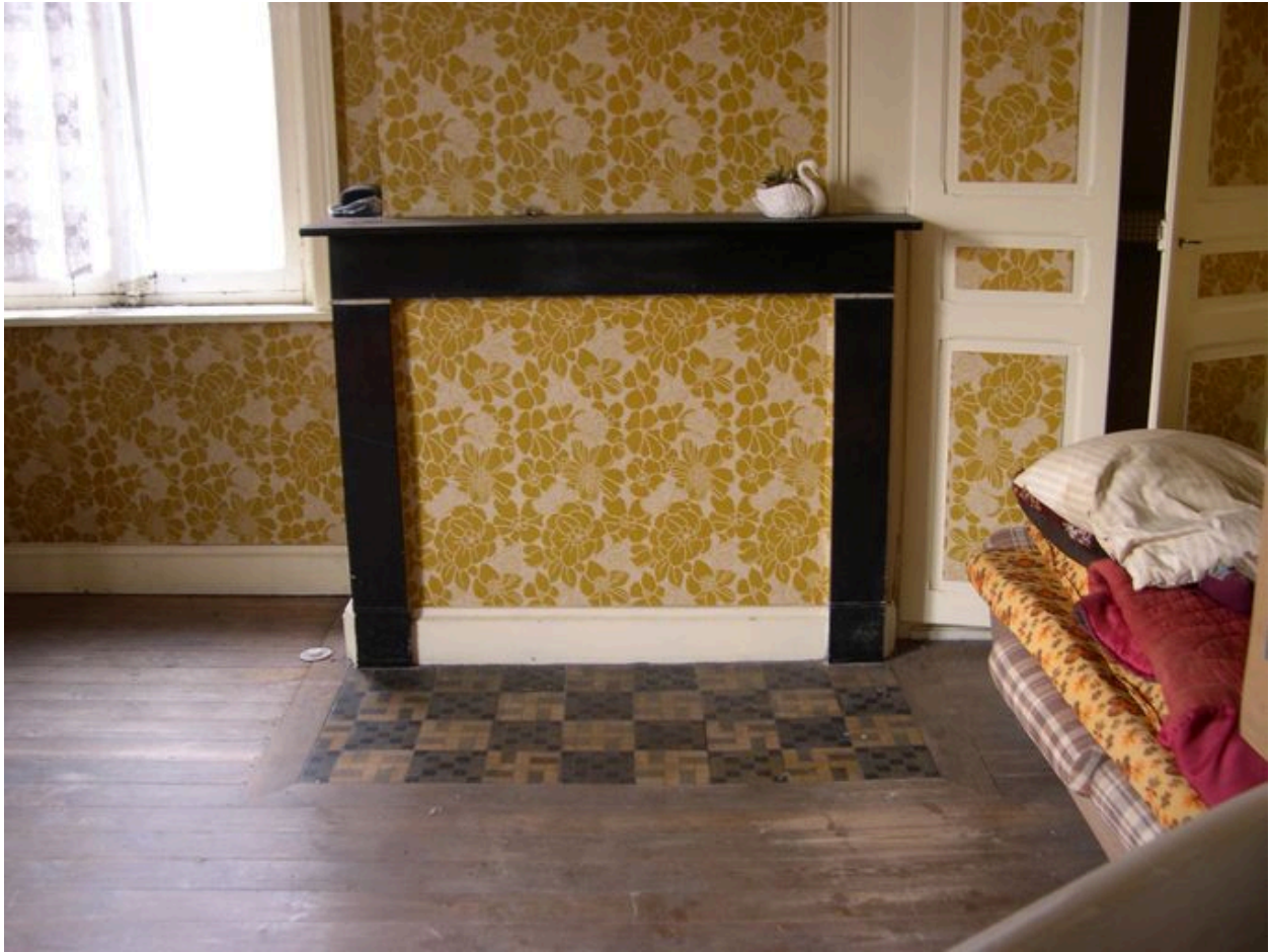
Intérieur, premier étage, pièce sud-ouest, vue partielle : cheminée.