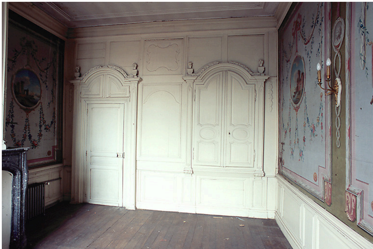
Intérieur, premier étage, salle nord-est dite salle des bateliers, vue partielle : porte, lambris de hauteur et placards.