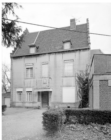
Élévation principale côté place Saint-Wasnon.