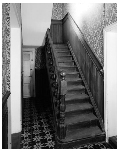
Intérieur, rez-de-chaussée, couloir : montée de l'escalier vers le 1er étage. IVR31_20035900949V