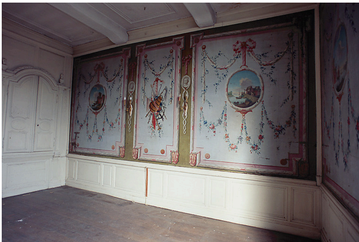
Intérieur, premier étage, salle nord-est dite salle des bateliers, vue partielle : toiles peintes.