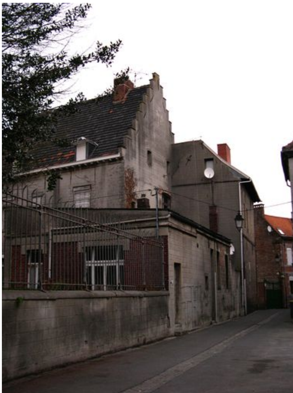
Vue de l'édifice depuis la rue Dervaux. Au premier plan, corps de bâtiment en rez-de-chaussée adjoint dans les années 1930.