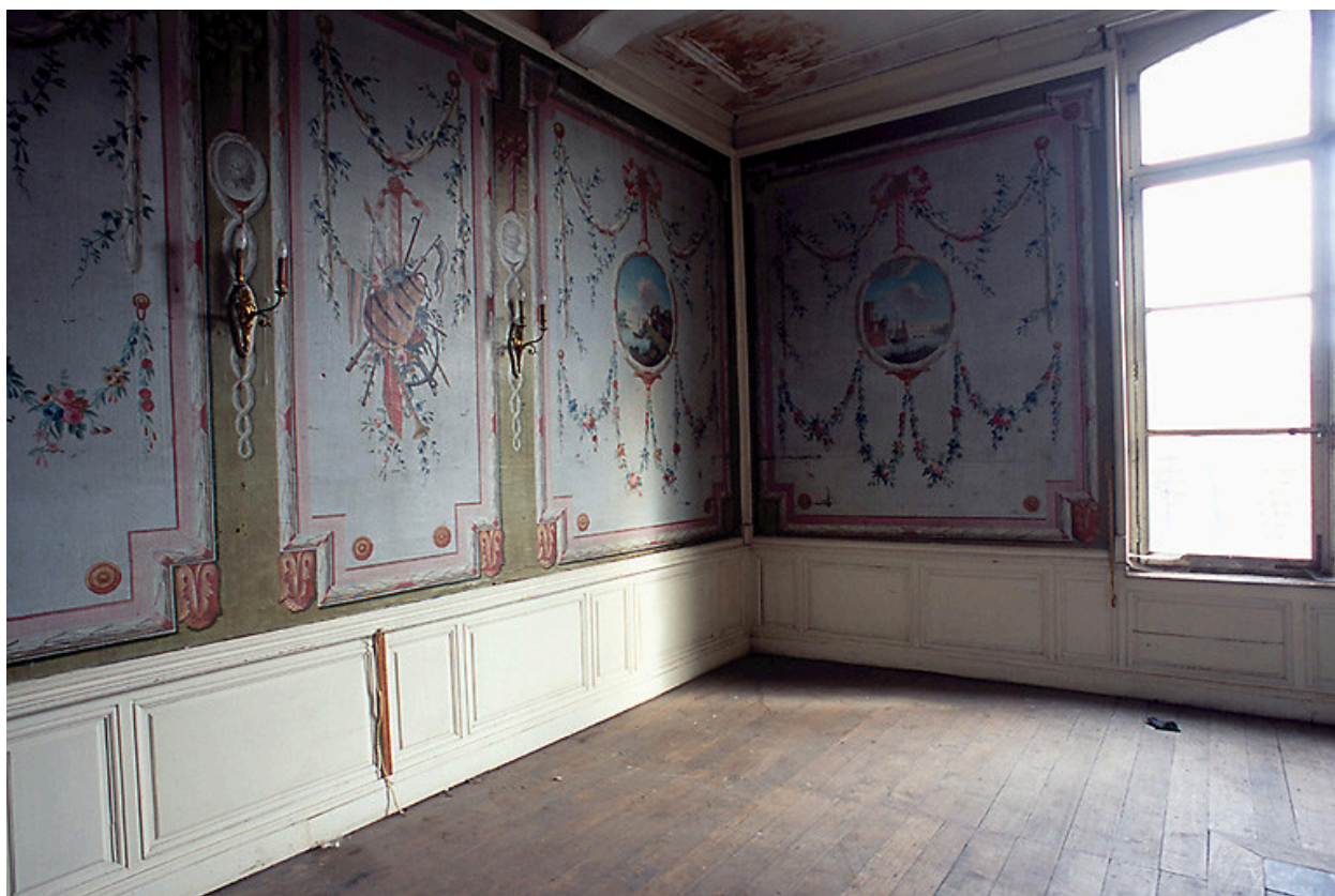
Intérieur, premier étage, salle nord-est dite salle des bateliers, vue partielle : toiles peintes avec retour côté fenêtre.