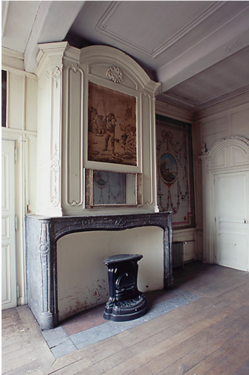
Intérieur, premier étage, salle nord-est dite salle des bateliers : vue partielle, cheminée et toile peinte à sa droite.