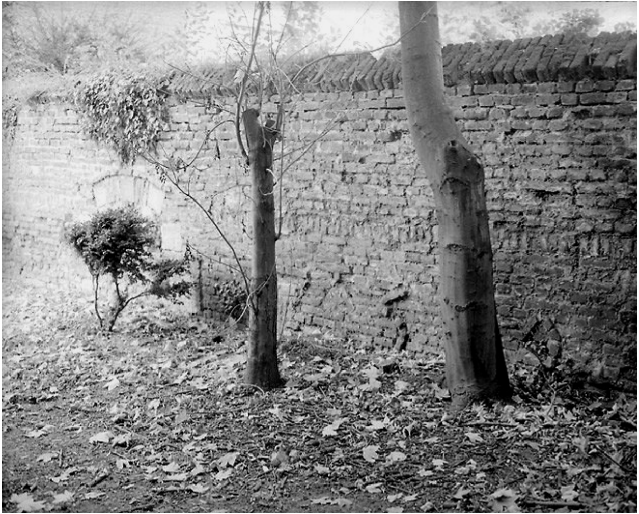
Jardin, mur de clôture en mitoyenneté avec le terrain de l'ancien cimetière, vue partielle : porte condamnée (à gauche) ; au ras du sol, date dessinée par des briques en saillie : 1732.