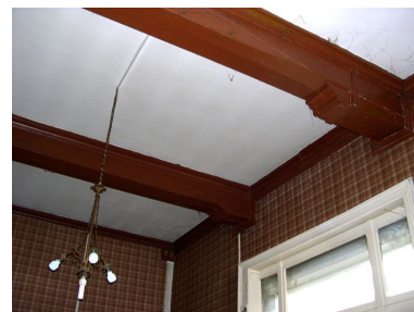
Intérieur, rez-de-chaussée, pièce sud-est : plafond, vue partielle, abouts de poutres moulurés.