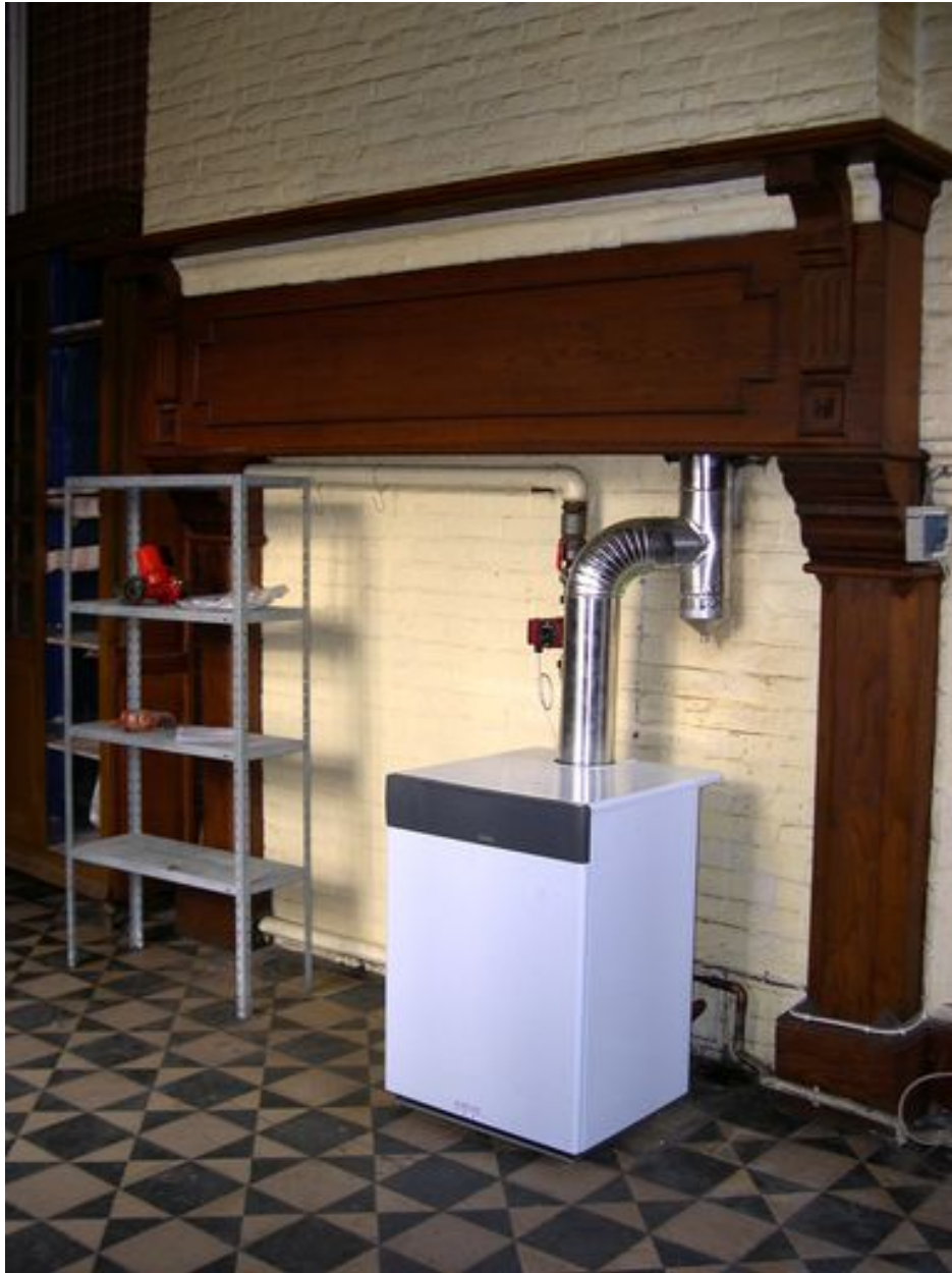
Intérieur, rez-de-chaussée, pièce sud-est : manteau de cheminée.