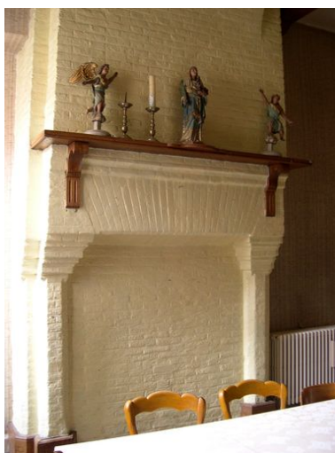
Intérieur, rez-de-chaussée, pièce nord-est : manteau de cheminée.