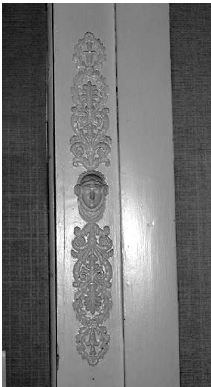
Intérieur, rez-de-chaussée, pièce sud-ouest, trumeau de cheminée, détail : jouxtant le pilastre de gauche, un visage de femme.