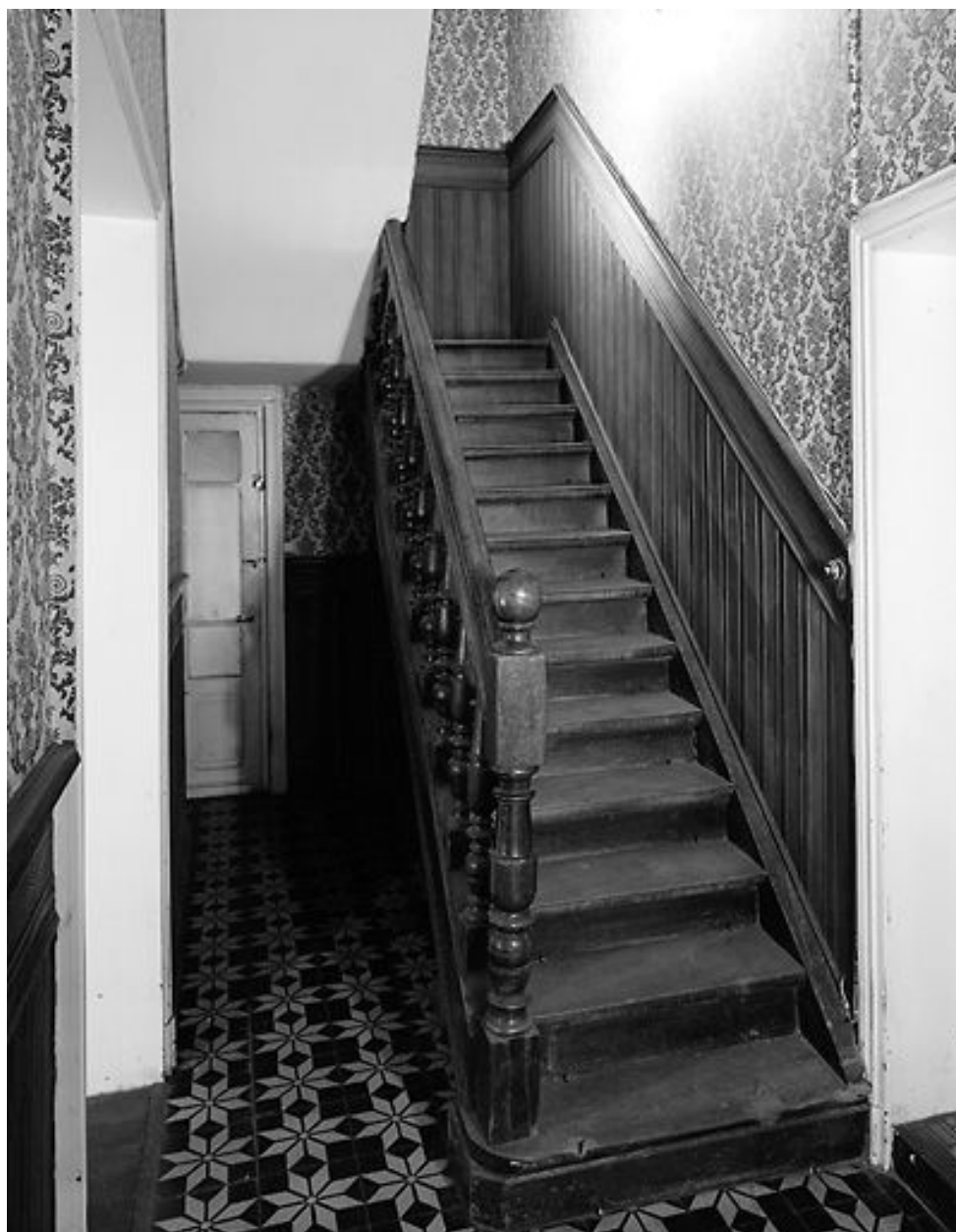
Intérieur, rez-de-chaussée, couloir : montée de l'escalier vers le 1er étage.