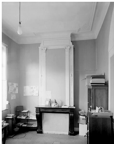
Intérieur, rez-de-chaussée, pièce sud-ouest : vue générale vers la cheminée. IVR31_20035900959V