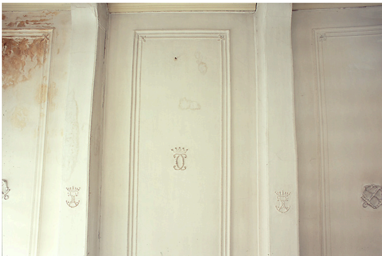
Intérieur, premier étage, salle nord-est dite salle des bateliers : plafond, vue partielle.