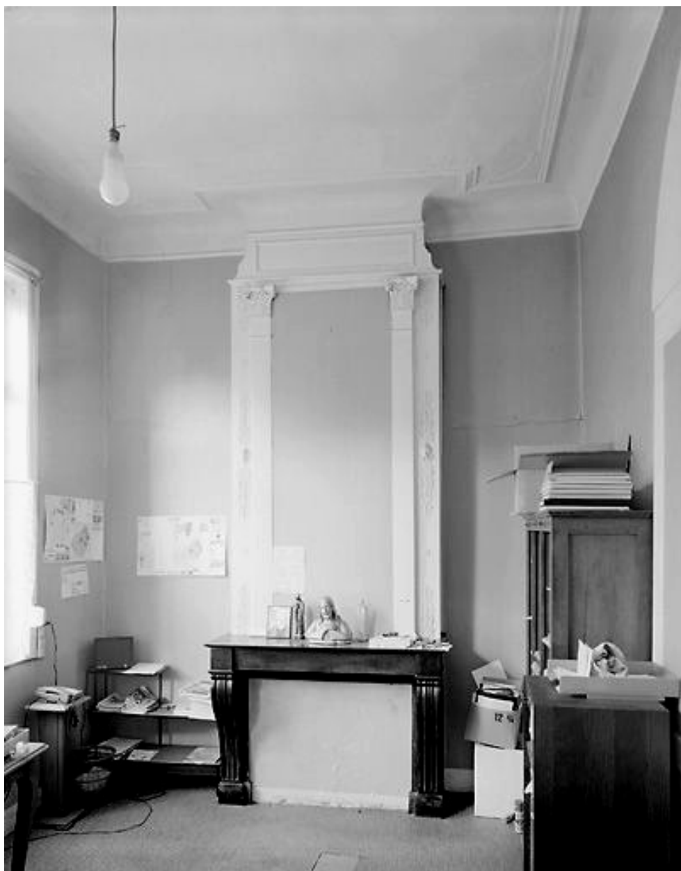
Intérieur, rez-de-chaussée, pièce sud-ouest : vue générale vers la cheminée.