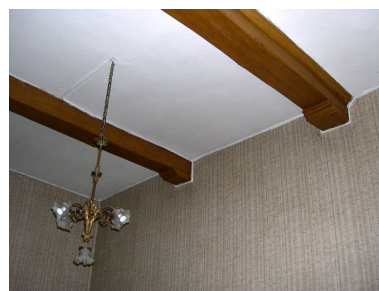
Intérieur, rez-de-chaussée, pièce nord-est : plafond, vue partielle, abouts de poutres moulurés. IVR31_20065906119NUCA