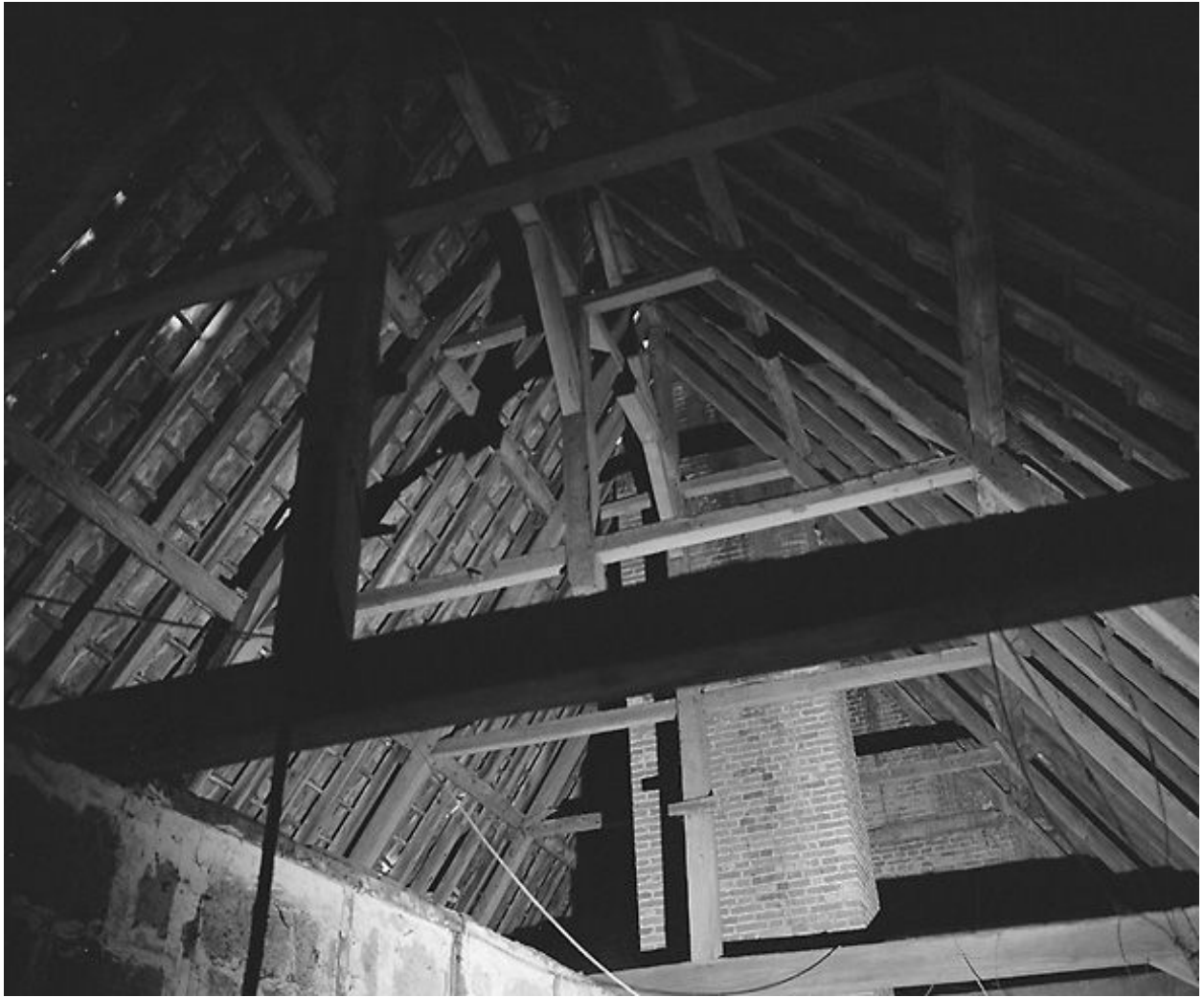
Intérieur, étage de comble : charpente, vue longitudinale vers l'est.