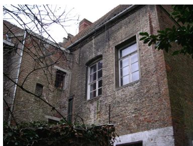
Façade arrière, vue partielle : étage. IVR31_20065906106NUCA