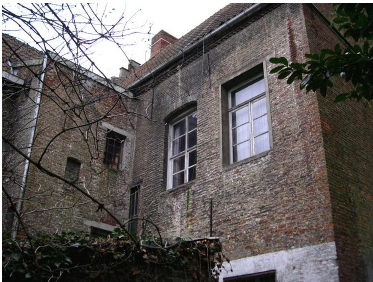
Façade arrière, vue partielle : étage.