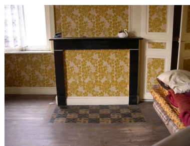
Intérieur, premier étage, pièce sud-ouest, vue partielle : cheminée.