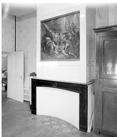
Intérieur, premier étage, pièce sud-est, vue partielle : cheminée.