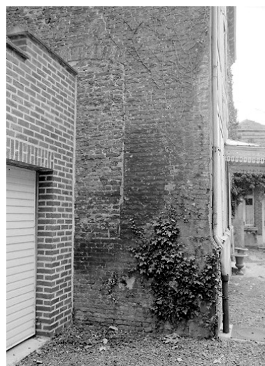
Mur pignon côté nord-ouest, vue partielle : baie condamnée comprenant un ébrasement chanfreiné ; solin de façade taluté en pierre. IVR31_20035900967X