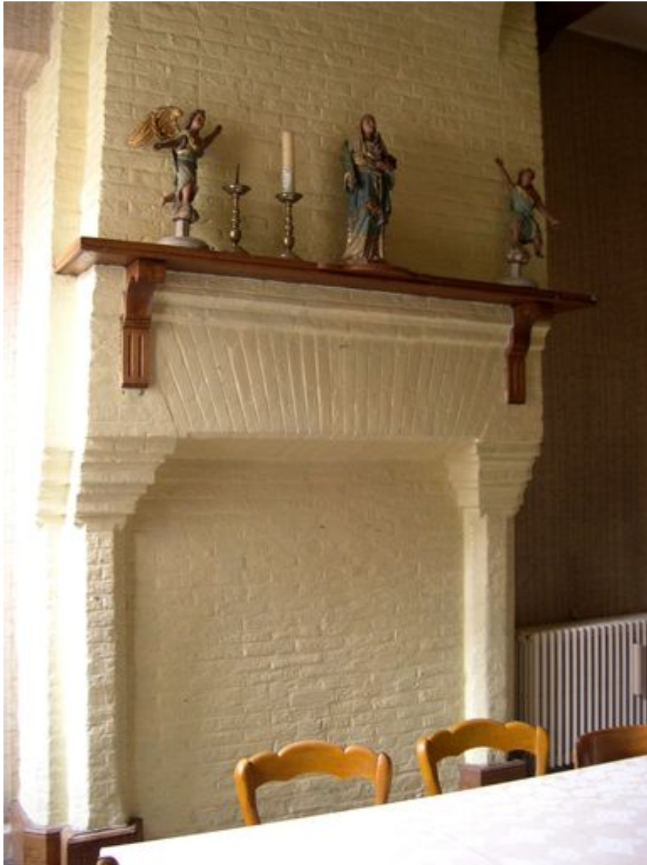
Intérieur, rez-de-chaussée, pièce nord-est : manteau de cheminée.