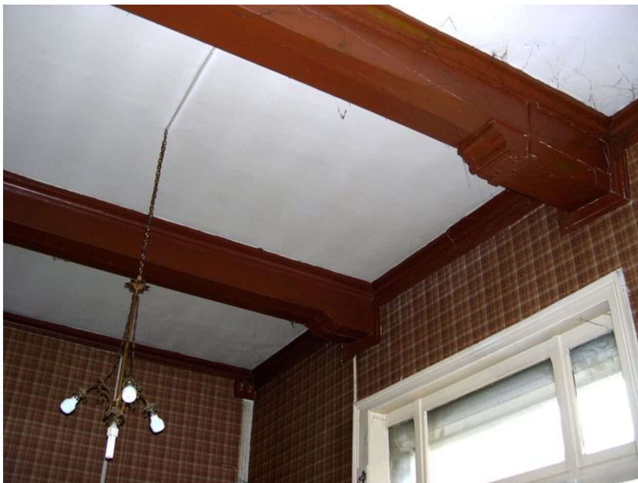
Intérieur, rez-de-chaussée, pièce sud-est : plafond, vue partielle, abouts de poutres moulurés.