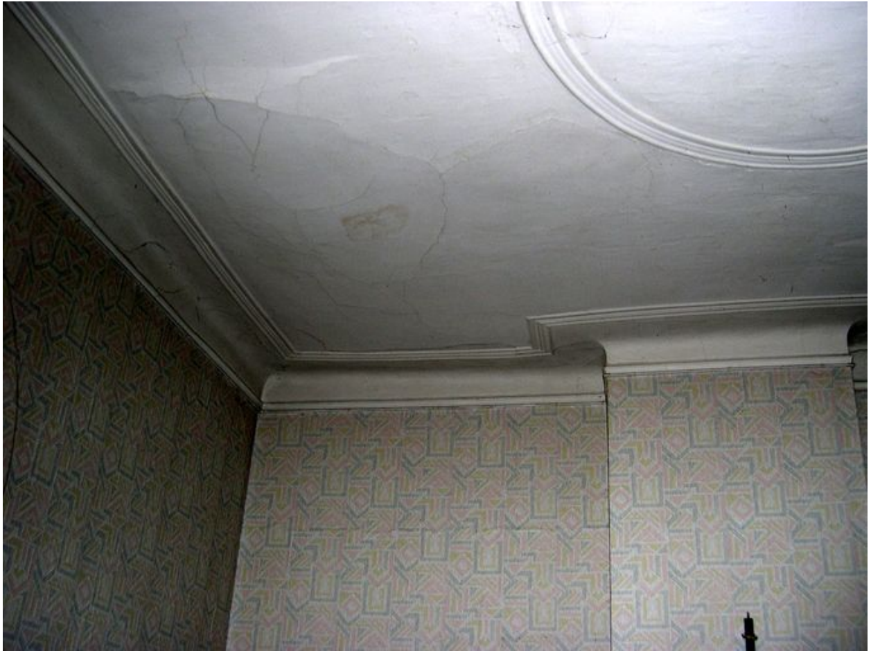
Intérieur, rez-de-chaussée, pièce nord-ouest : plafond, vue partielle.