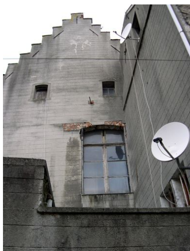
Façade latérale sud-est, vue partielle : pignon à redents, baie de la salle des bateliers.