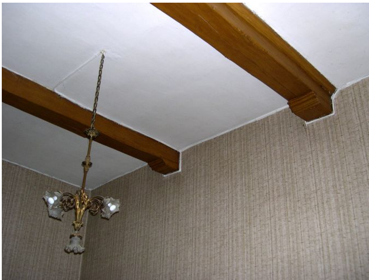
Intérieur, rez-de-chaussée, pièce nord-est : plafond, vue partielle, abouts de poutres moulurés.