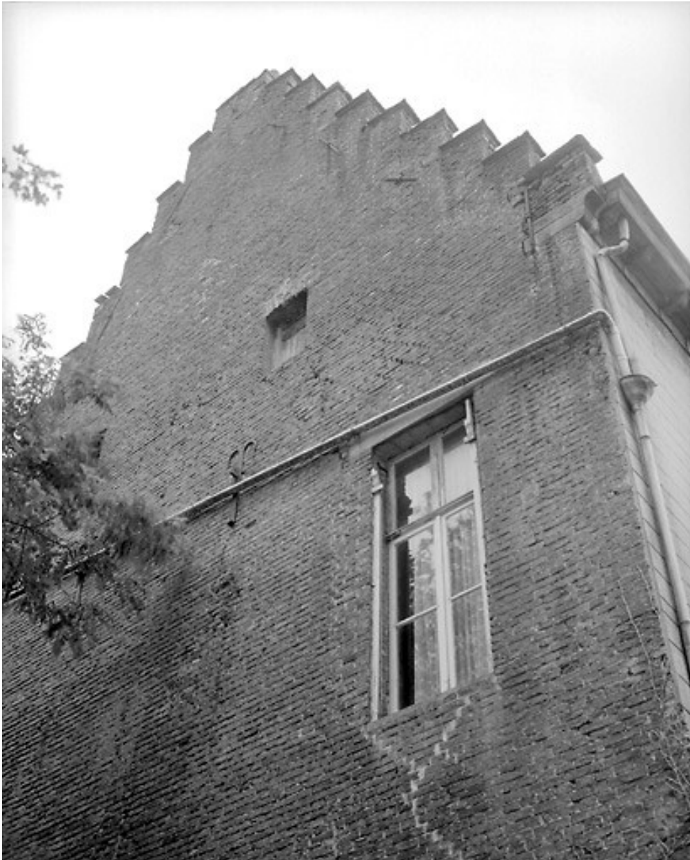
Mur pignon côté nord-ouest : détail, vue de la partie supérieure.