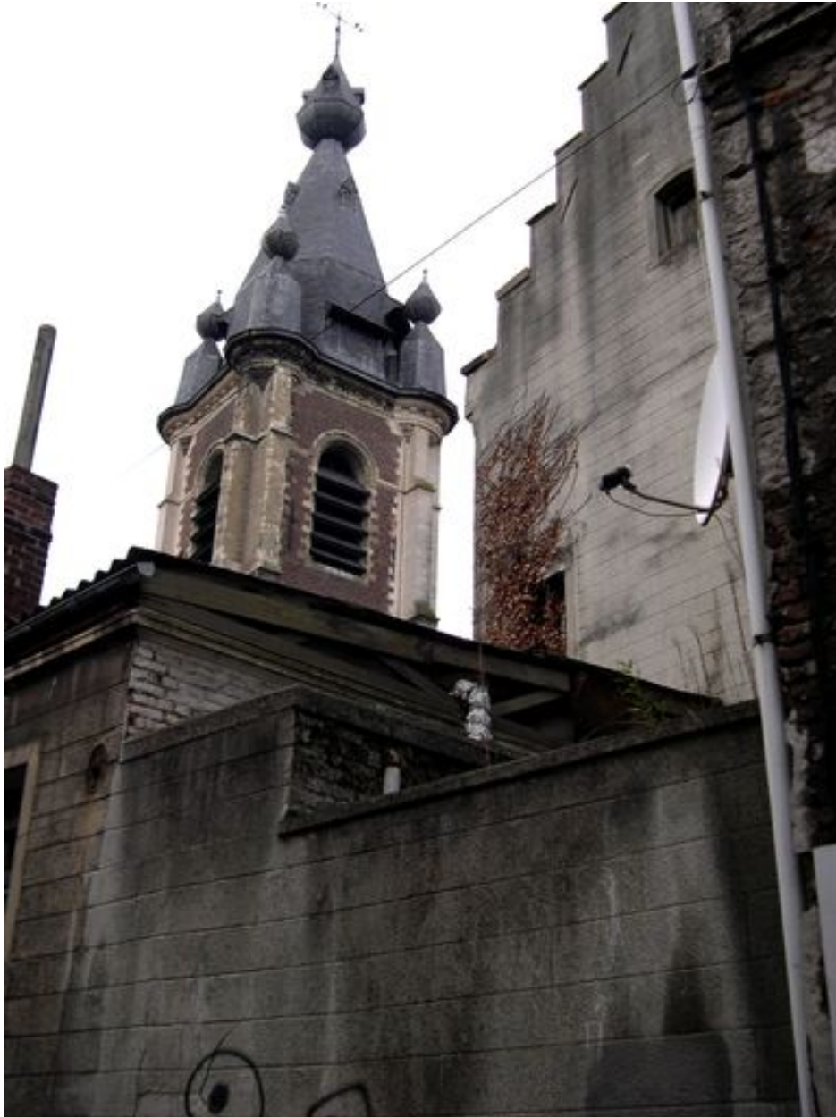
Vue depuis la rue Dervaux vers la tour de l'église Saint-Wasnon.