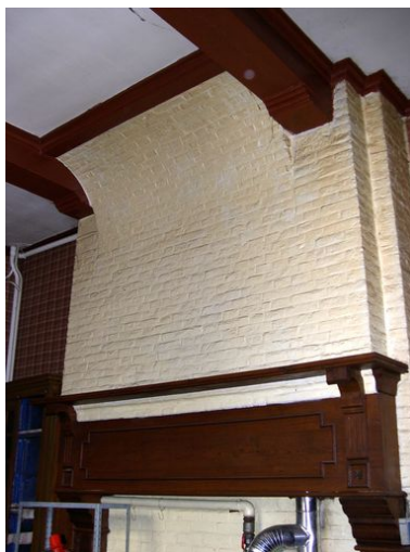
Intérieur, rez-de-chaussée, pièce sud-est : trumeau de cheminée. IVR31_20065906116NUCA