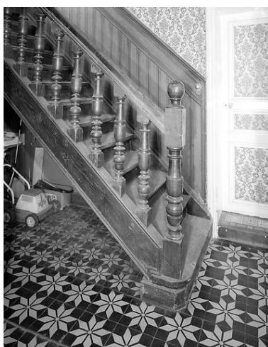
Intérieur, rez-de-chaussée, couloir : escalier, départ de la volée.