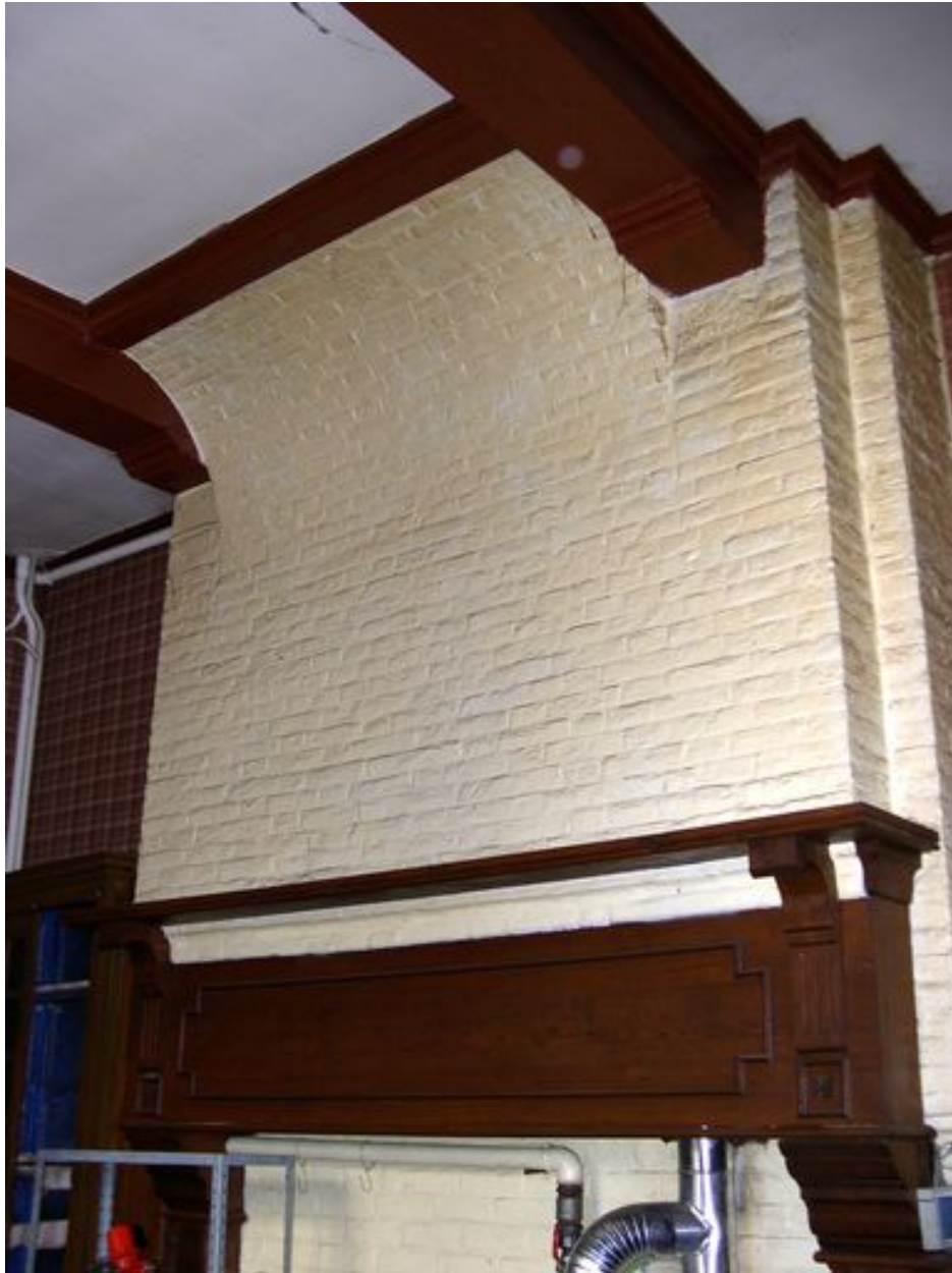
Intérieur, rez-de-chaussée, pièce sud-est : trumeau de cheminée.