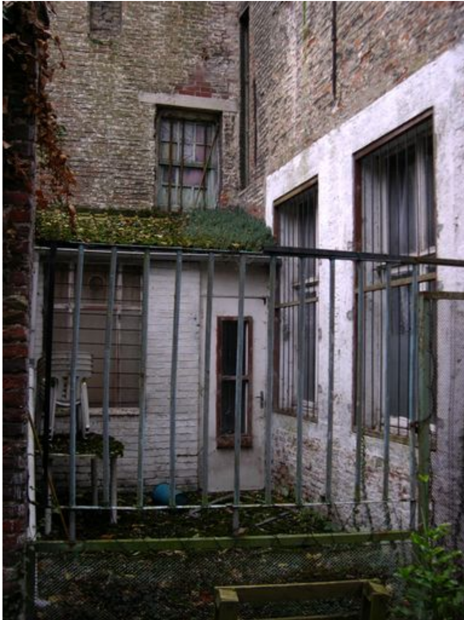
Façade arrière, vue partielle : rez-de-chausée, courette.