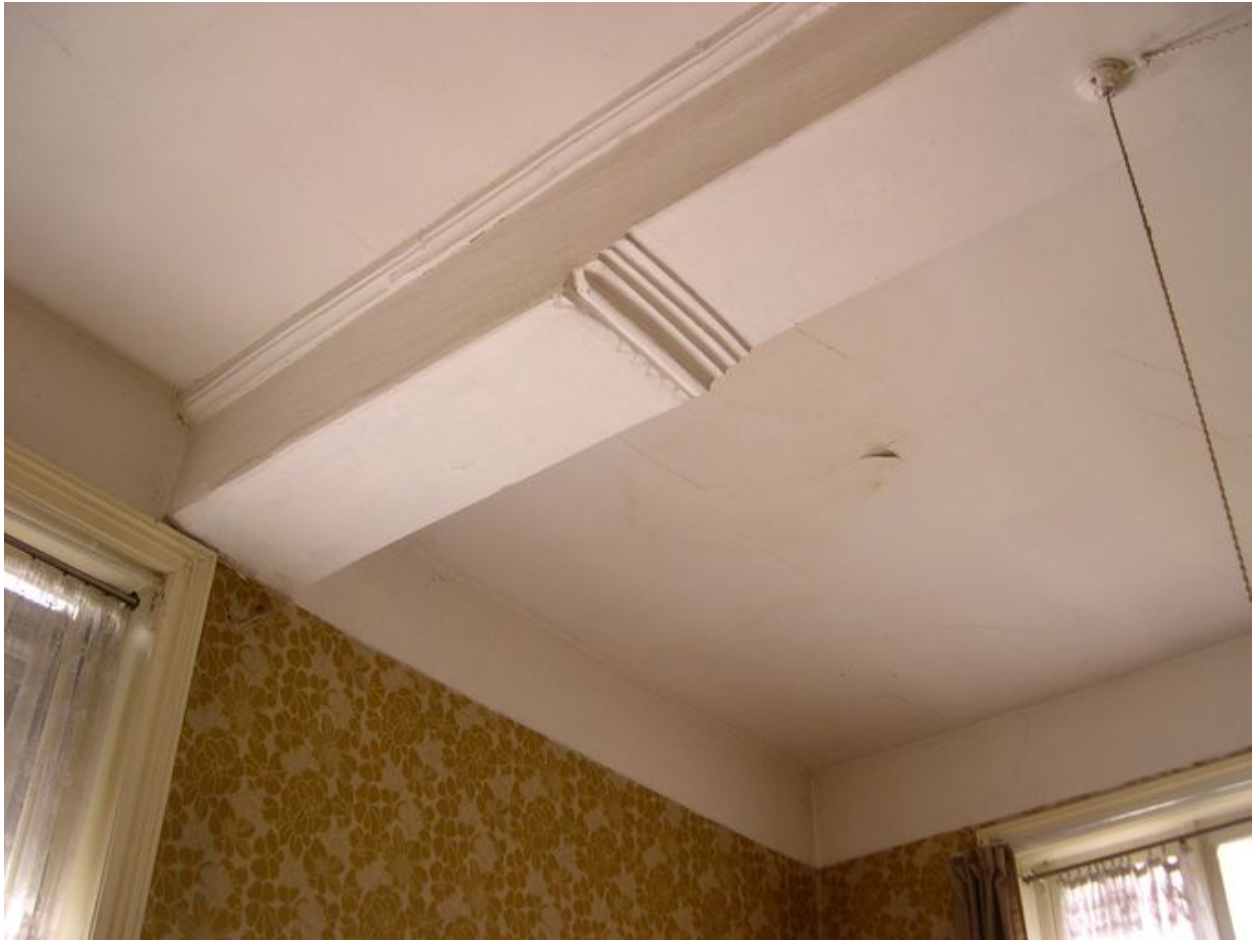
Intérieur, premier étage, pièce sud-ouest : plafond, vue partielle, about de poutre mouluré.