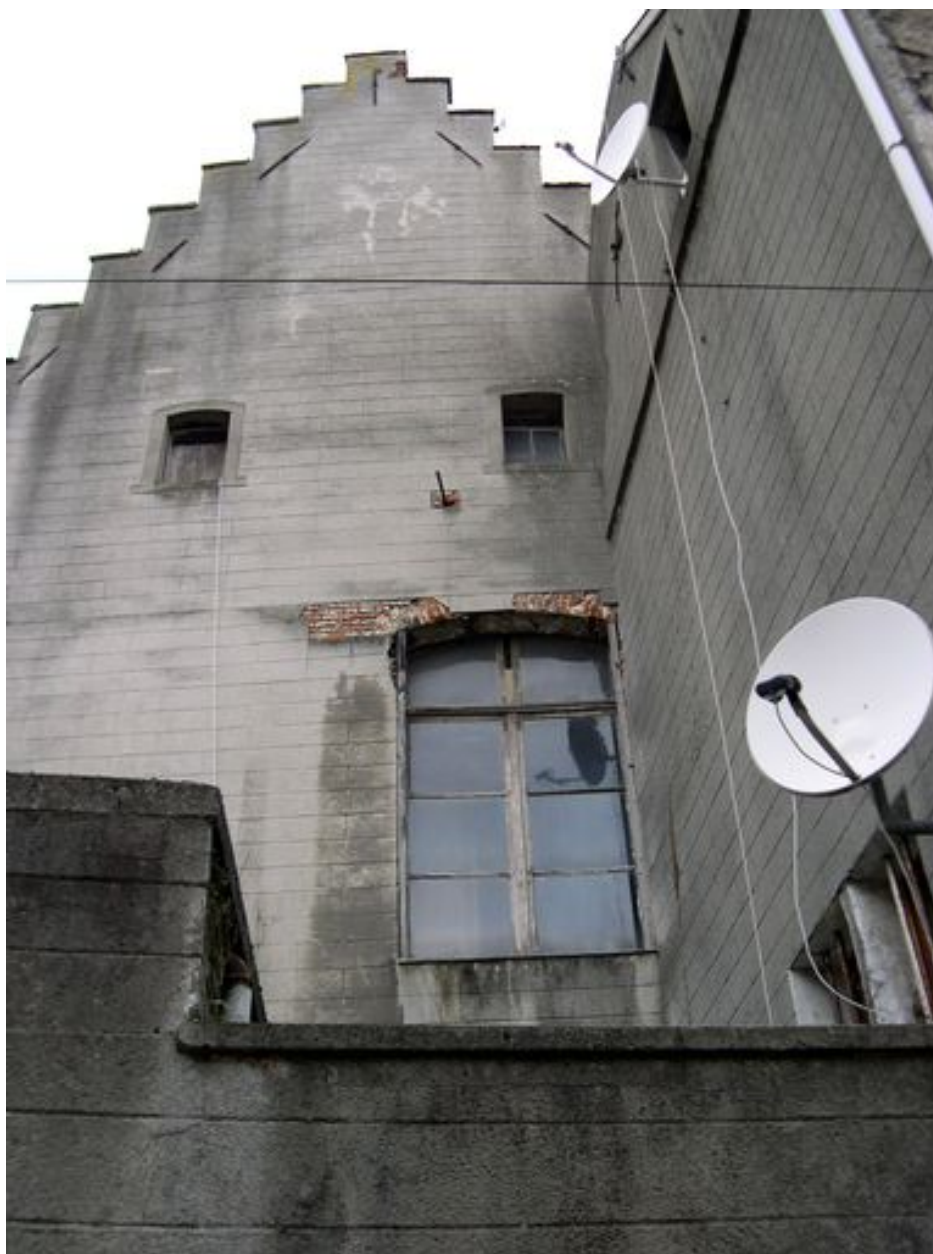
Façade latérale sud-est, vue partielle : pignon à redents, baie de la salle des bateliers.