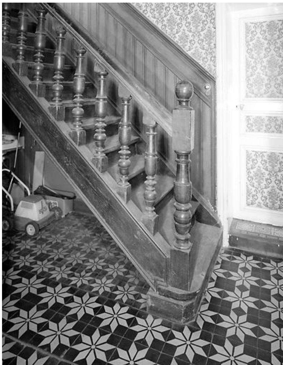
Intérieur, rez-de-chaussée, couloir : escalier, départ de la volée.