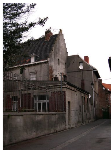
Vue de l'édifice depuis la rue Dervaux. Au premier plan, corps de bâtiment en rez-de-chaussée adjoit dans les années 1930.