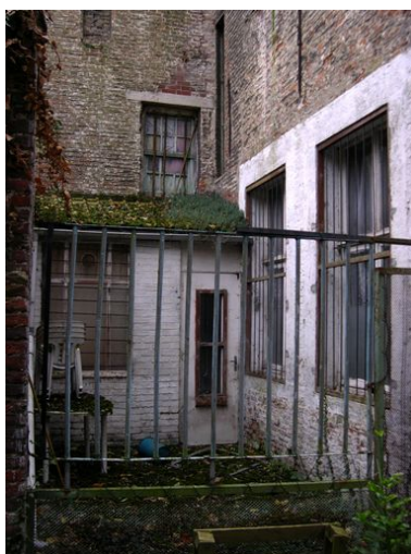
Façade arrière, vue partielle : rez-de-chaussée, courrette. IVR31_20065906107NUCA