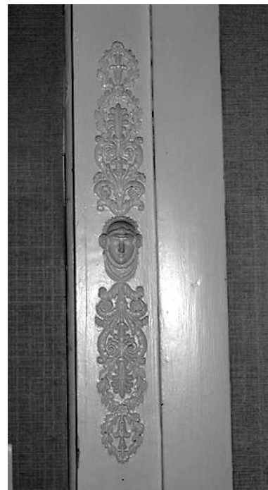
Intérieur, rez-de-chaussée, pièce sud-ouest, trumeau de cheminée, détail : juxtant le pilastre de gauche, un visage de femme. IVR31_20035900972X