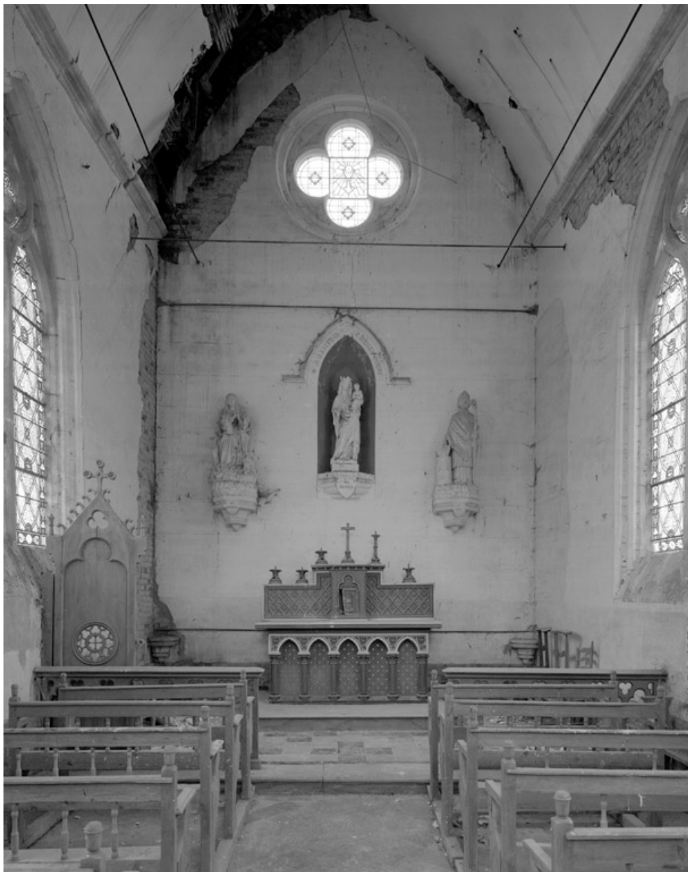
Vue intérieure, vers le chœur.