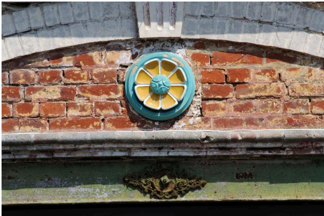
Détail du motif floral en céramique vernissée surmontant l'entrée charretière.