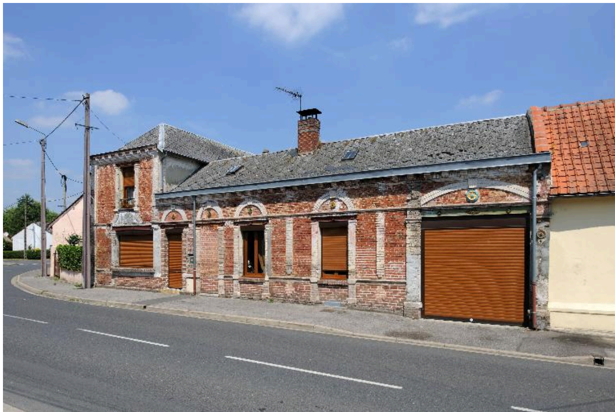
Vue d'ensemble sur rue.