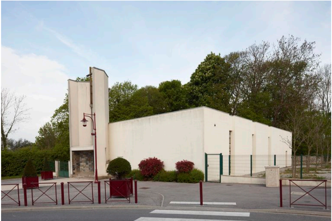
Vue générale de l'église.