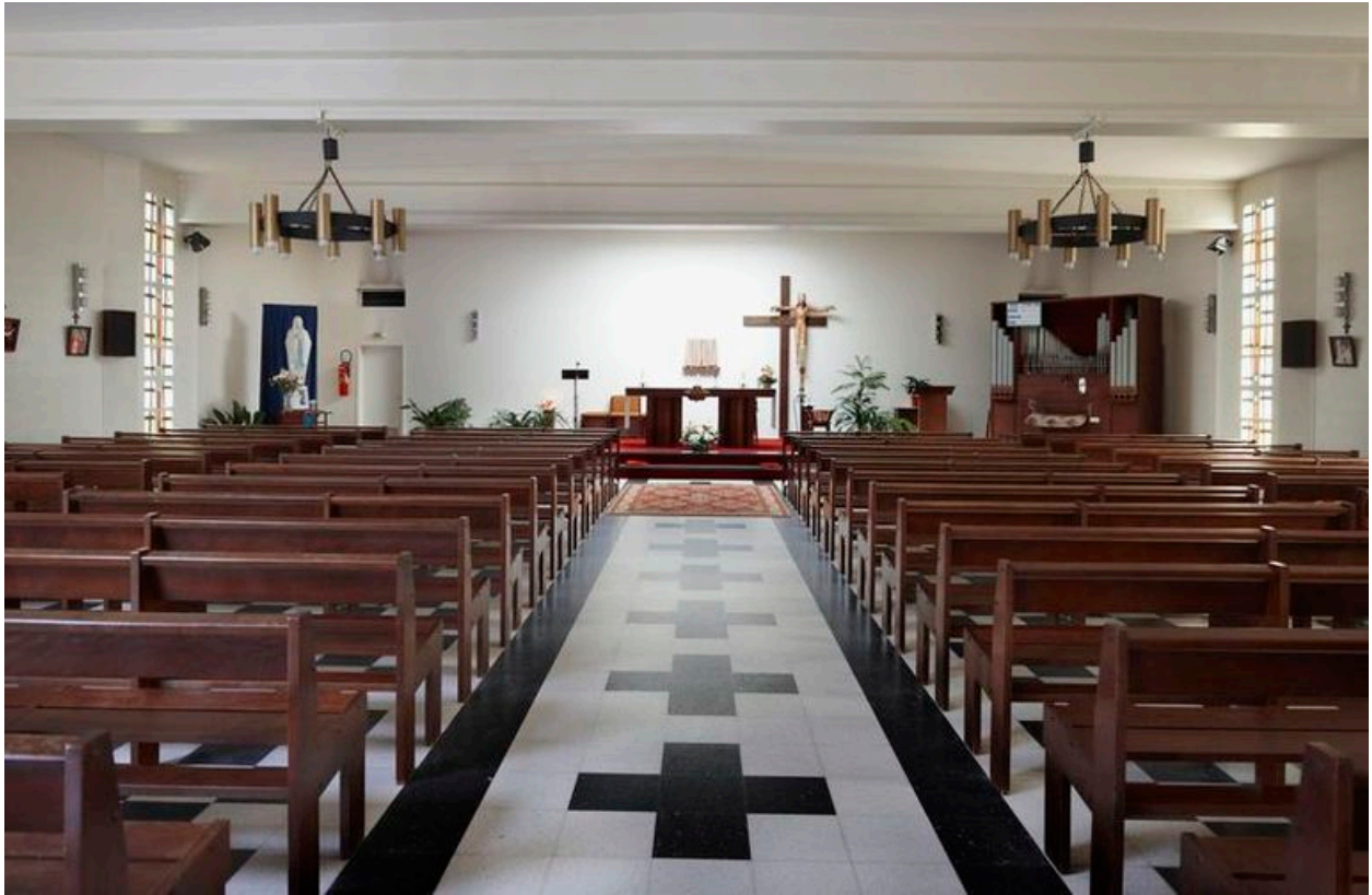
Vue intérieure, vers l'autel.