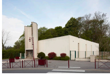
Vue générale de l'église. IVR31_20106200731NUCA