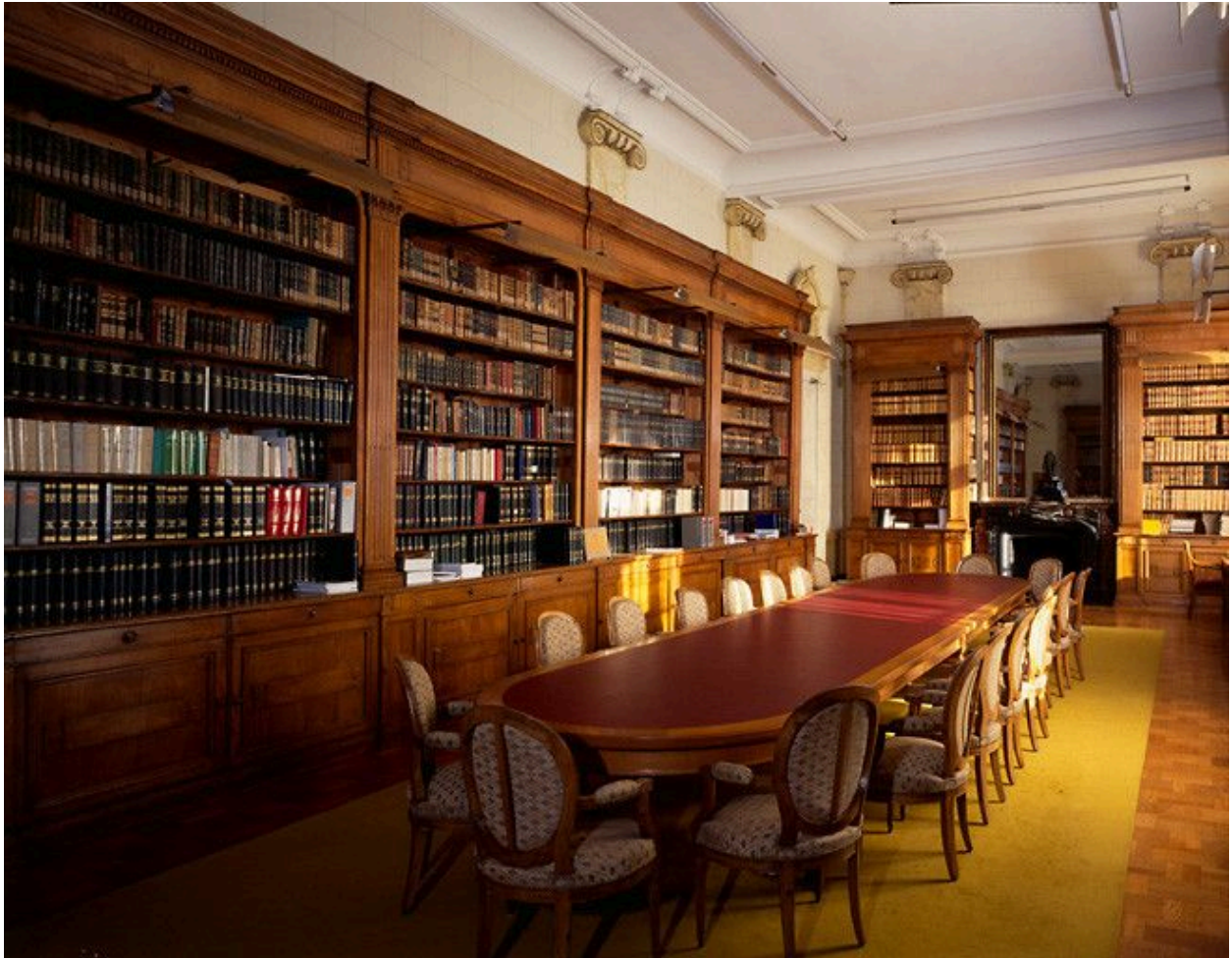
Vue générale de la bibliothèque.