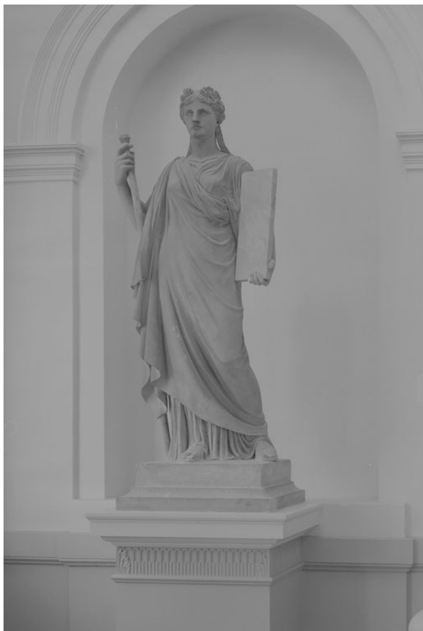
Statue représentant la Loi, par Sanson, 1873.