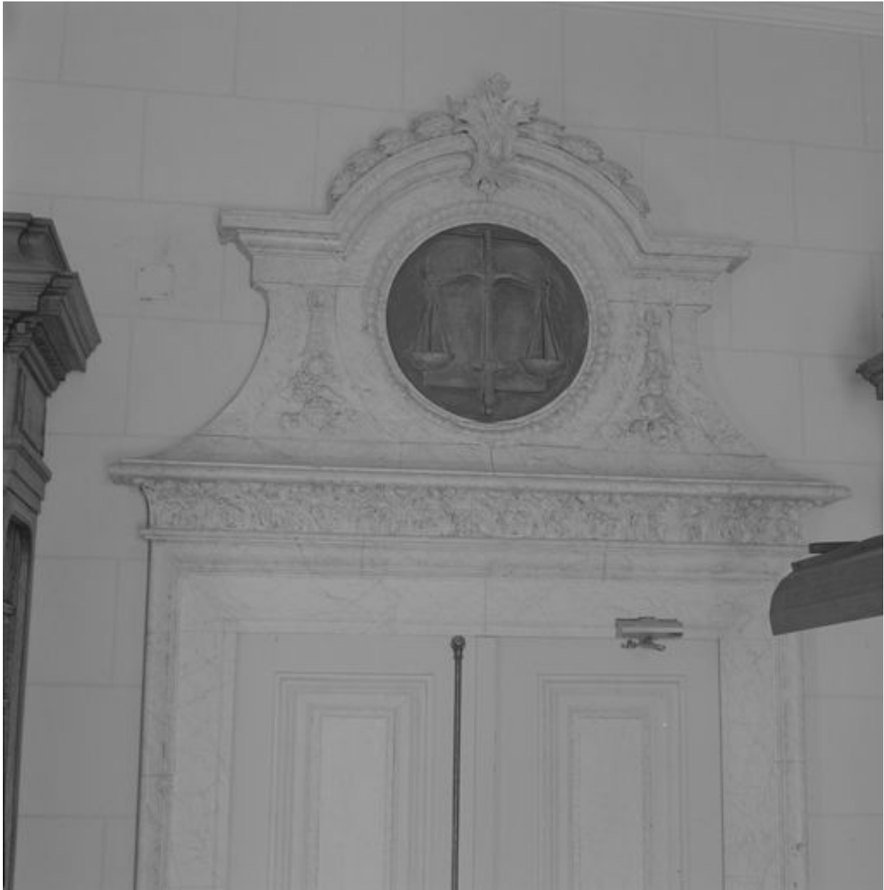
Vue de détail d'un dessus de porte (bibliothèque).