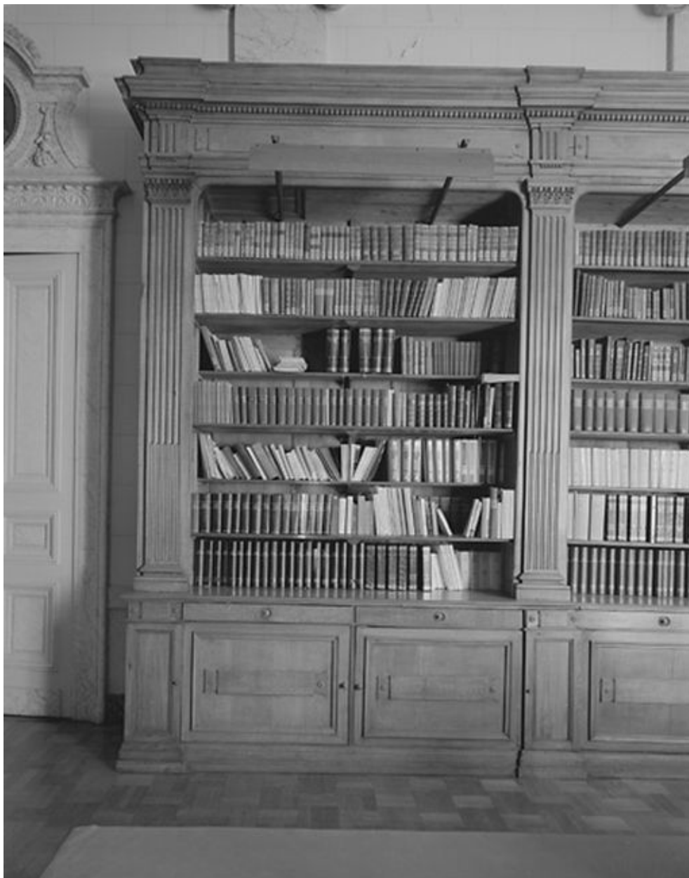
Bibliothèque, détail des rayonnages.