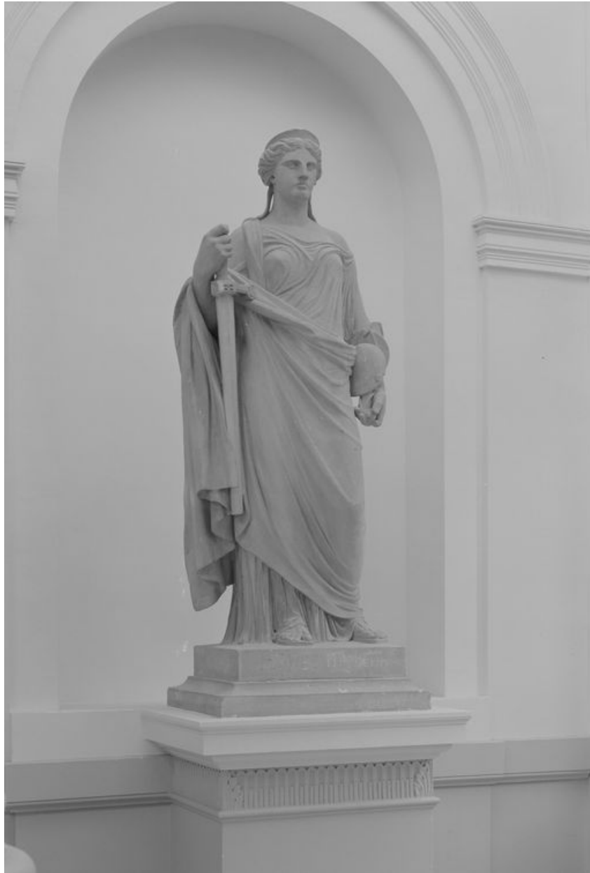
Statue représentant la Justice, par Sanson, 1873.