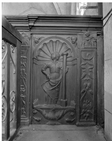
La Force, sculpture du dernier panneau du côté droit, chêne, XVIe siècle.