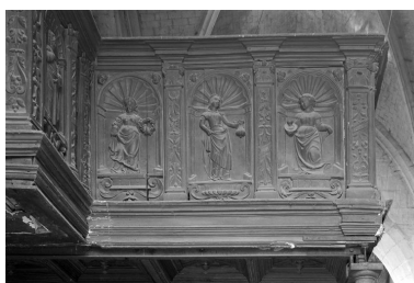
Angle du panneau de droite, chêne, XVIe siècle. IVR22_19940200943X