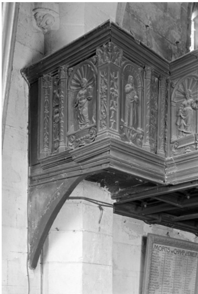
Angle gauche du garde-corps, chêne, XVIe siècle.