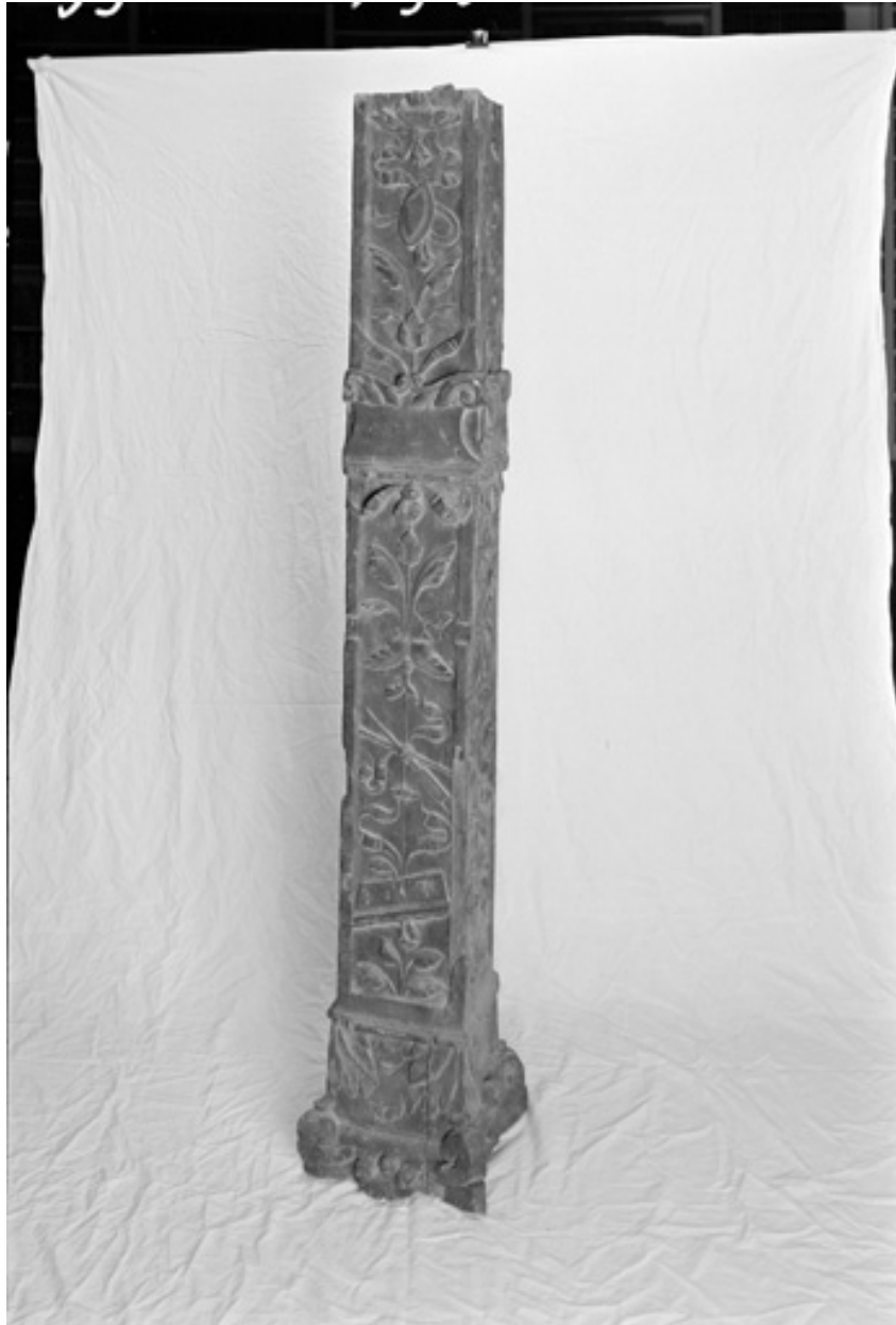
Un des piliers déposés à la bibliothèque municipale.