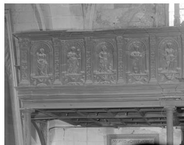
Panneau de gauche de la partie centrale, chêne, XVIe siècle. IVR22_19940200977V