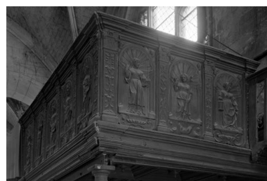
Angle du panneau de droite, chêne, XVIe siècle. IVR22_19940200944X