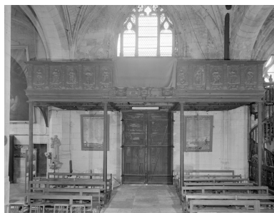
Vue d'ensemble, chêne, XVIe siècle. IVR22_19940200975V