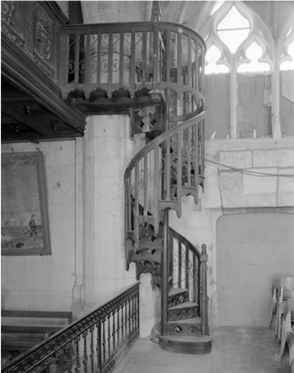
Escalier livré par la maison Haussaire, métal et bois, XIXe siècle. Vue d'ensemble.