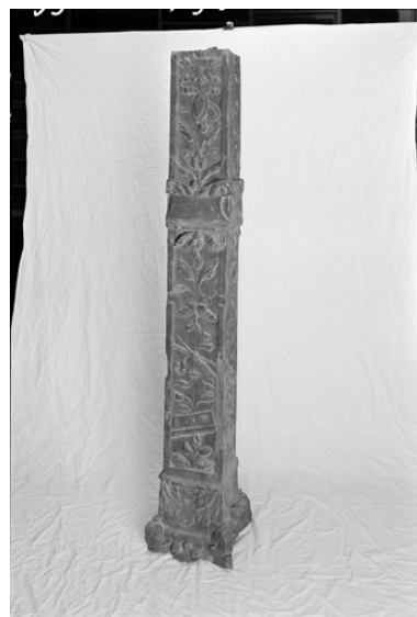
Un des piliers déposés à la bibliothèque municipale. IVR22_19930201930X