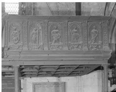
Panneau de droite de la partie centrale, chêne, XVIe siècle. IVR22_19940200978V