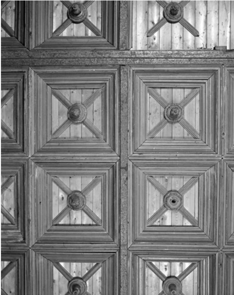
Plafond à caissons de la tribune d'orgue, refait au 19e siècle.