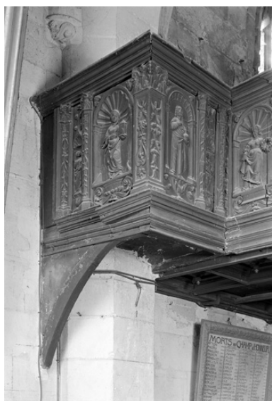
Angle gauche du garde-corps, chêne, XVIe siècle.