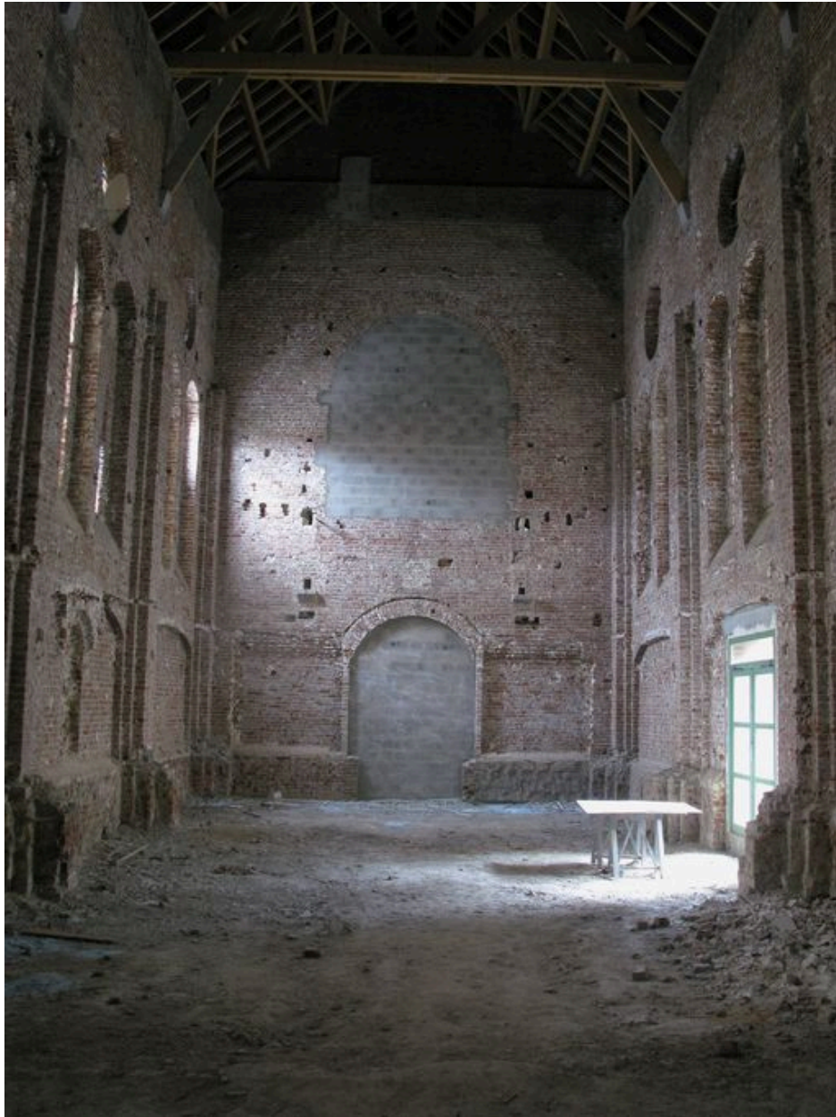
Nef depuis le choeur