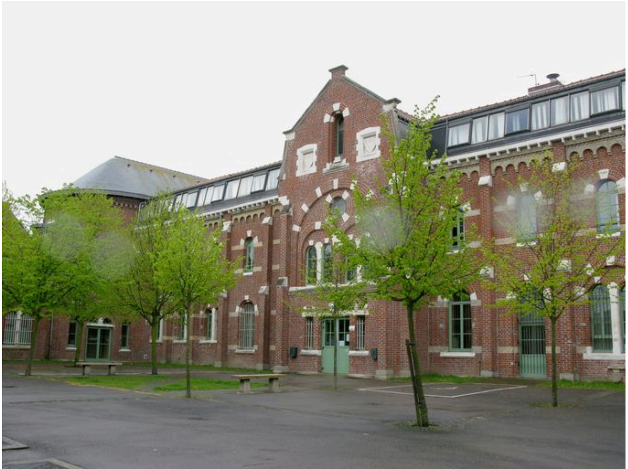
Vue du bâtiment du lycée accolé au mur nord de la chapelle dont le chœur est visible, à gauche