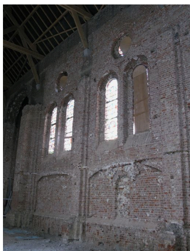
Mur sud de la nef IVR31_20126201579NUCA