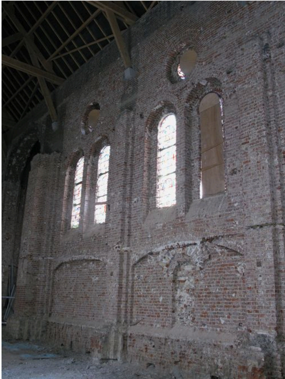
Mur sud de la nef