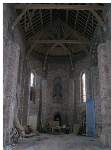
Chœur