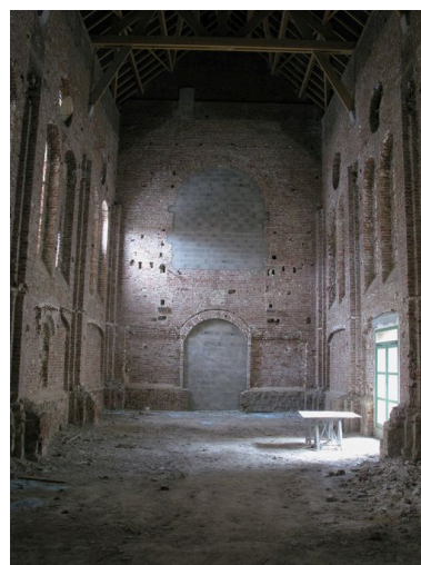
Nef depuis le chœur IVR31_20126201578NUCA