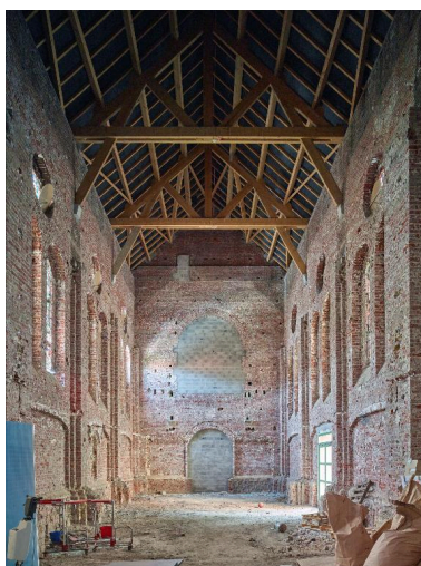
Vue générale de la nef, depuis le chœur. IVR32_20166200289NUCA