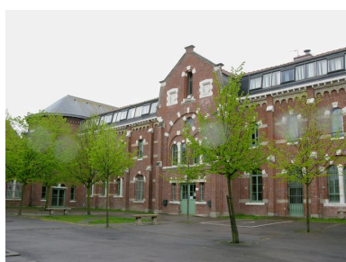
Vue du bâtiment du lycée accolé au mur nord de la chapelle dont le chœur est visible, à gauche IVR31_20126201574NUCA