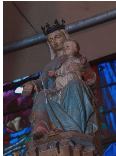
Vue latérale IVR31_20106202025NUCA