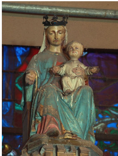
Vue générale IVR31_20106202026NUCA