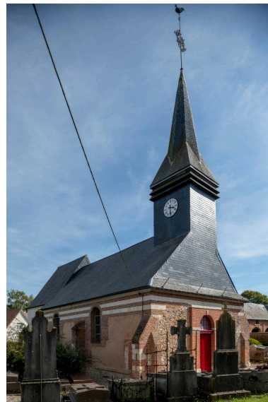
Vue depuis le nord-ouest. IVR32_20216000929NUCA