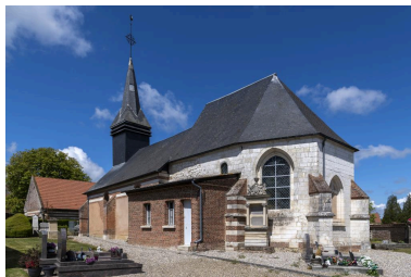
Vue depuis le sud-est: sacristie et chevet.

IVR32_20216000928NUCA