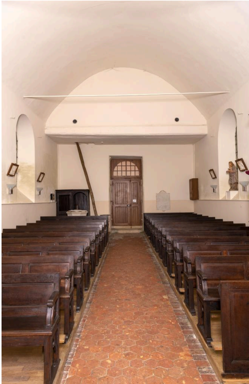
Vue vers la nef.