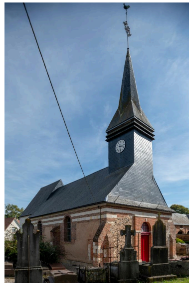
Vue depuis le nord-ouest.

Phot. Marc Kérignard IVR32_20216000405NUCA