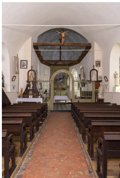
Vue vers le chœur. IVR32_20216000404NUCA