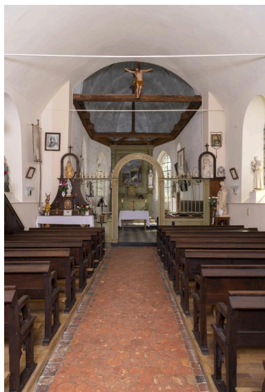
Vue vers le chœur.

Phot. Marc Kérignard IVR32_20216000929NUCA