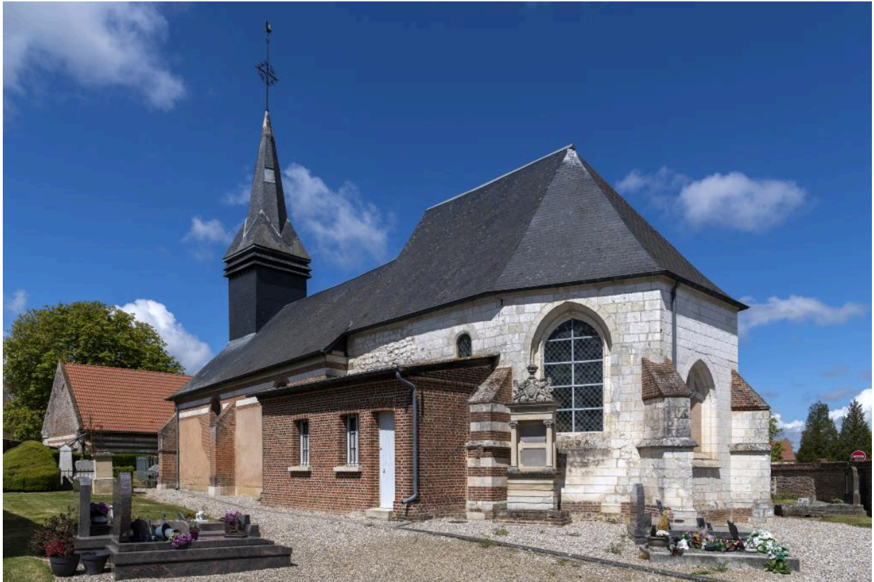
Vue depuis le sud-est: sacristie et chevet.