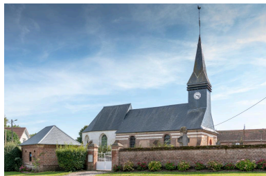
Vue d'ensemble de l'église, avec le bâtiment des pompes et l'entrée du cimetière (depuis le nord-ouest).

Phot. Marc Kérignard IVR32_20216000928NUCA