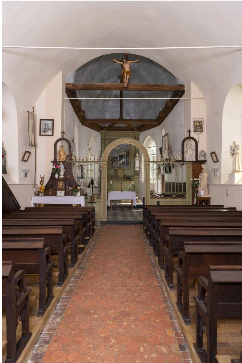
Vue vers le chœur.