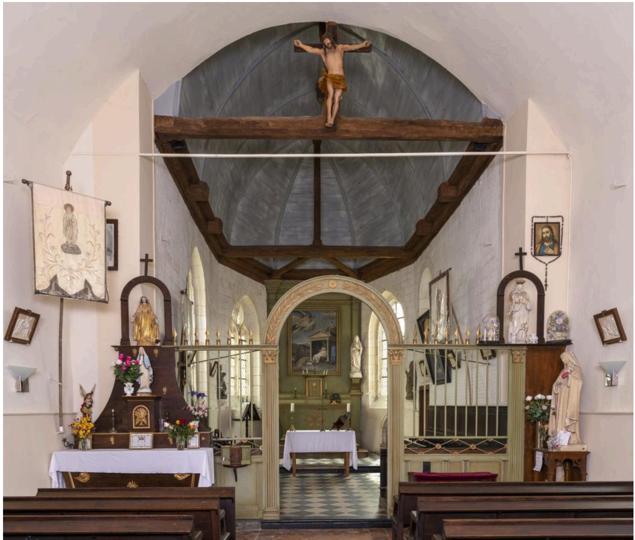
Vue du chœur.