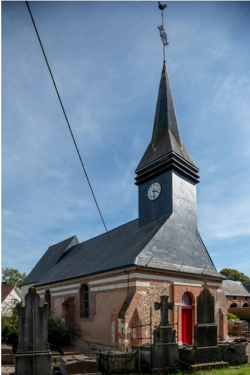
Vue depuis le nord-ouest.