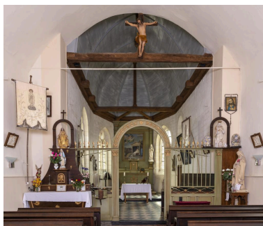
Vue du chœur.

IVR32_20216000404NUCA