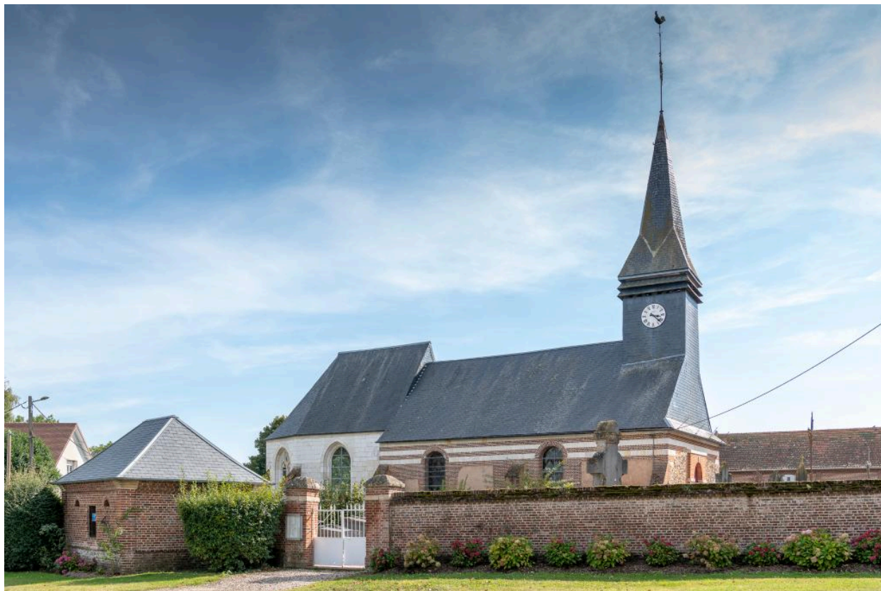
Vue d'ensemble de l'église, avec le bâtiment des pompes et l'entrée du cimetière (depuis le nord-ouest).