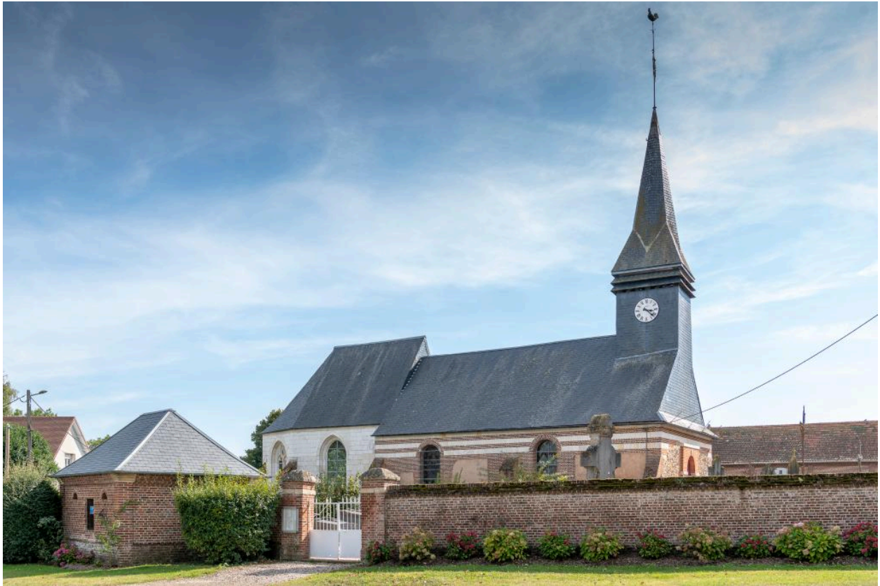
Vue d'ensemble de l'église, avec le bâtiment des pompes et l'entrée du cimetière (depuis le nord-ouest).