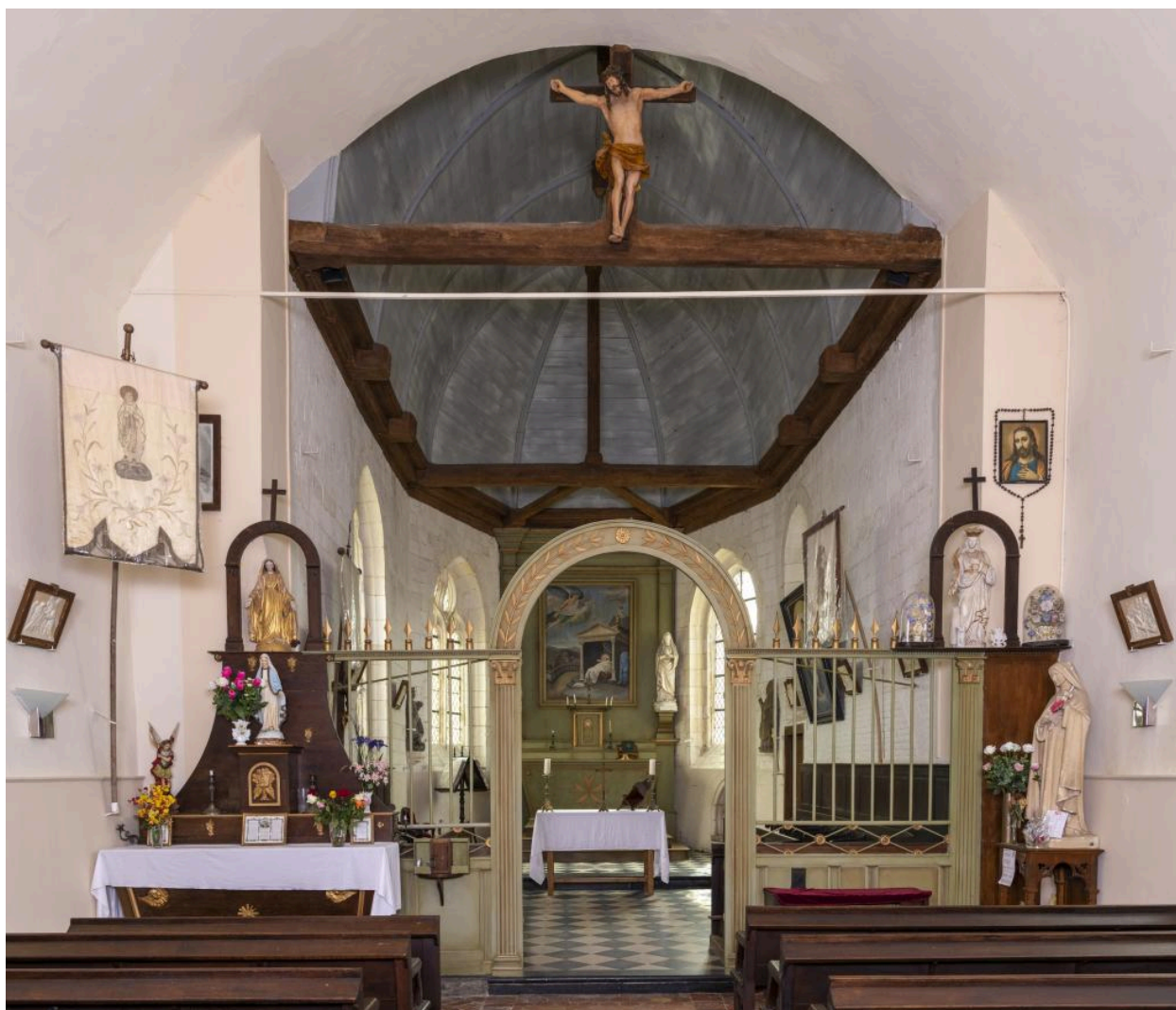
Vue du chœur.