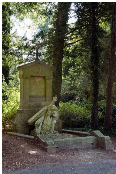
Vue générale.