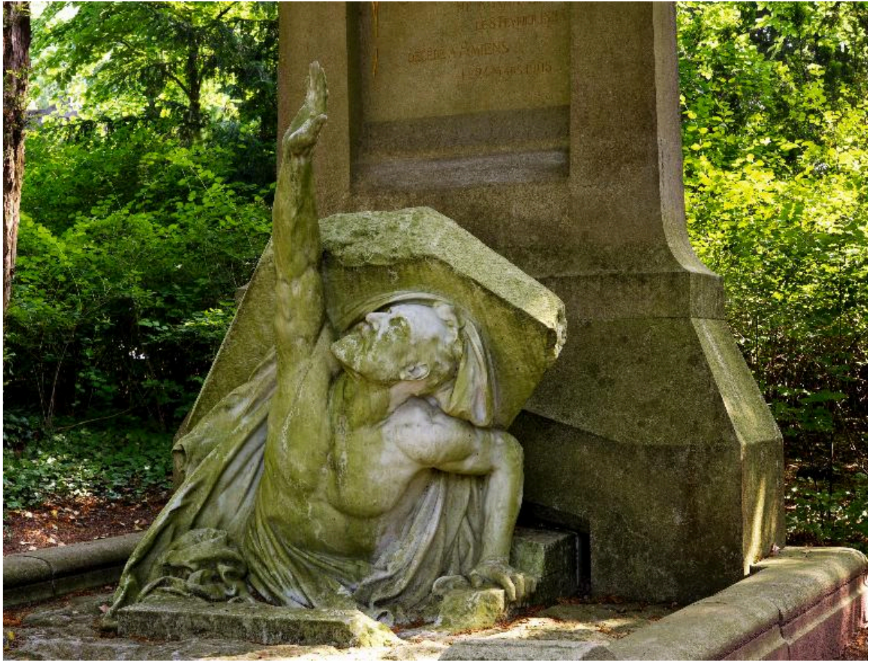
Vue de la statue à mi-corps.