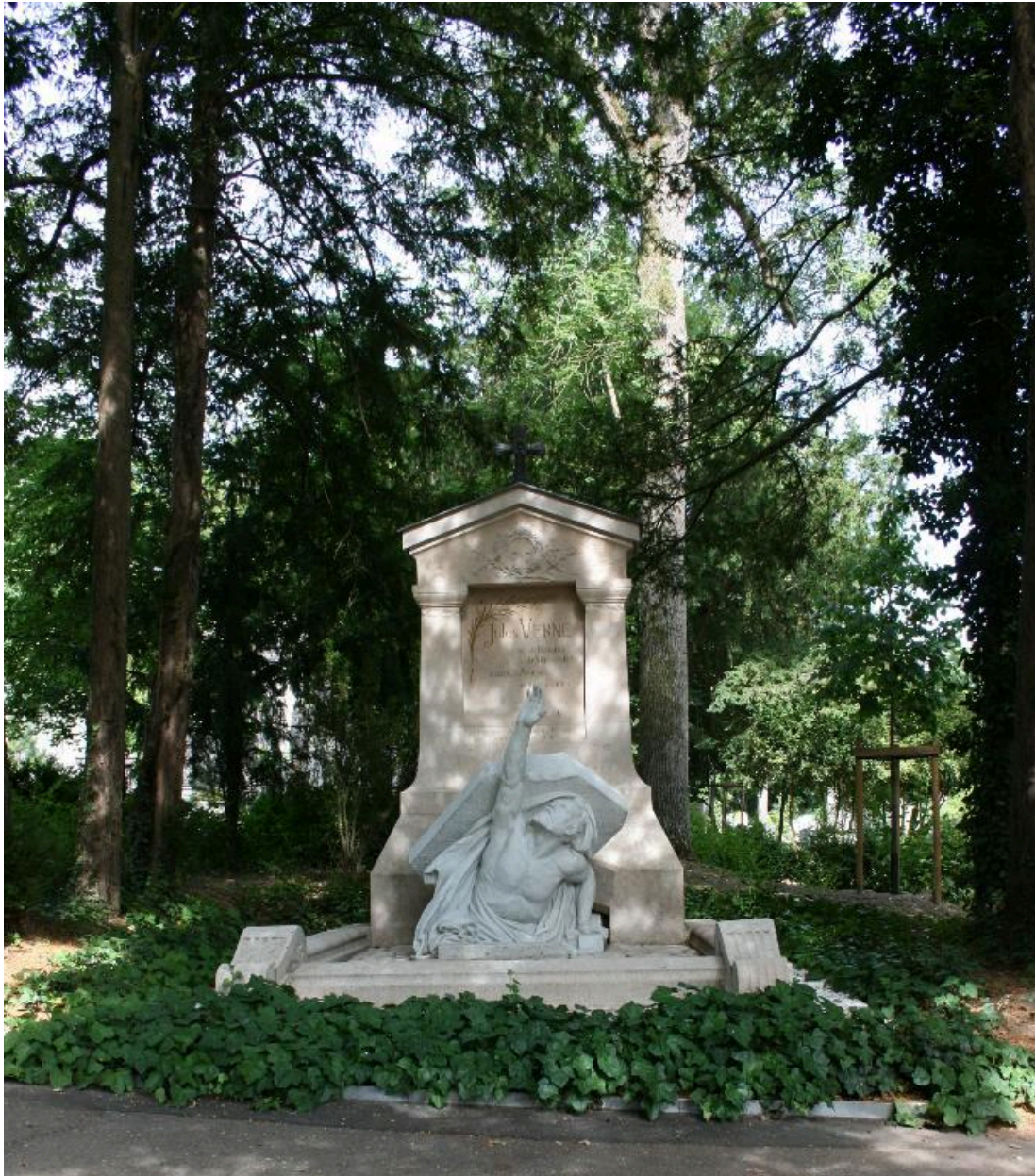
Vue générale, de face.