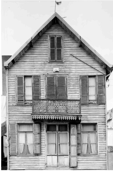
Vue générale de la façade en 1981. IVR31_19816203671X