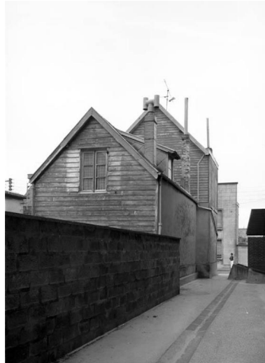
Façades postérieure et latérale gauche. IVR31_19816203628X