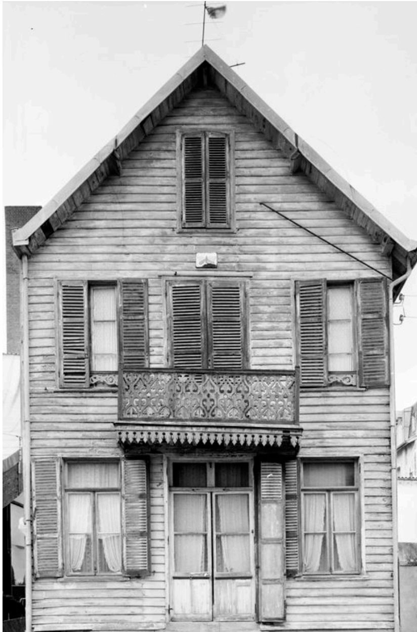
Vue générale de la facade en 1981.