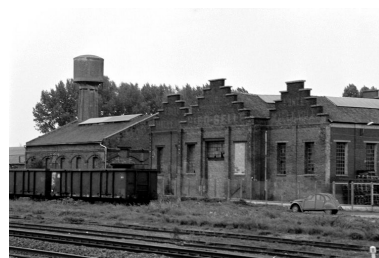
Élévation antérieure de l'atelier de fabrication.