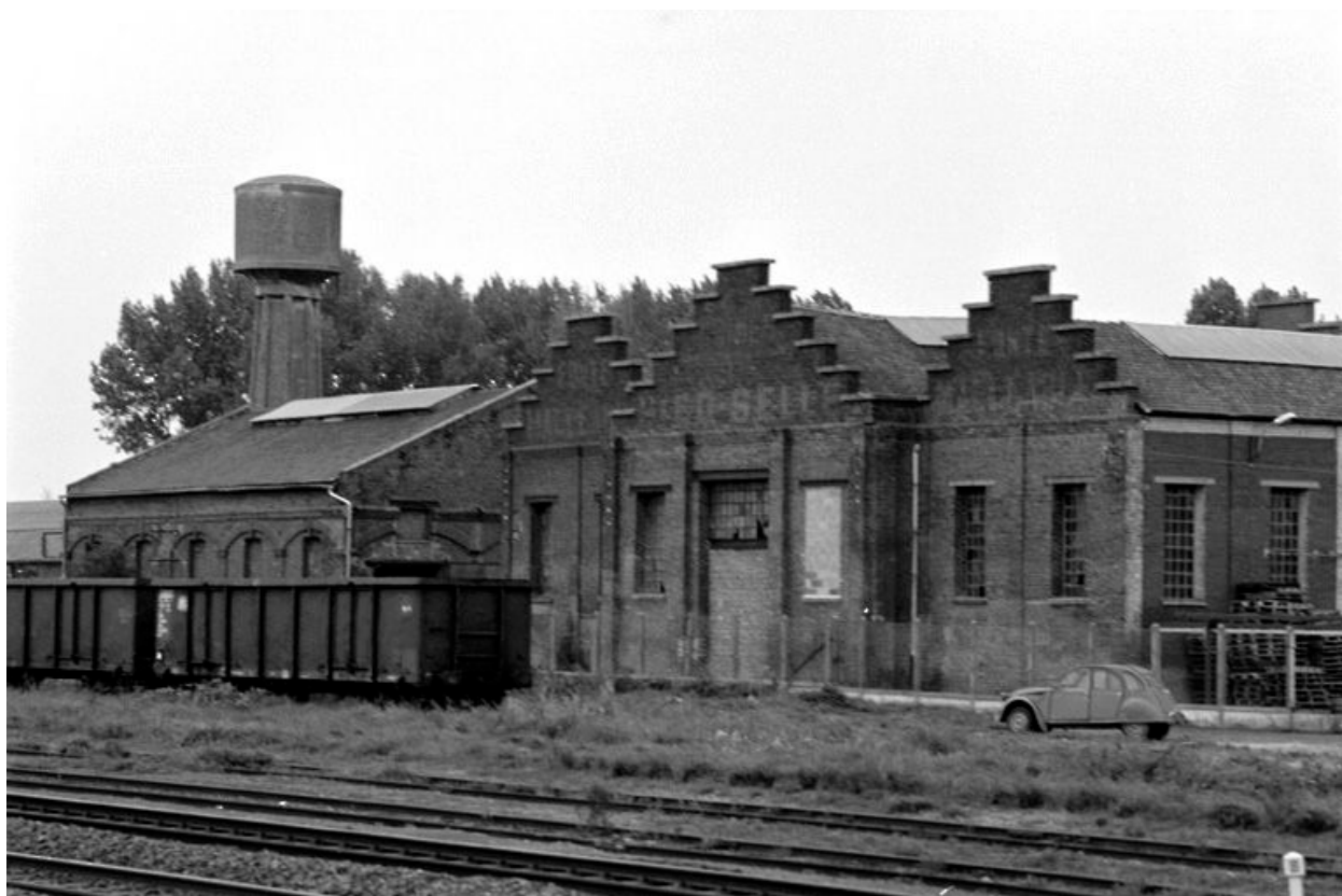
Elévation antérieure de l'atelier de fabrication.