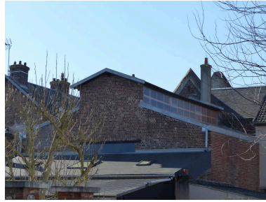
Vue de situation de l'ancienne salle de prière. IVR32_20220205065NUCA