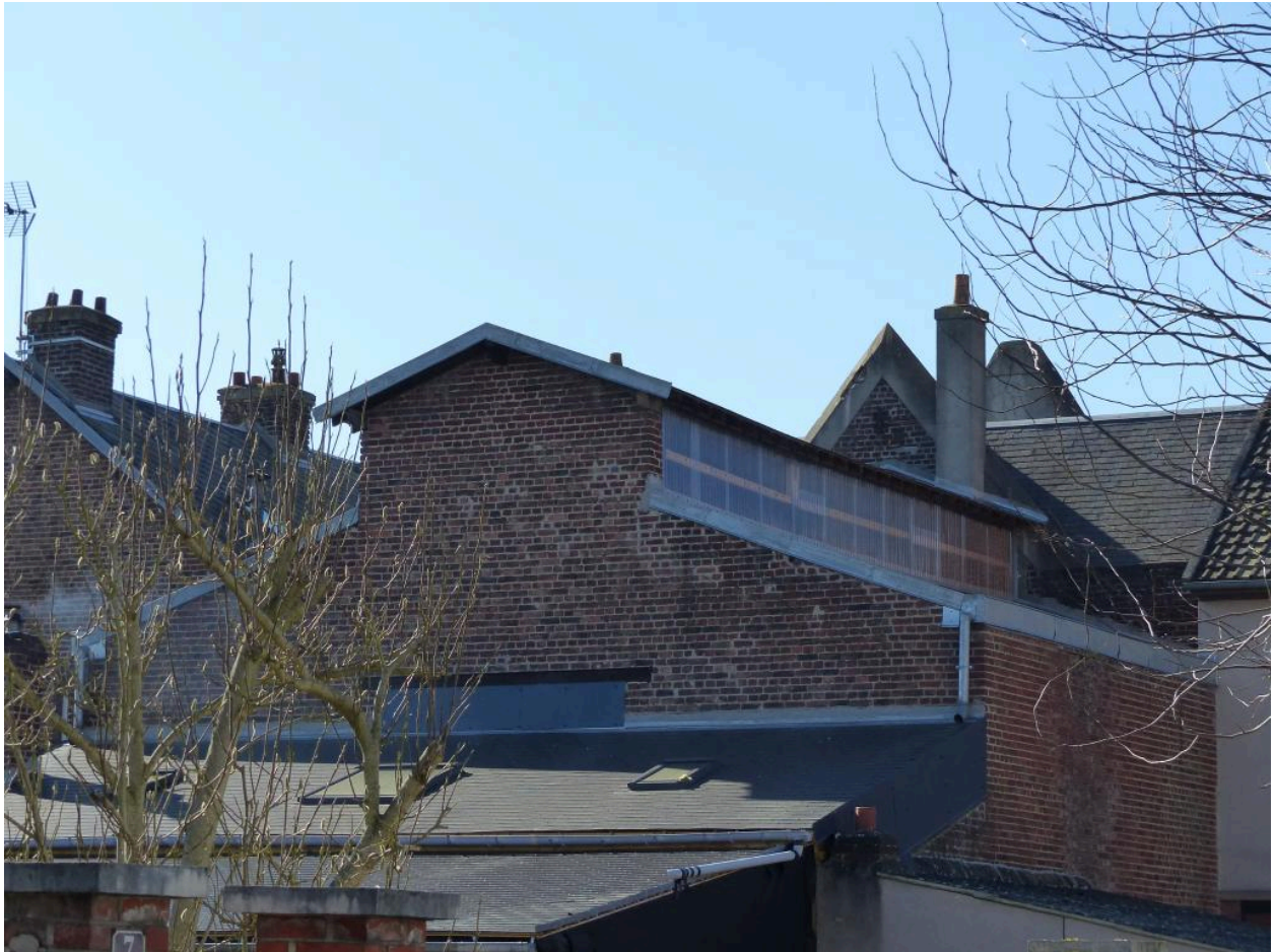
Vue de situation de l'ancienne salle de prière.