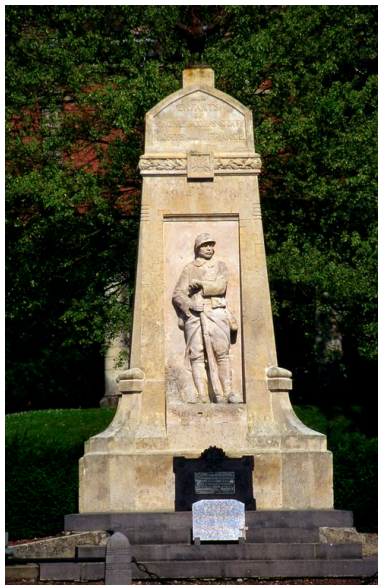
Vue générale. IVR22_19948000526ZA