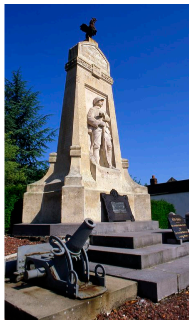
Vue de trois-quarts. IVR22_19948000528ZA