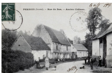
Vue de l'ancien logis, avant 1907 (coll. part.).

Phot. Archives départementales de la Somme (reproduction) IVR22_20088015160NUCA