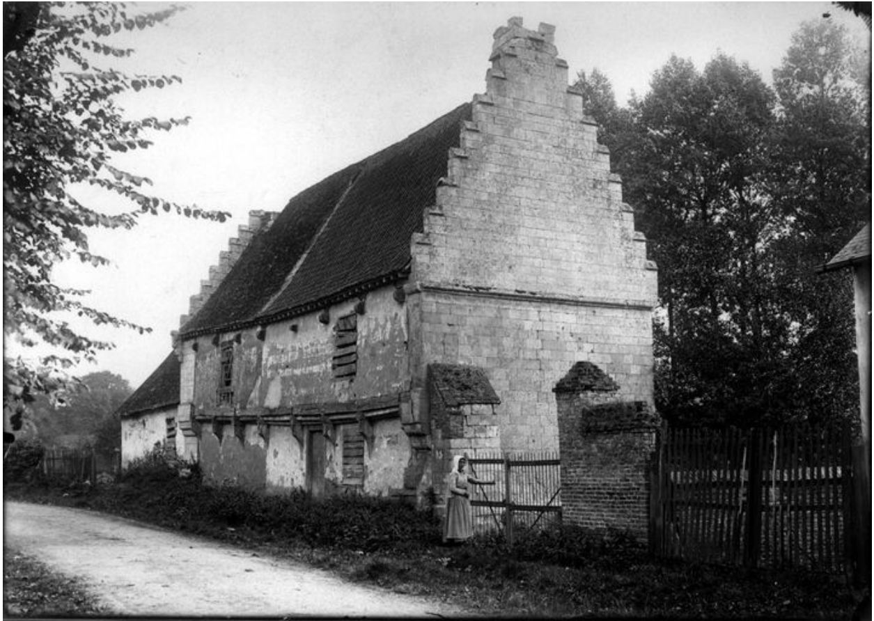
Vue de l'ancien logis, fin du 19e siècle (AD Somme ; 14 Fi 22/9).