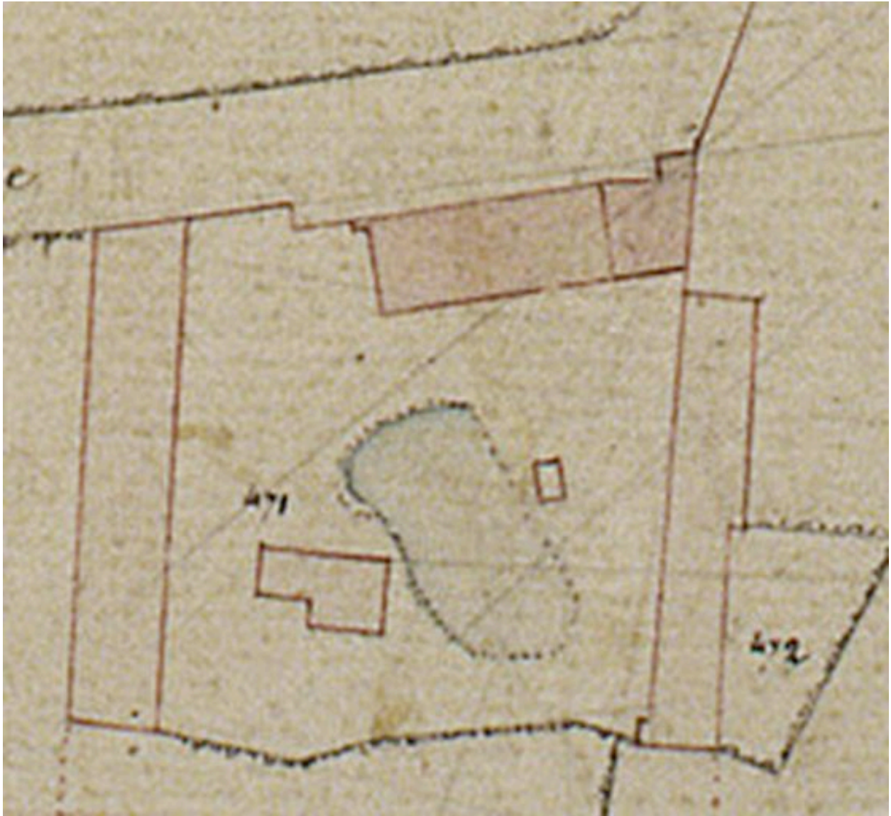
Détail du plan cadastral, section B, par Carette, 1832 (AD Somme ; 3P 1447/4).