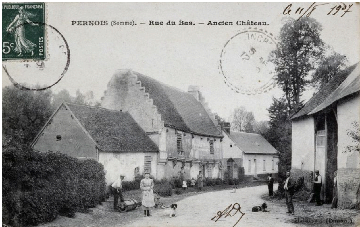
Vue de l'ancien logis, avant 1907 (coll. part.).