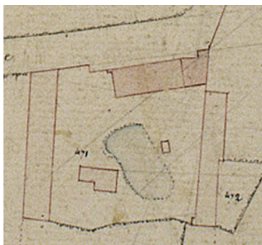
Détail du plan cadastral, section B, par Carette, 1832 (AD Somme ; 3P 1447/4).

Phot. Frédéric Fournis (reproduction) IVR22_20088015482NUCA