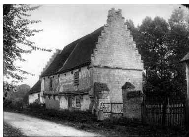
Vue de l'ancien logis, fin du 19e siècle (AD Somme ; 14 Fi 22/9).

Phot. Frédéric Fournis (reproduction) IVR22_20088015481NUCA