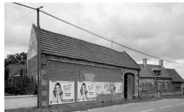
Grange. Elévation sur rue. IVR22_19856000997X