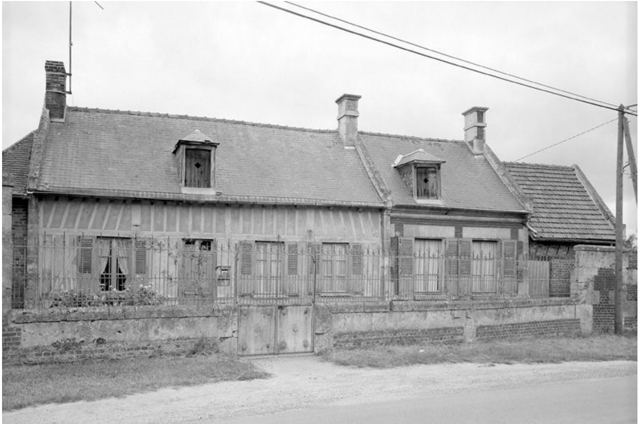
Logis. Élévation antérieure.