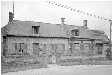
Logis. Elévation antérieure. IVR22_19856000998X