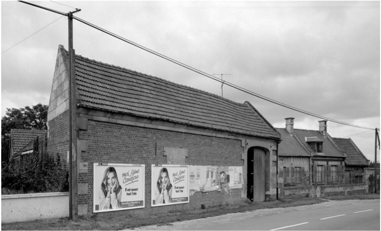
Grange. Elévation sur rue.