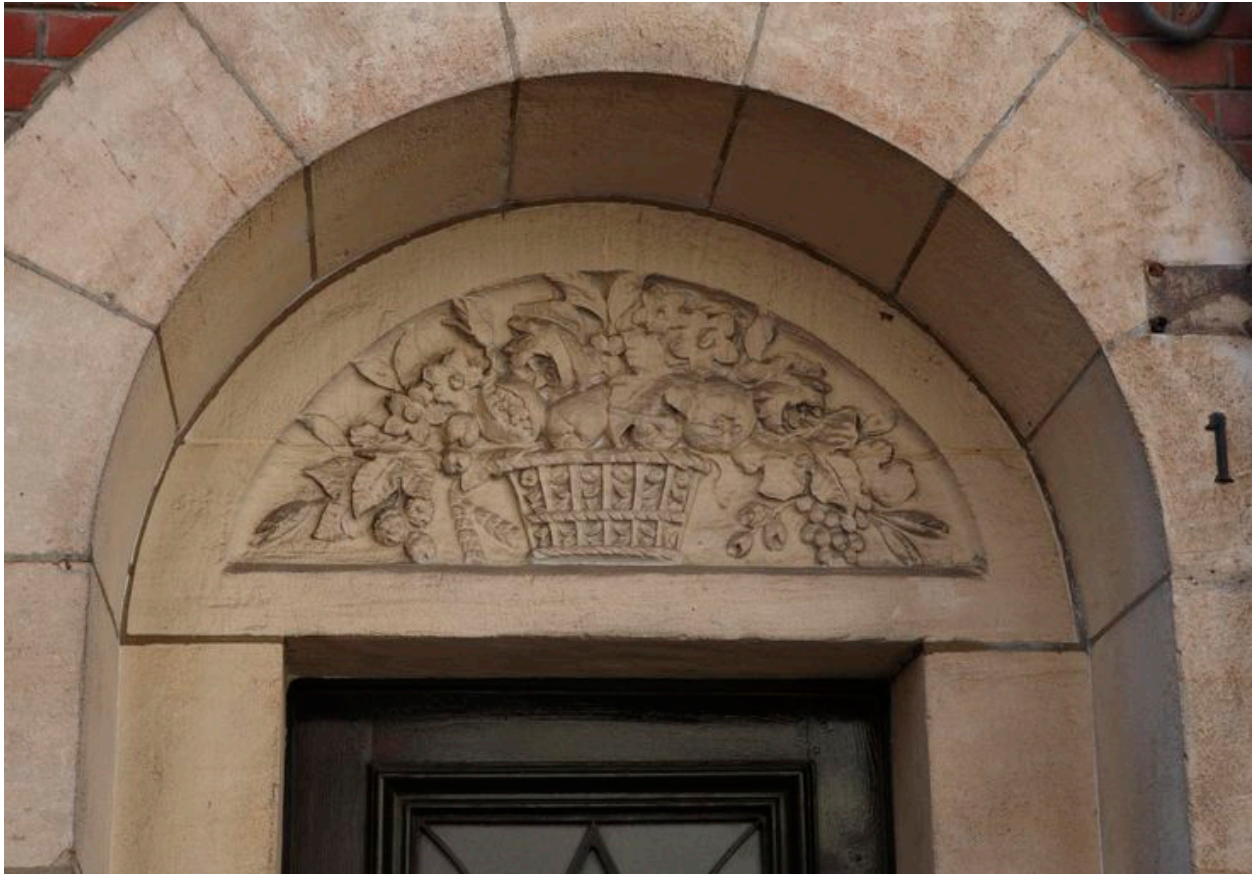
Couronnement Art déco de la porte d'entrée.