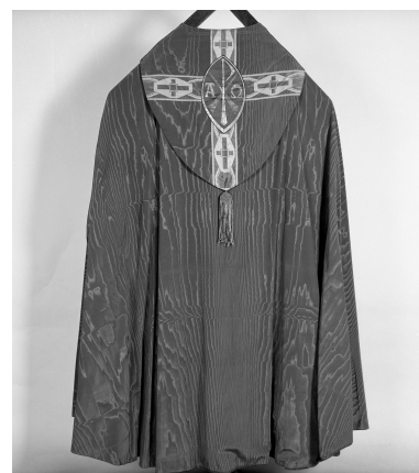
Chape n° 2, ornement violet. IVR31_19966201079X