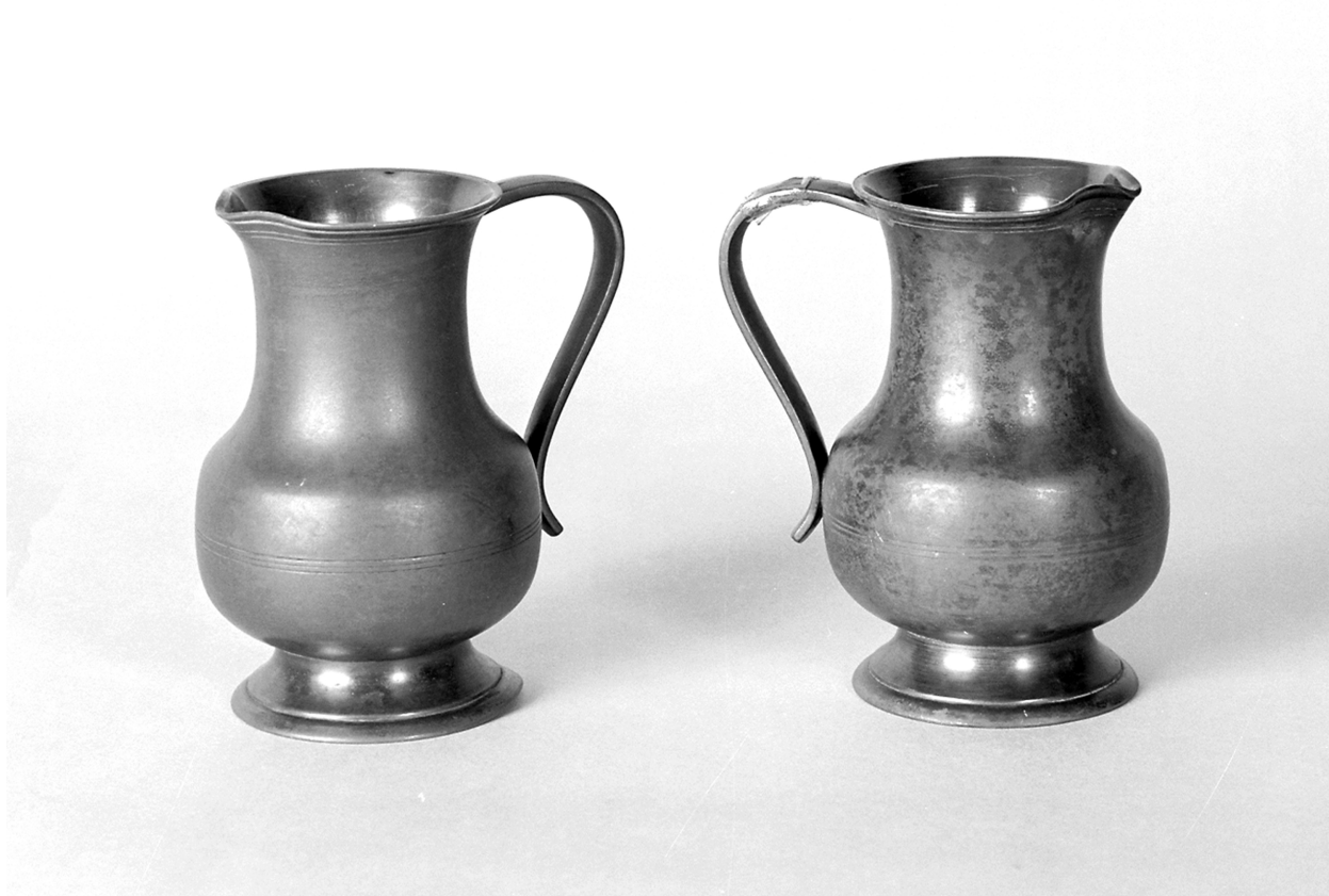
Burettes (2), étain, 14 H, 7,5 D. Inscription : Etain d'art, titre légal, made in France. Poinçon : fleur sous couronne.