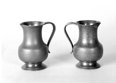
Burettes (2), étain, 14 H, 7,5 D. Inscription : Etain d'art, titre légal, made in France. Poinçon : fleur sous couronne. IVR22_19966201066X