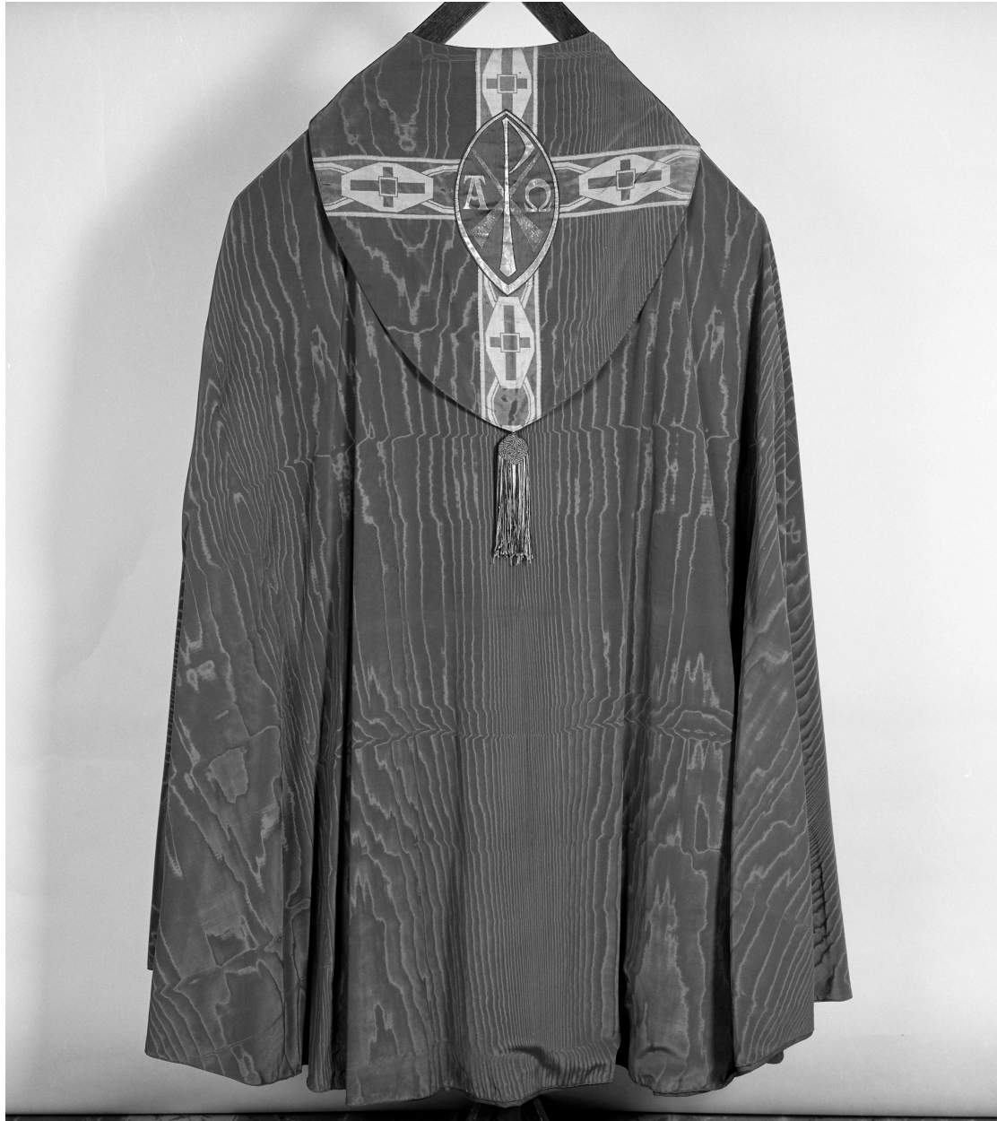
Chape n° 2, ornement violet.