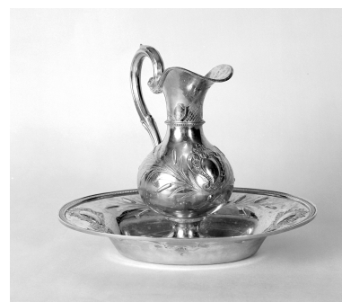
Aiguière à ablutions, bassin à ablutions, métal doré. Aiguière à ablutions : 27 D, 9 D ; bassin à ablutions : 34 L, 20,5 LA. IVR22_19966201068X