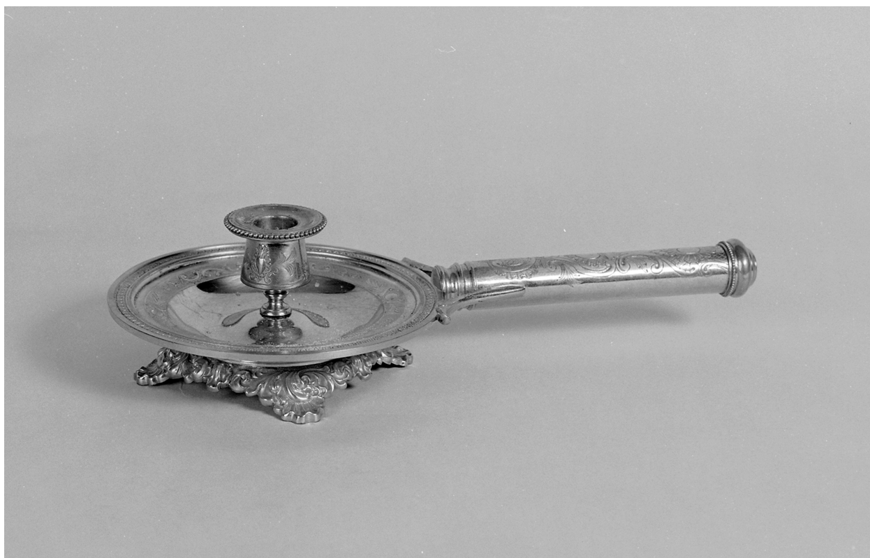
Bougeoir d'évêque, métal doré, 8,5 H, 34 L, 16,7 D.