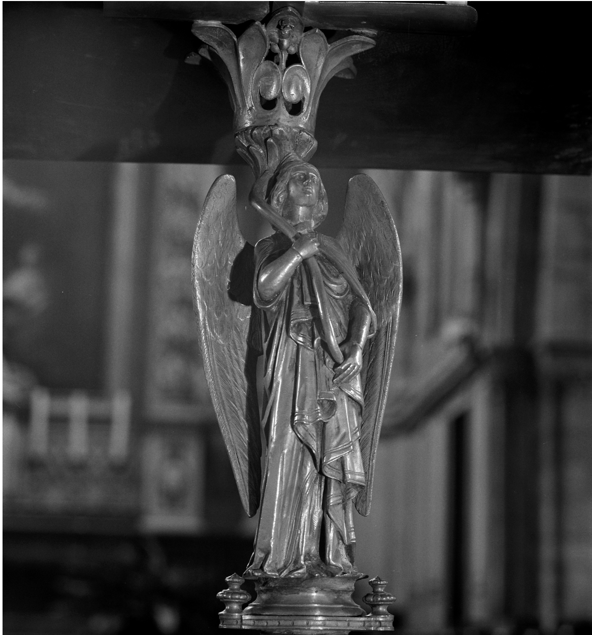
Lutrin n° 2, détail.