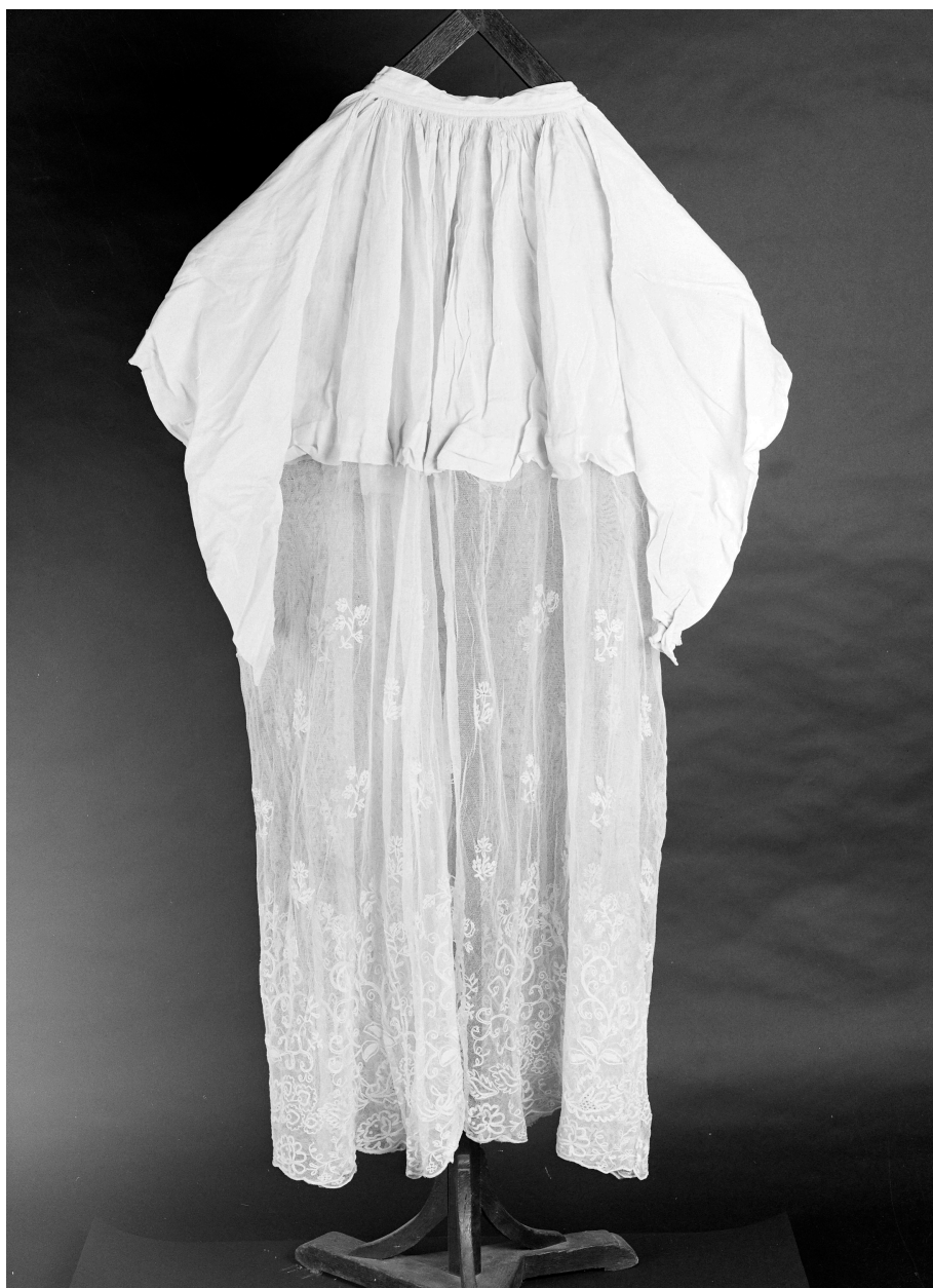
Aube n° 2, lin : toile, tissu uni ajouré, brodé. 137 H, 101 H : hauteur dentelle.