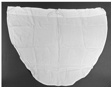
Garniture et linge liturgique (?). IVR22_19966200037X