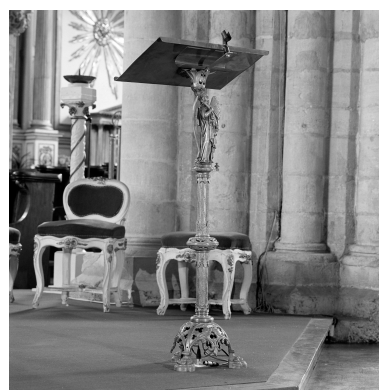
Lutrin n° 2, vue générale.