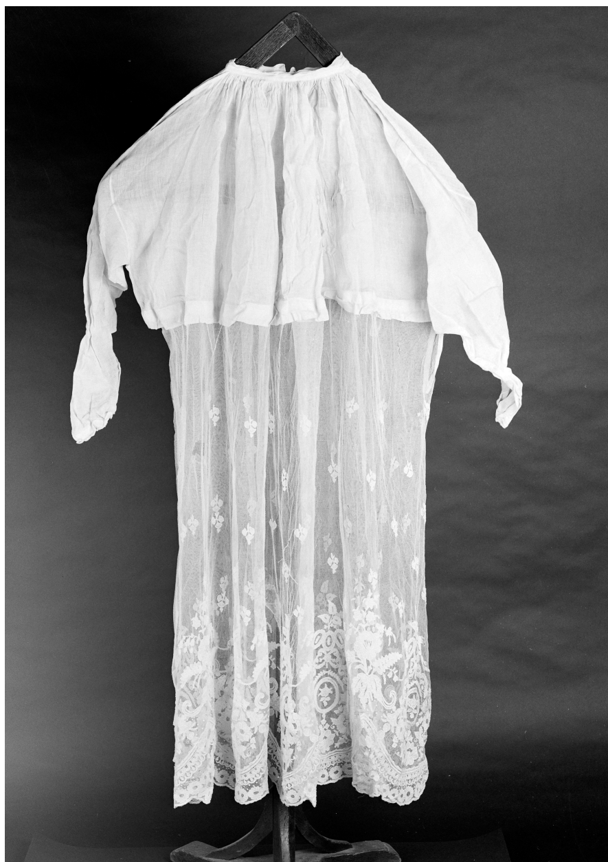
Aube n° 1, lin : toile, tissu uni ajouré, brodé. 142 H, 100 H : hauteur dentelle.