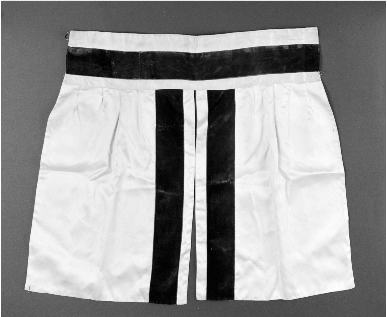
Garniture du tabernacle. Satin : beige, velours uni rouge foncé, 54 H, 50 LA.