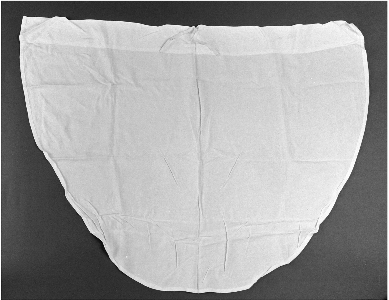
Garniture et linge liturgique (?).