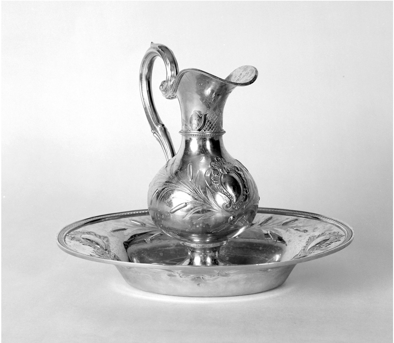
Aiguière à ablutions, bassin à ablutions, métal doré. Aiguière à ablutions : 27 D, 9 D ; bassin à ablutions : 34 L, 20,5 LA.