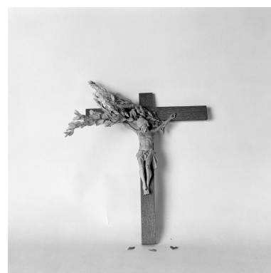
Rameau bénit, branche de buis posée sur la croix n° 2, dite crucifix.