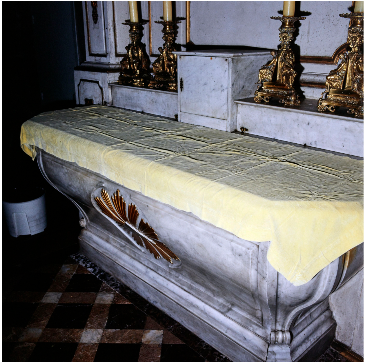
Tapis de la table d'autel.