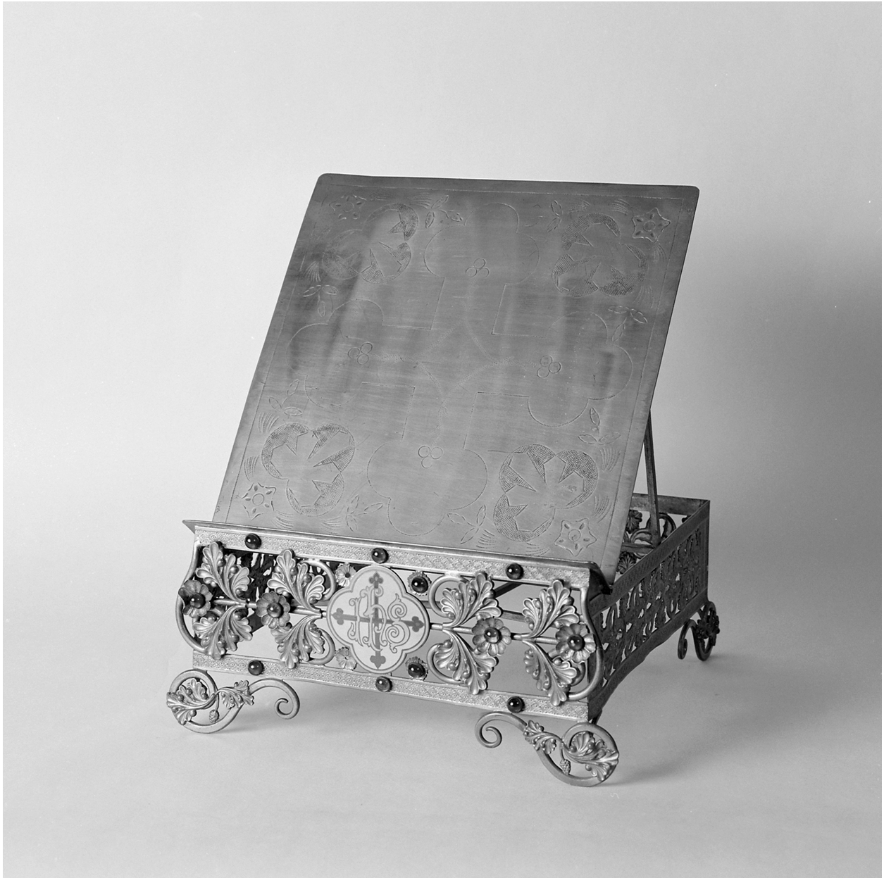
Thabor n° 1, en position de pupitre d'autel, cuivre doré, 16 H, 31 L, 36 P.