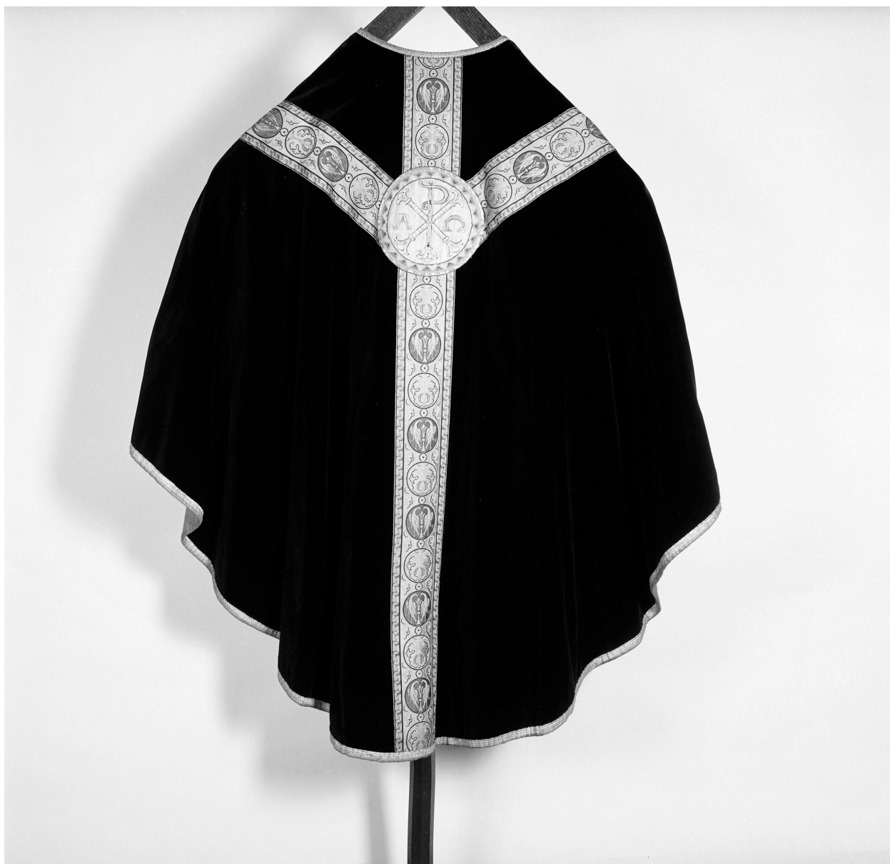
Chasuble n° 2, dite chasuble gothique, ornement noir.