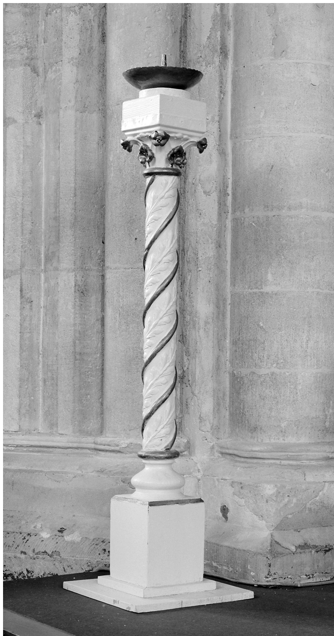
Chandelier pascal, bois peint.