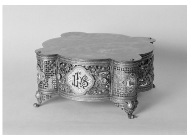
Thabor n° 2, cuivre doré, verrerie : pierres taillées rouges, vertes, 16,2 H, 34 L, 34 LA.