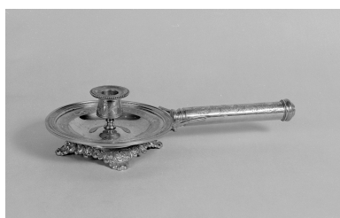
Bougeoir d'évêque, métal doré, 8,5 H, 34 L, 16,7 D. IVR31_19966201080X