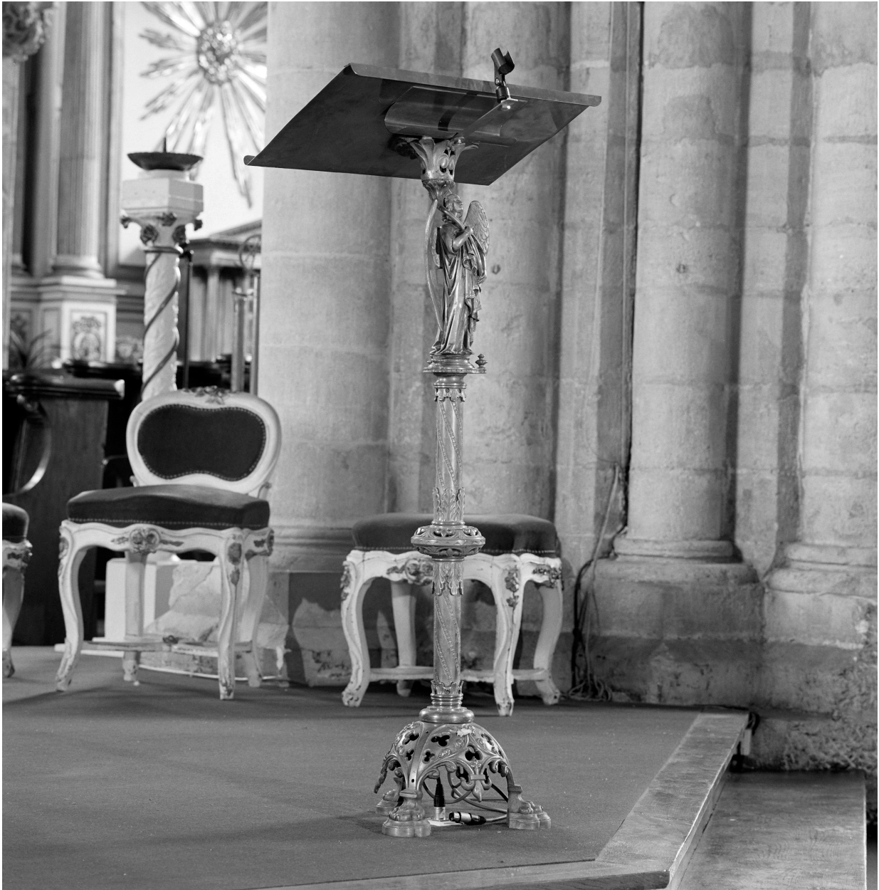
Lutrin n° 2, vue générale.