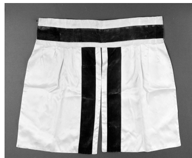
Garniture du tabernacle. Satin : beige, velours uni rouge foncé, 54 H, 50 LA.