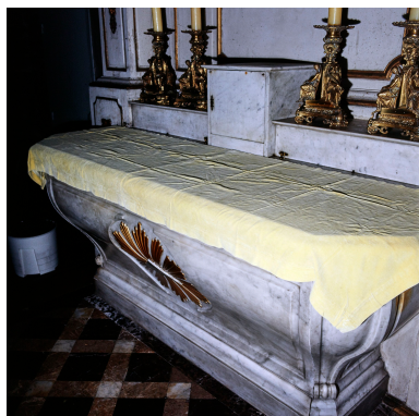
Tapis de la table d'autel.