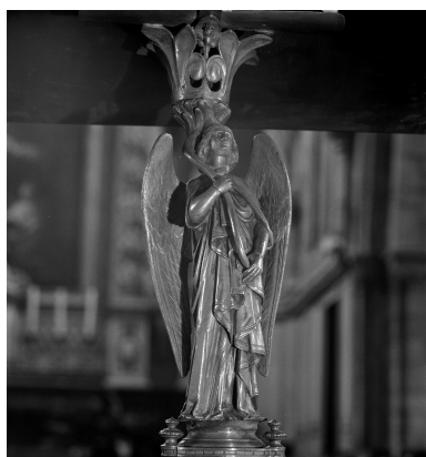
Lutrin n° 2, détail. IVR31_19966200517X