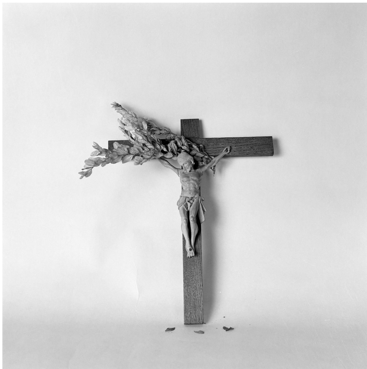
Rameau bénit, branche de buis posée sur la croix n° 2, dite crucifix.