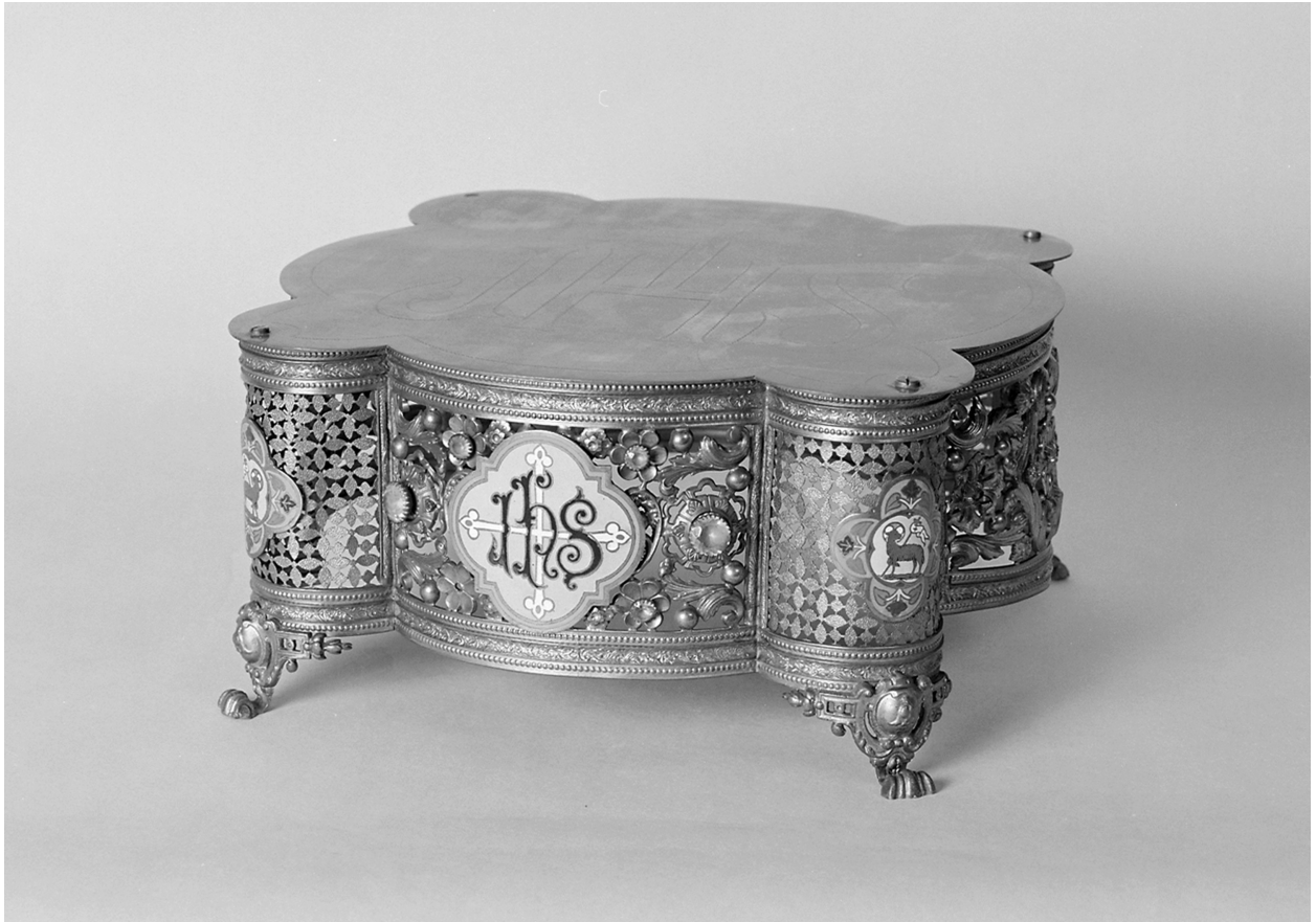
Thabor n° 2, cuivre doré, verrerie : pierres taillées rouges, vertes, 16,2 H, 34 L, 34 LA.