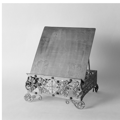
Thabor n° 1, en position de pupitre d'autel, cuivre doré, 16 H, 31 L, 36 P.