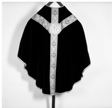
Chasuble n° 2, dite chasuble gothique, ornement noir.

Aube n° 2, lin : toile, tissu uni ajouré, brodé. 137 H, 101 H : hauteur dentelle.