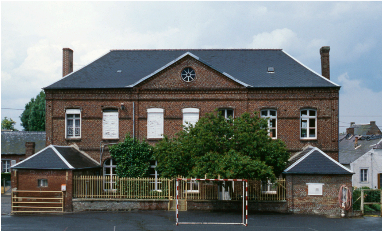
Vue générale depuis le sud.