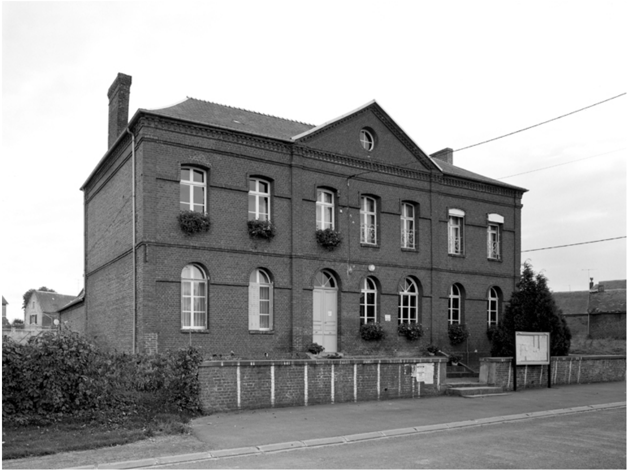
Vue générale depuis le nord.