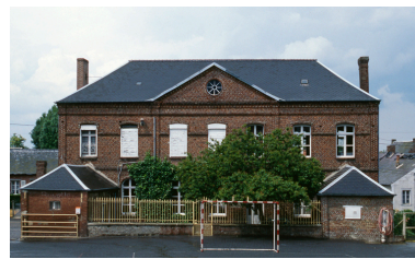
Vue générale depuis le sud. IVR22_19900202993ZA