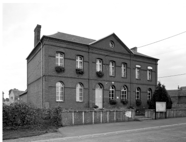
Vue générale depuis le nord. IVR22_19910201994V