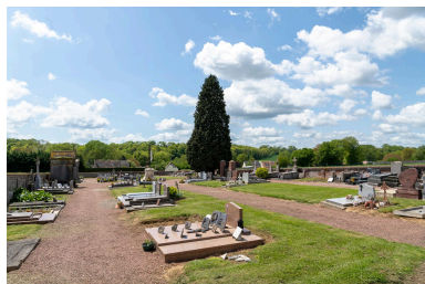
Vue générale du cimetière prise depuis l'angle nord-est.