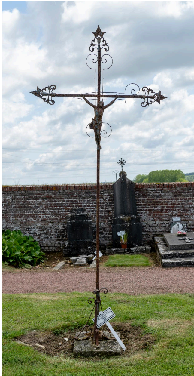
Croix funéraire en fer forgé et fonte.