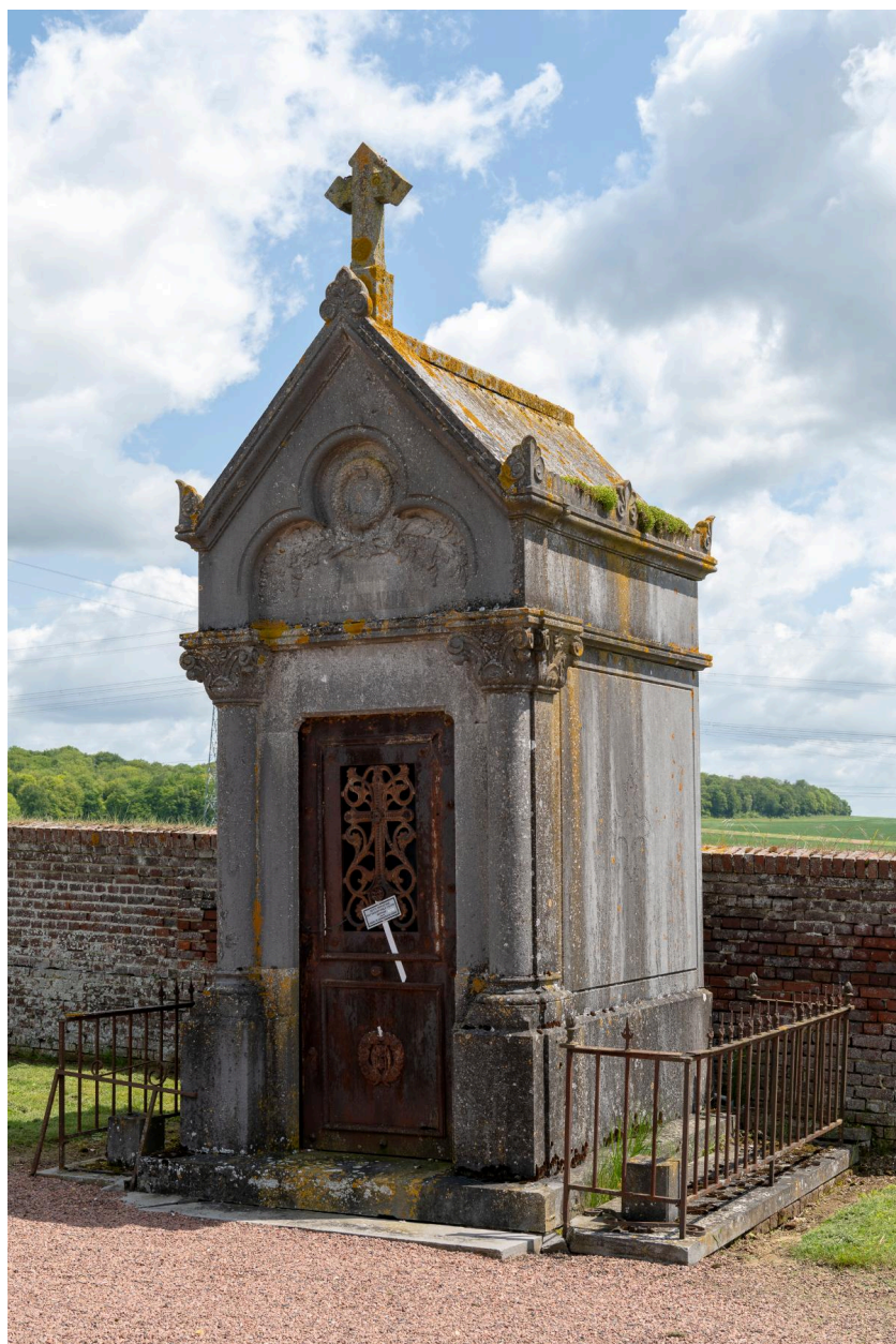
Tombeau en forme de chapelle de la famille Peaucellier-Maillard.