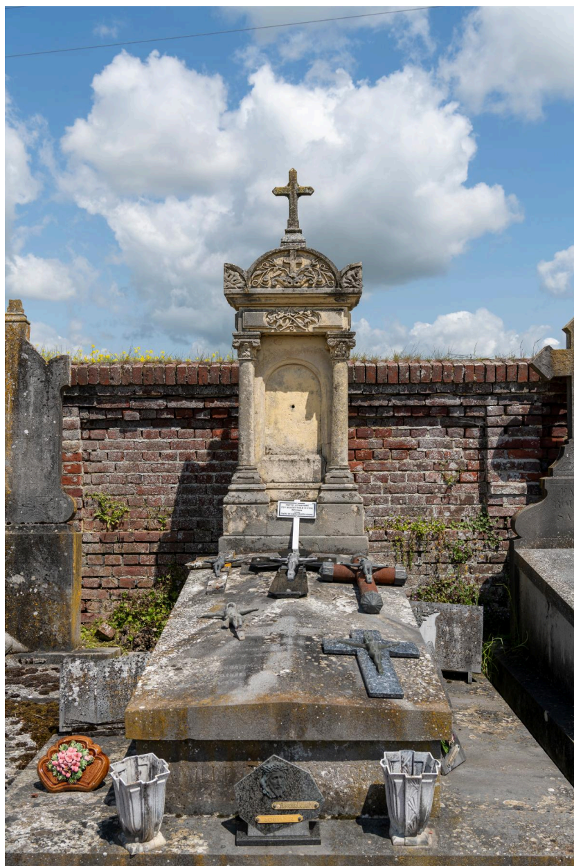
Tombeau avec stèle funéraire signé Anty à La Chaussée du Bois d'Écu.