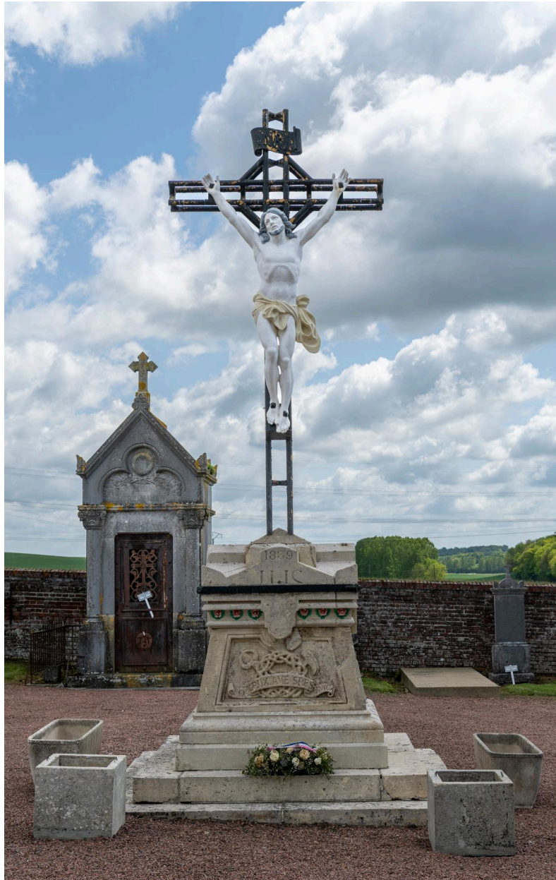
Croix du cimetière par Decaux, 1889.