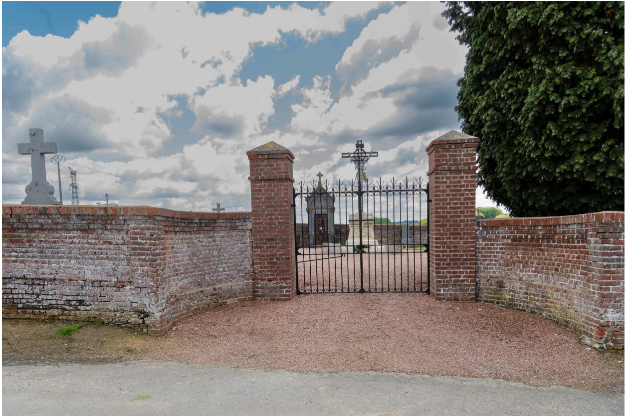
Vue générale de l'entrée du cimetière.