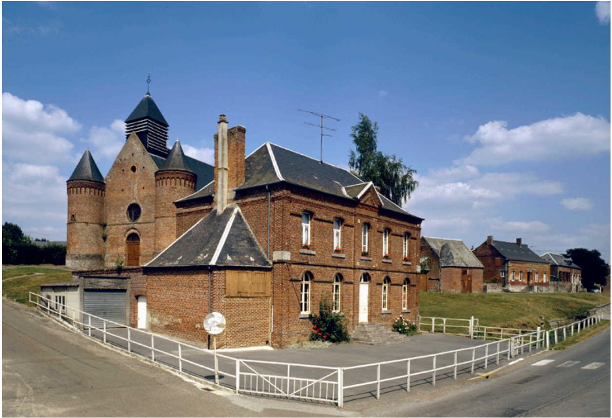
Vue des bâtiments bordant le côté nord de la rue du Général-de-Gaulle (d'ouest en est).