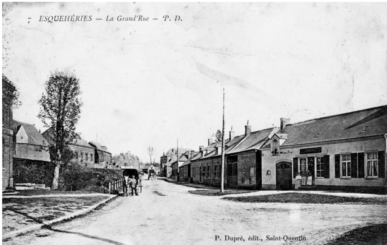
L'ancienne Grande-Rue (rue du Général de Gaulle), d'ouest en est, vers 1900.