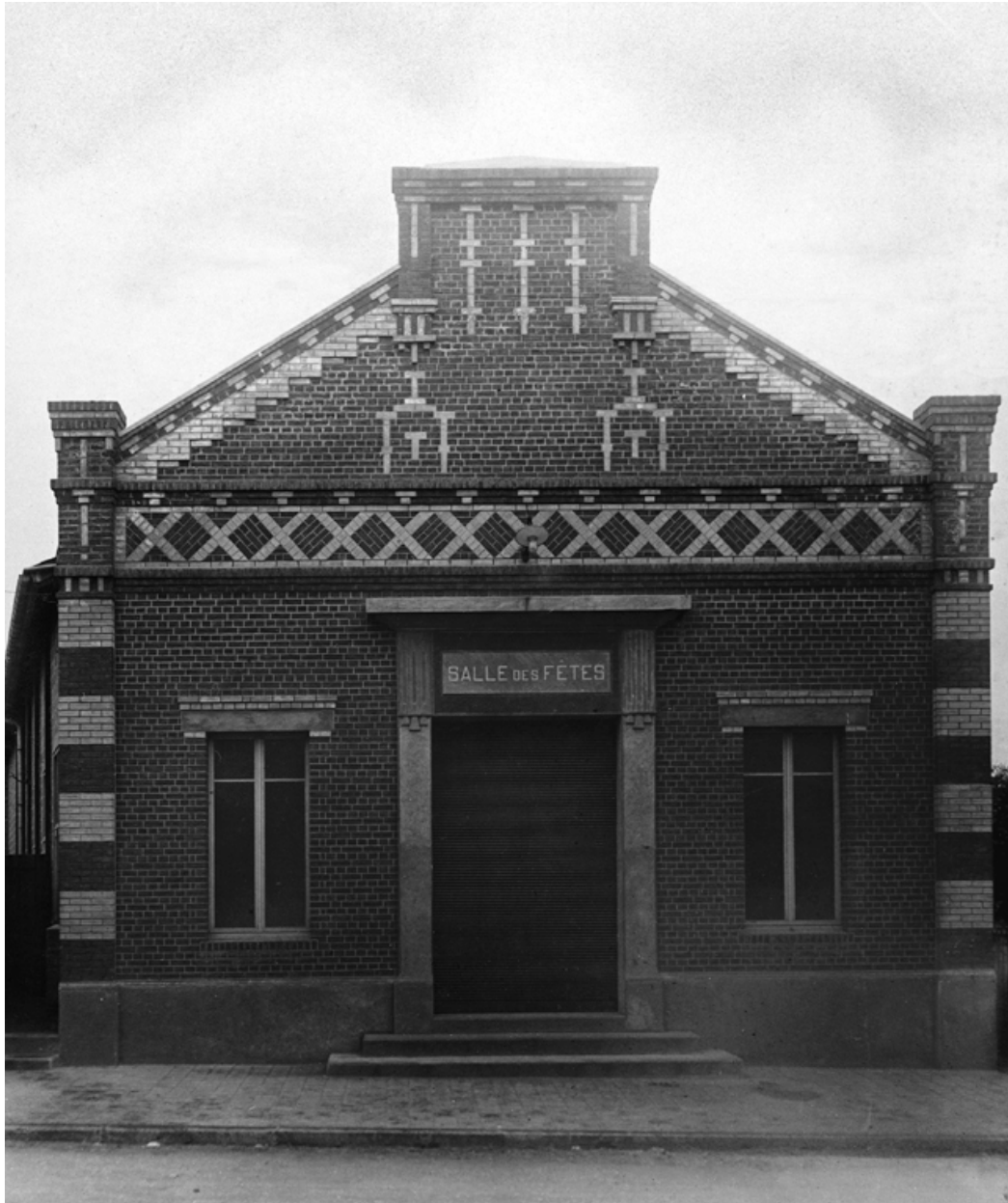
Façade sur rue de la salle des fêtes, photographie Charles Jamin architecte, [s.d.] (coll. part.).