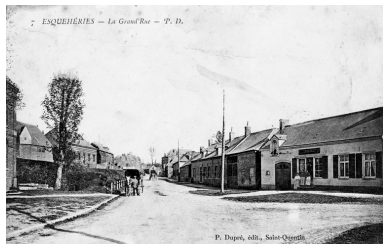
L'ancienne Grande-Rue (rue du Général de Gaulle), d'ouest en est, vers 1900.