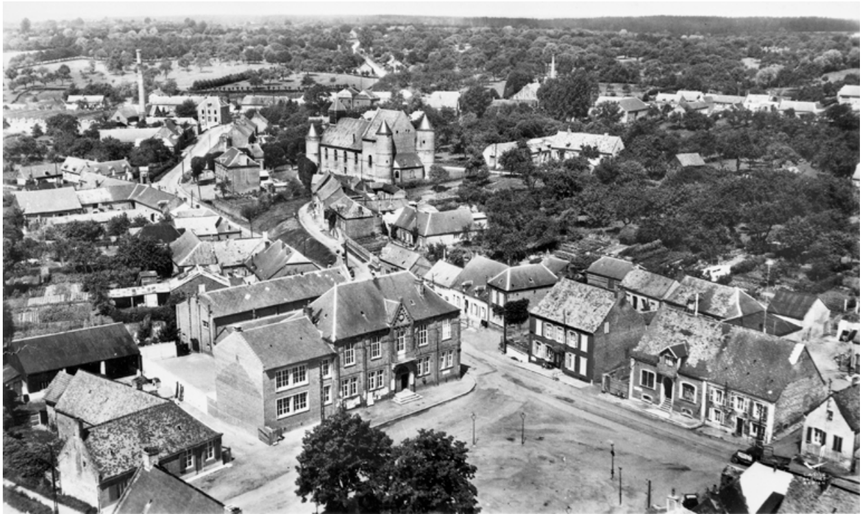
Vue aérienne du village, vers 1956 (coll. part.).