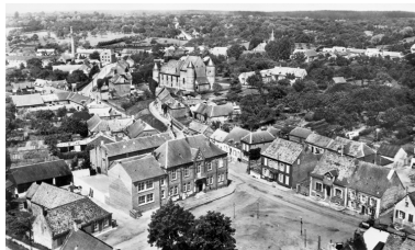
Vue aérienne du village, vers 1956.