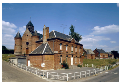
Vue des bâtiments bordant le côté nord de la rue du Général-de-Gaulle (d'ouest en est). IVR22_19930200889VA