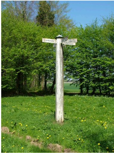
Poteau indicateur au carrefour forestier de la Grande Voierie. IVR22_20118001264NUCA