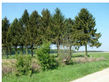
L'avenue d'épicéas avec en arrière-plan l'allée de platanes et l'allée de tilleuls.