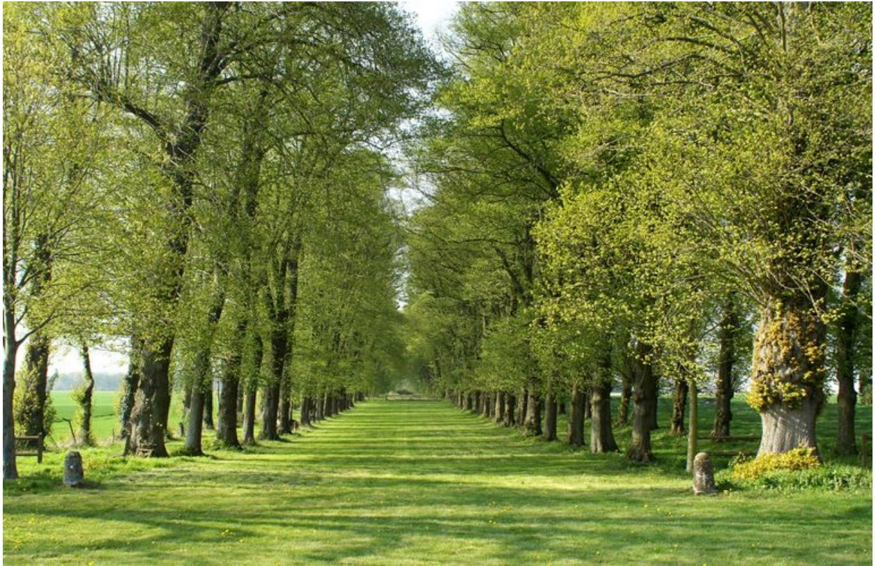
Perspective de l'avenue de tilleuls depuis l'esplanade.