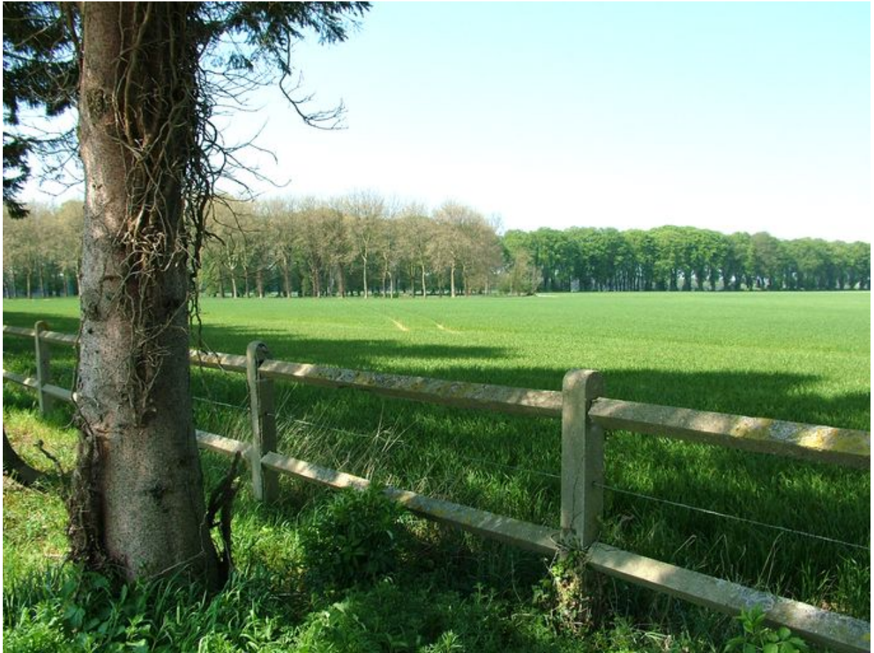
Vue de l'avenue de platanes et de l'avenue de tilleuls depuis l'avenue d'épicéas.