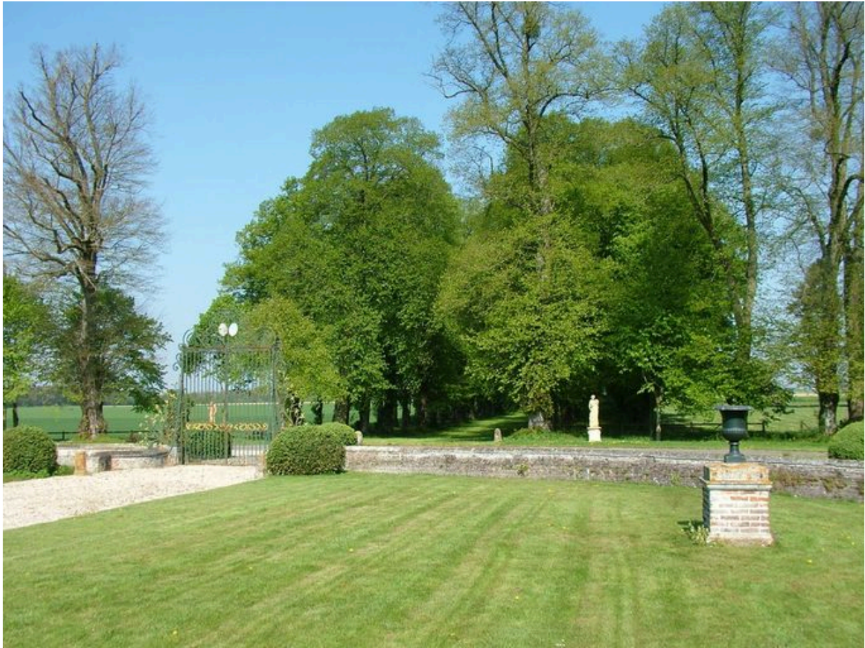
Perspective de l'avenue de tilleuls depuis la cour.