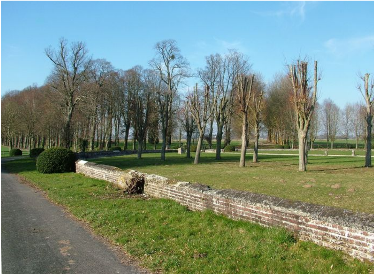
L'avenue de tilleuls et l'avenue de platanes axées sur la cour.