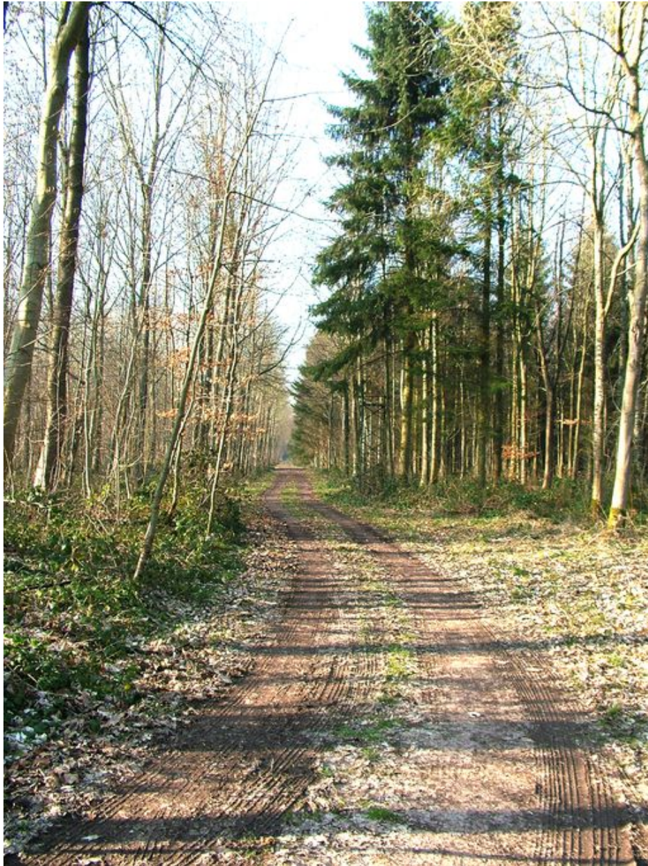
Allée forestière dite voie de Barlette dans le bois de Ribeaucourt.