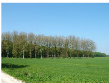
L'avenue de platanes et l'avenue de tilleuls vues depuis l'avenue d'épicéas.