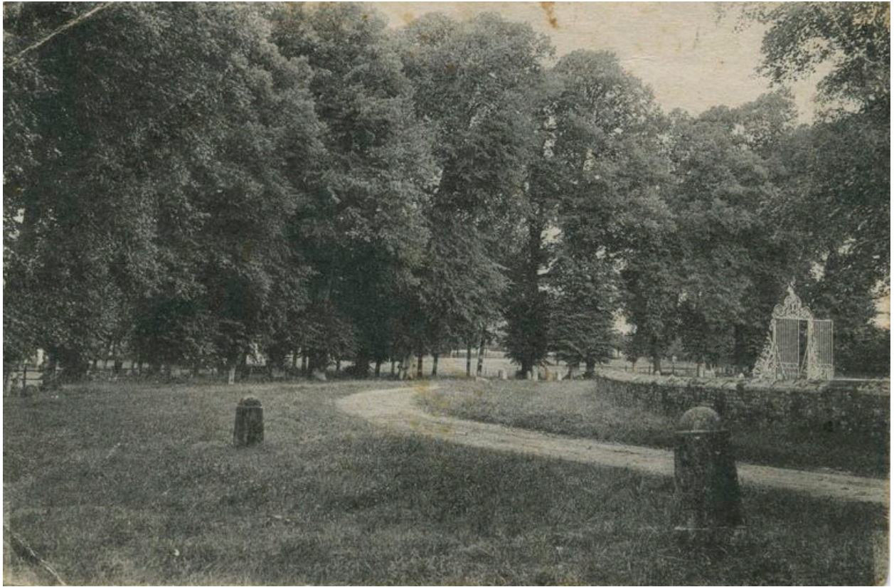
Vue partielle de l'esplanade, du mur de clôture et du portail, carte postale, années 1920.