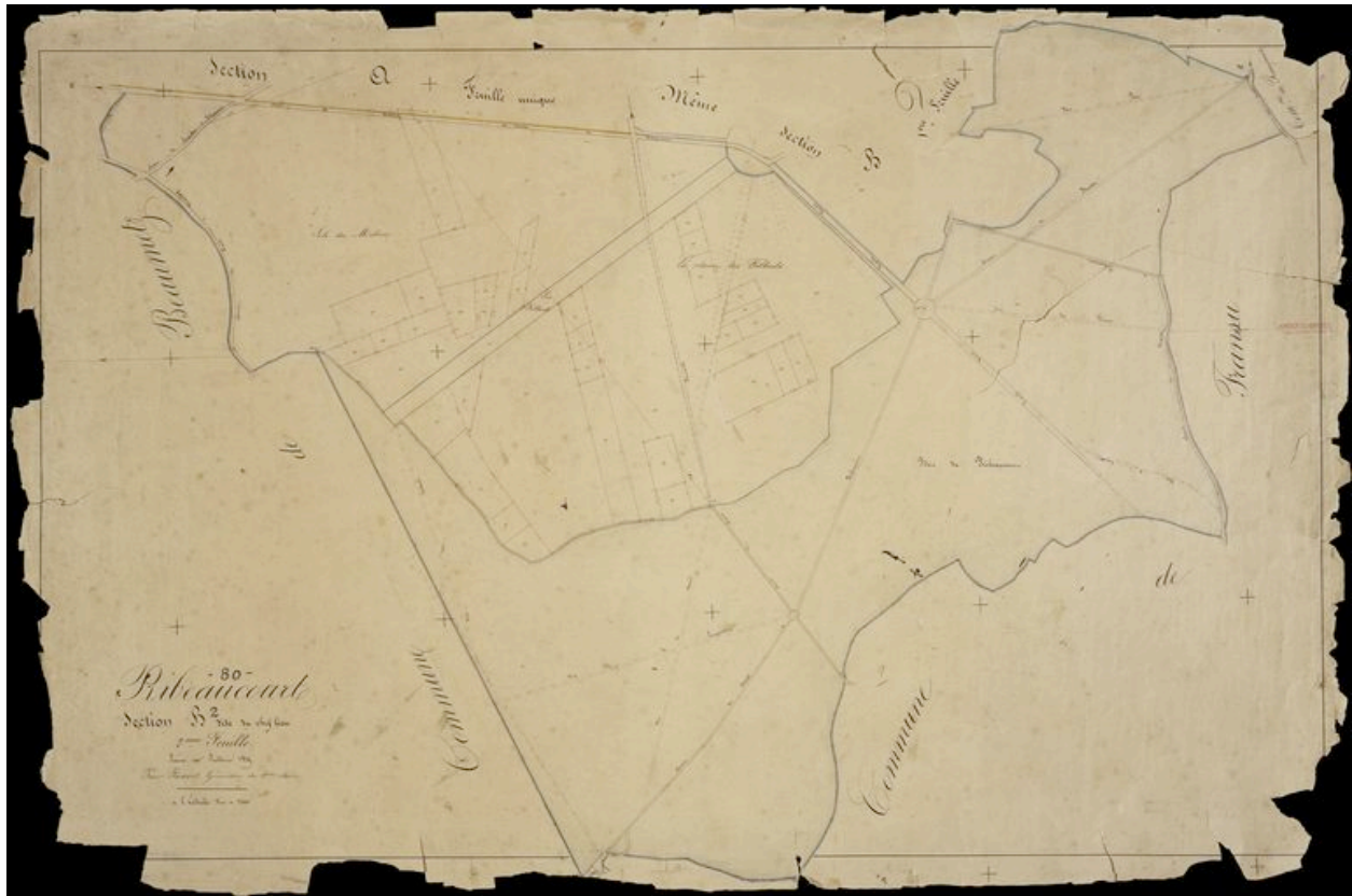
Plan des perspectives du grand parc et du parc de chasse, 1835 (AD Somme, 3P 1461/4).