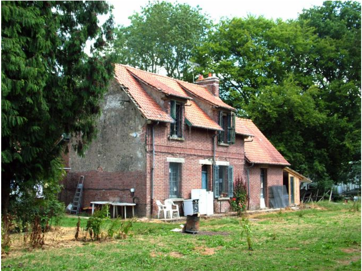
Maison forestière dite Maison Rouge, en lisière du bois de Ribeaucourt à Fransu.