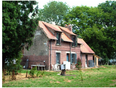
Maison forestière dite Maison Rouge, en lisière du bois de Ribeaucourt à Fransu. IVR22_20108001903NUCA