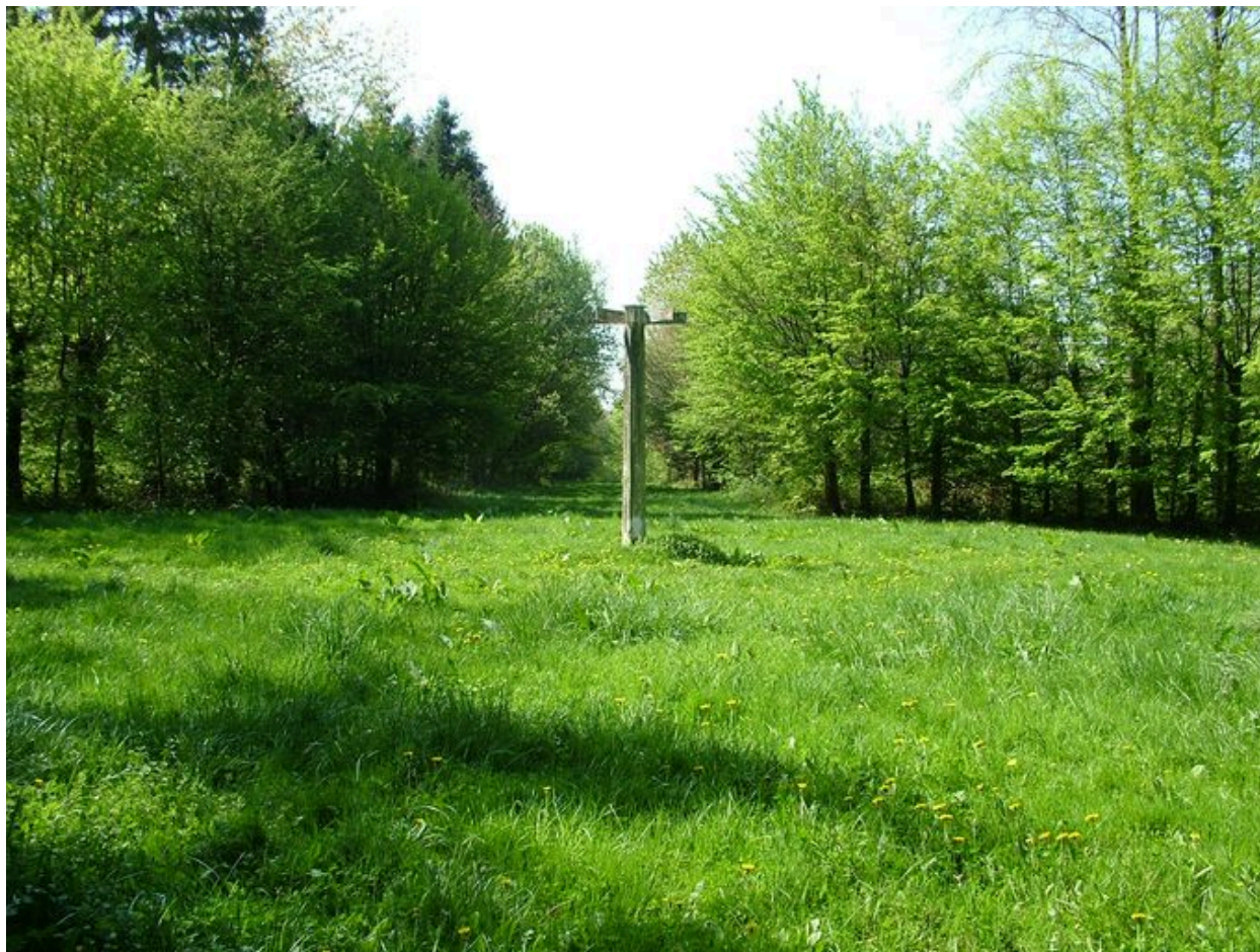
Carrefour forestier de la Grande Voierie.