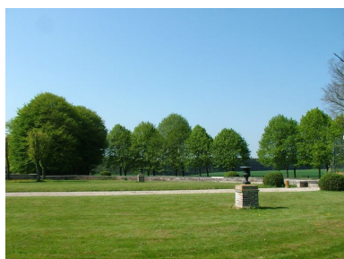
Perspective de l'allée de charmes, ou allée de la Grande Voierie.