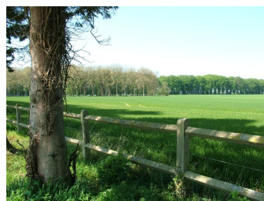
Vue de l'avenue de platanes et de l'avenue de tilleuls depuis l'avenue d'épicéas. IVR22_20118001267NUCA