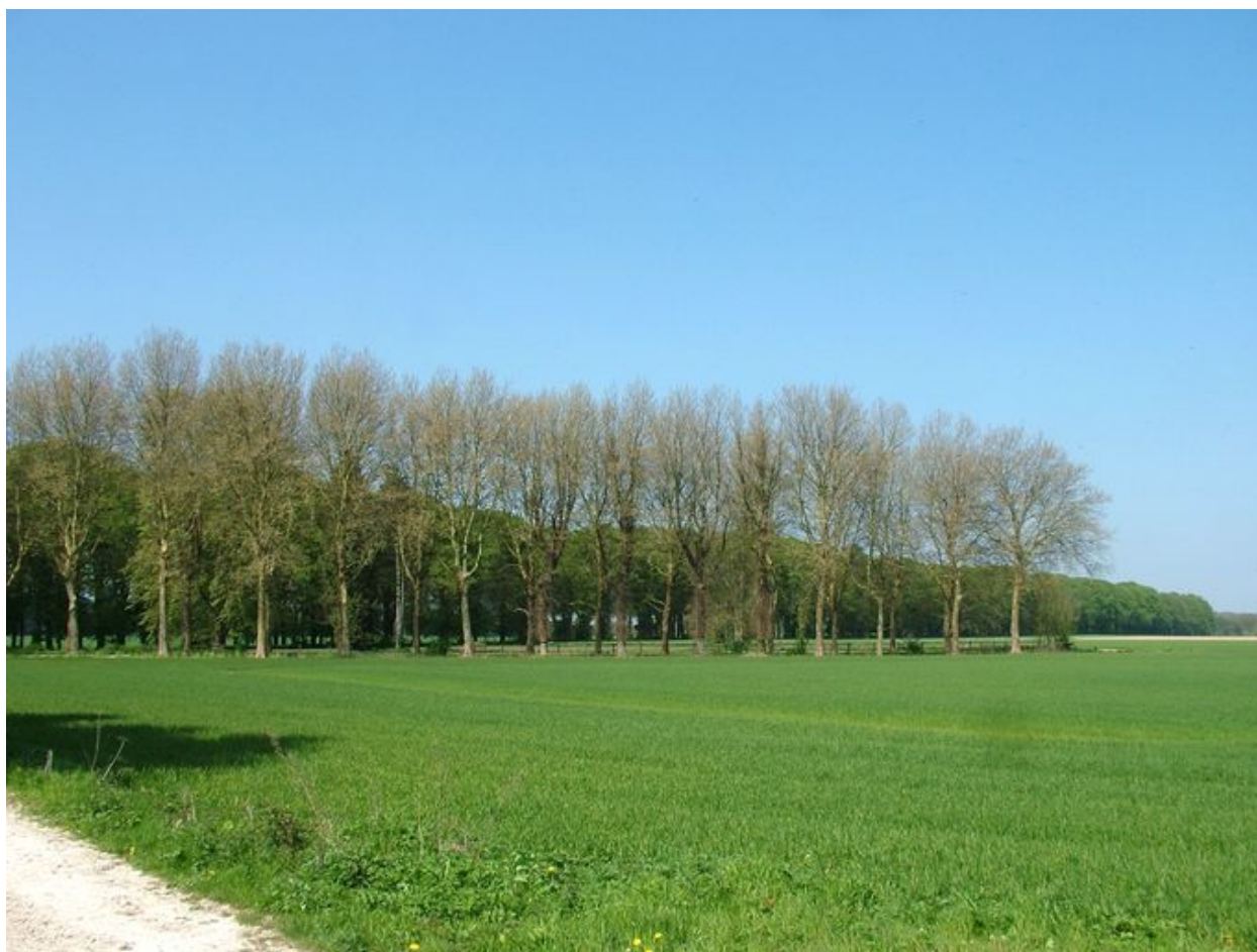
L'avenue de platanes et l'avenue de tilleuls vues depuis l'avenue d'épicéas.