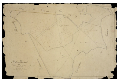
Plan des perspectives du grand parc et du parc de chasse, 1835 (AD Somme, 3P 1461/4).