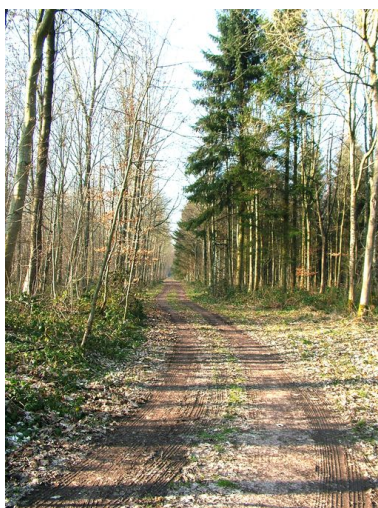
Allée forestière dite voie de Barlette dans le bois de Ribeaucourt. IVR22_20118001019NUCA