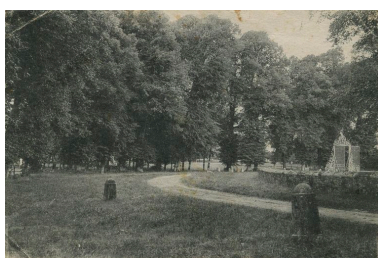
Vue partielle de l'esplanade, du mur de clôture et du portail, carte postale, années 1920 (coll. part). IVR22_20118000640NUCA