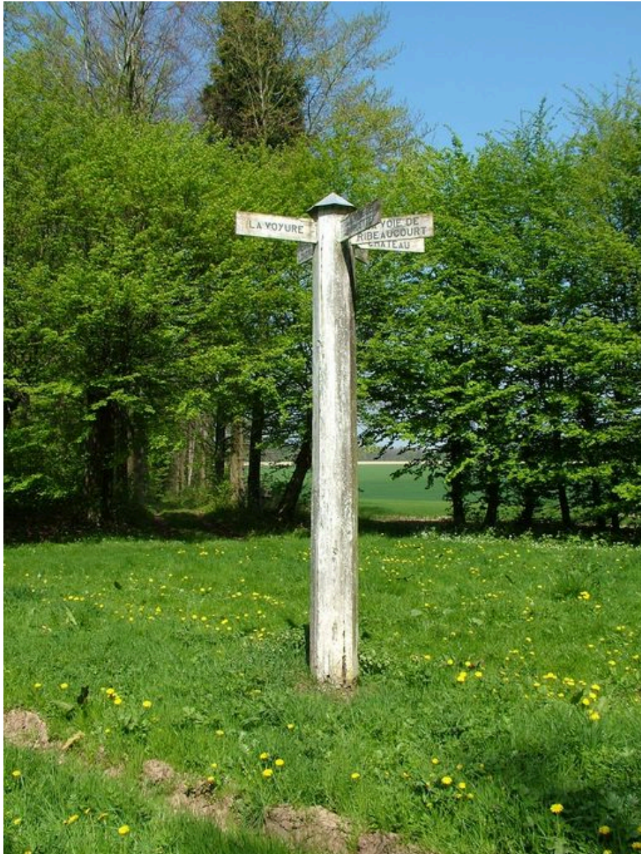
Poteau indicateur au carrefour forestier de la Grande Voierie.