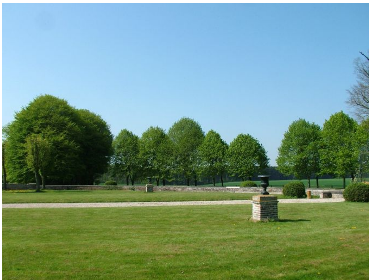
Perspective de l'allée de charmes, ou allée de la Grande Voierie.