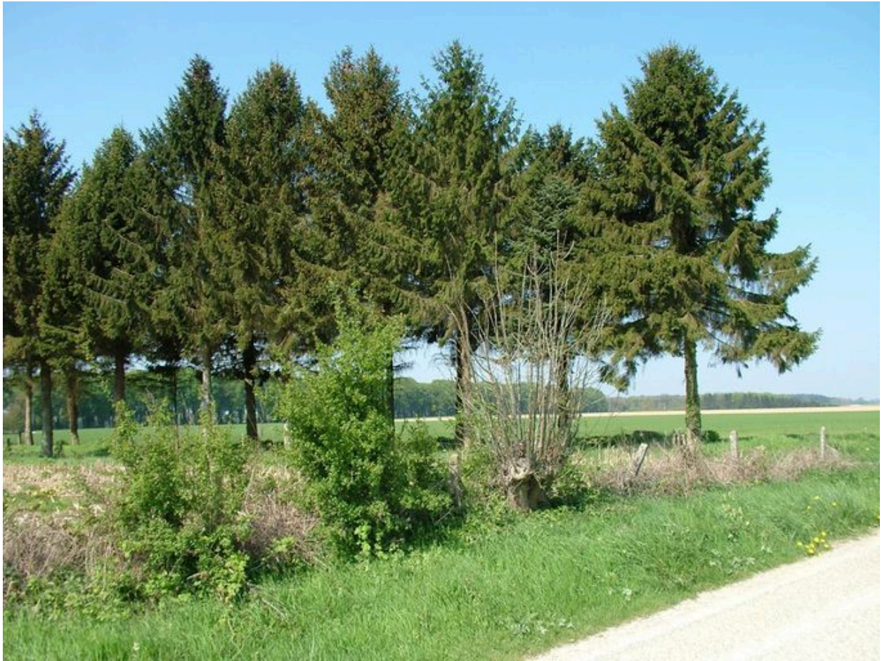
L'avenue d'épicéas avec en arrière-plan l'allée de platanes et l'allée de tilleuls.