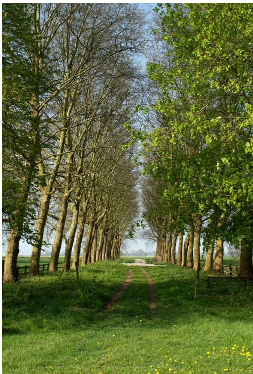
Perspective de l'avenue de platanes depuis l'esplanade.