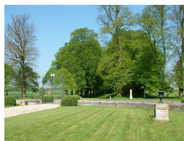
Perspective de l'avenue de tilleuls depuis la cour.