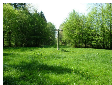
Carrefour forestier de la Grande Voierie.