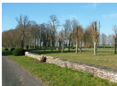
L'avenue de tilleuls et l'avenue de platanes axées sur la cour.