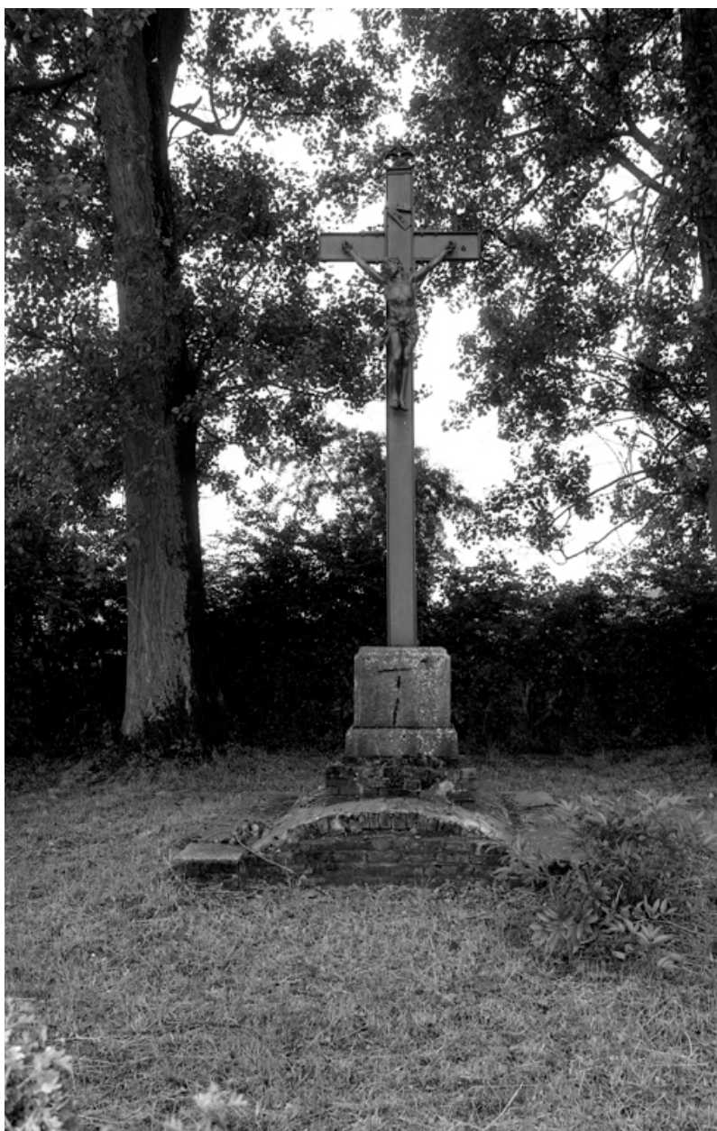
Vue d'ensemble de la croix, érigée en 1886.