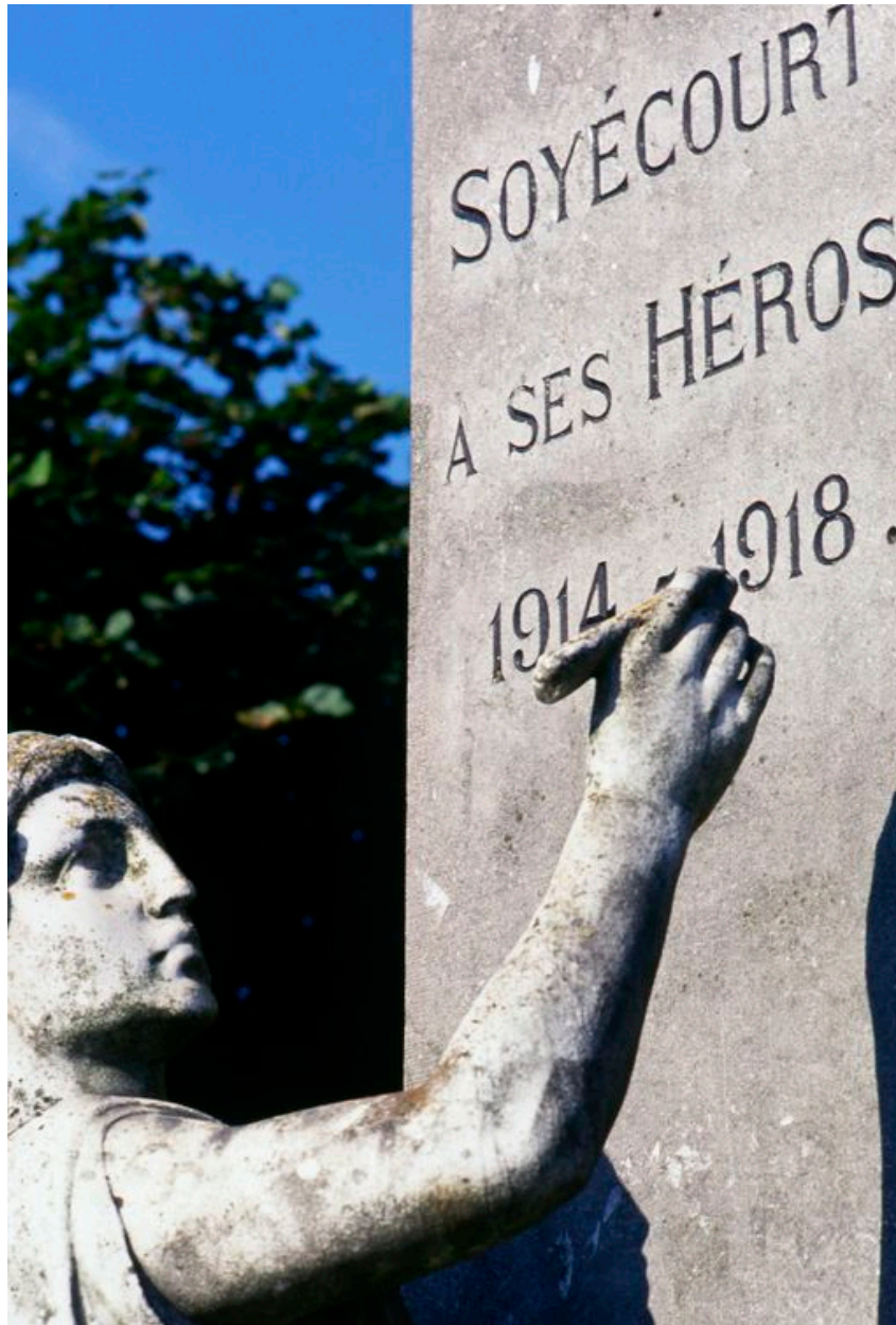
Vue de détail de la statue.