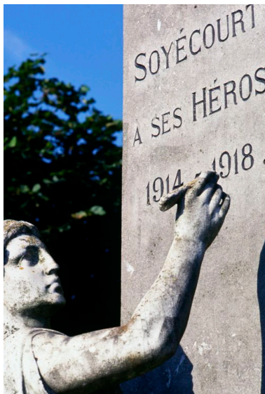
Vue de détail de la statue. IVR22_19948000452ZA