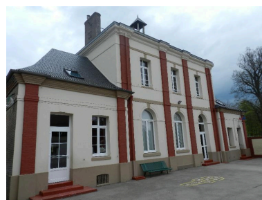
Vue de trois-quarts depuis le sud.