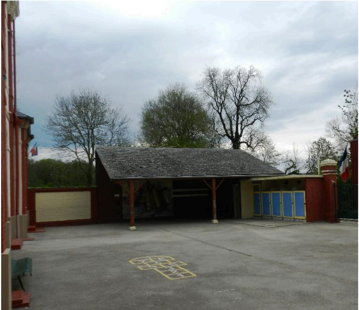
Vue du préau et des sanitaires.