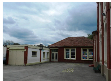
Vue de la nouvelle salle de classe et du bâtiment occupant l'emplacement de l'ancienne étable et de la buanderie.