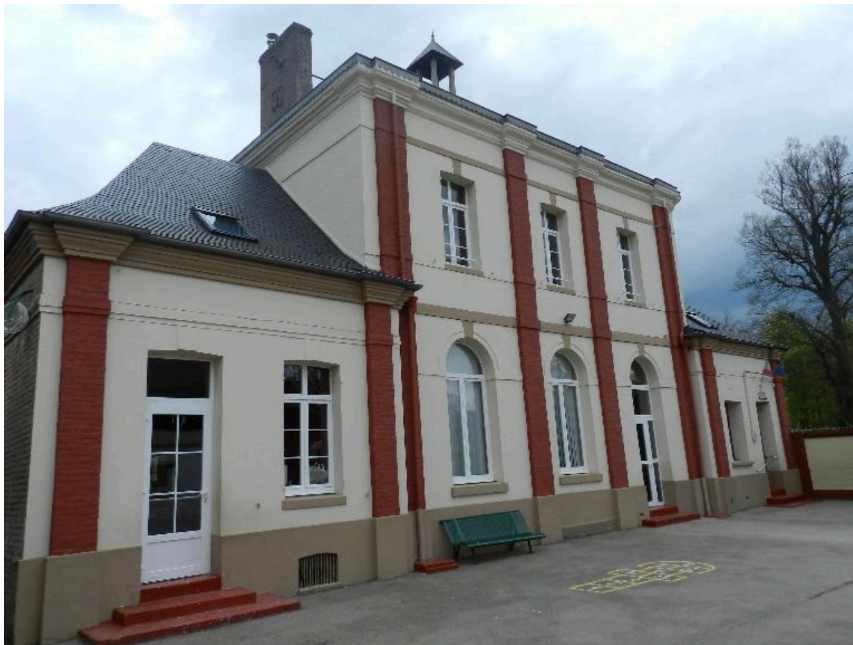
Vue de trois-quarts depuis le sud.