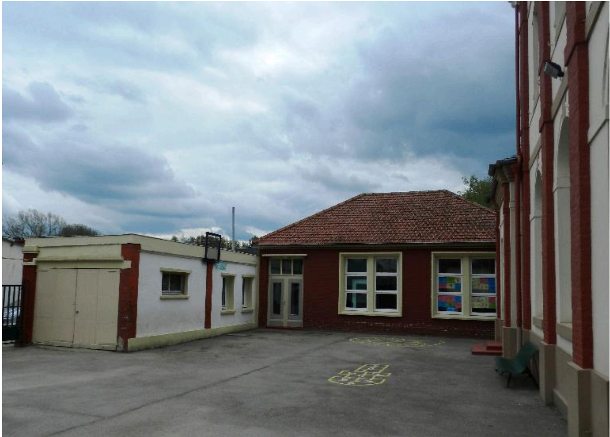
Vue de la nouvelle salle de classe et du bâtiment occupant l'emplacement de l'ancienne étable et de la buanderie.