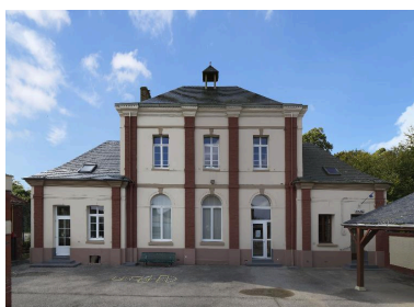
Vue générale de la mairie et de l'école. IVR22_20158000779NUC2A