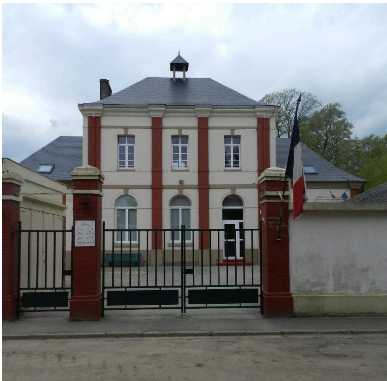
Vue du portail de l'ancienne école, seul le passage piéton de gauche a été conservé.