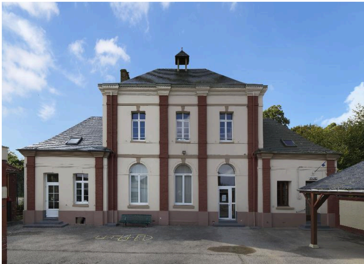
Vue générale de la mairie et de l'école.