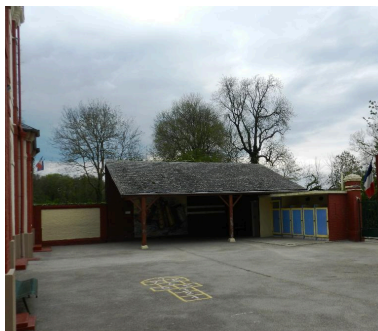
Vue du préau et des sanitaires. IVR22_20128015565NUCA