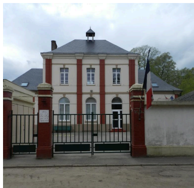
Vue du portail de l'ancienne école, seul le passage piéton de gauche a été conservé.