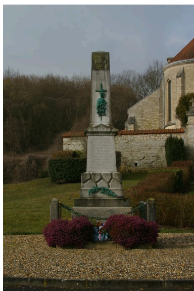
Vue générale. IVR22_20050200650NUCA