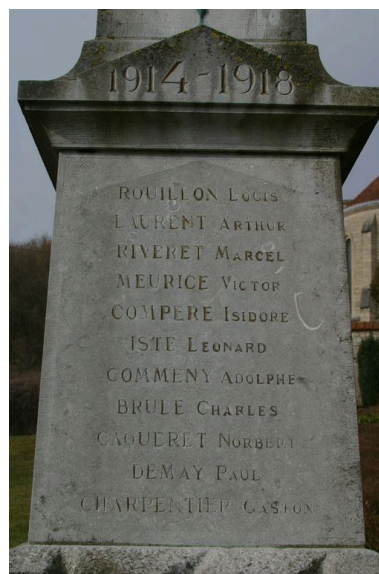
Détail de la liste des victimes de 1914-1918. IVR22_20050200652NUCA