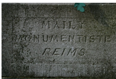
Détail de la signature.