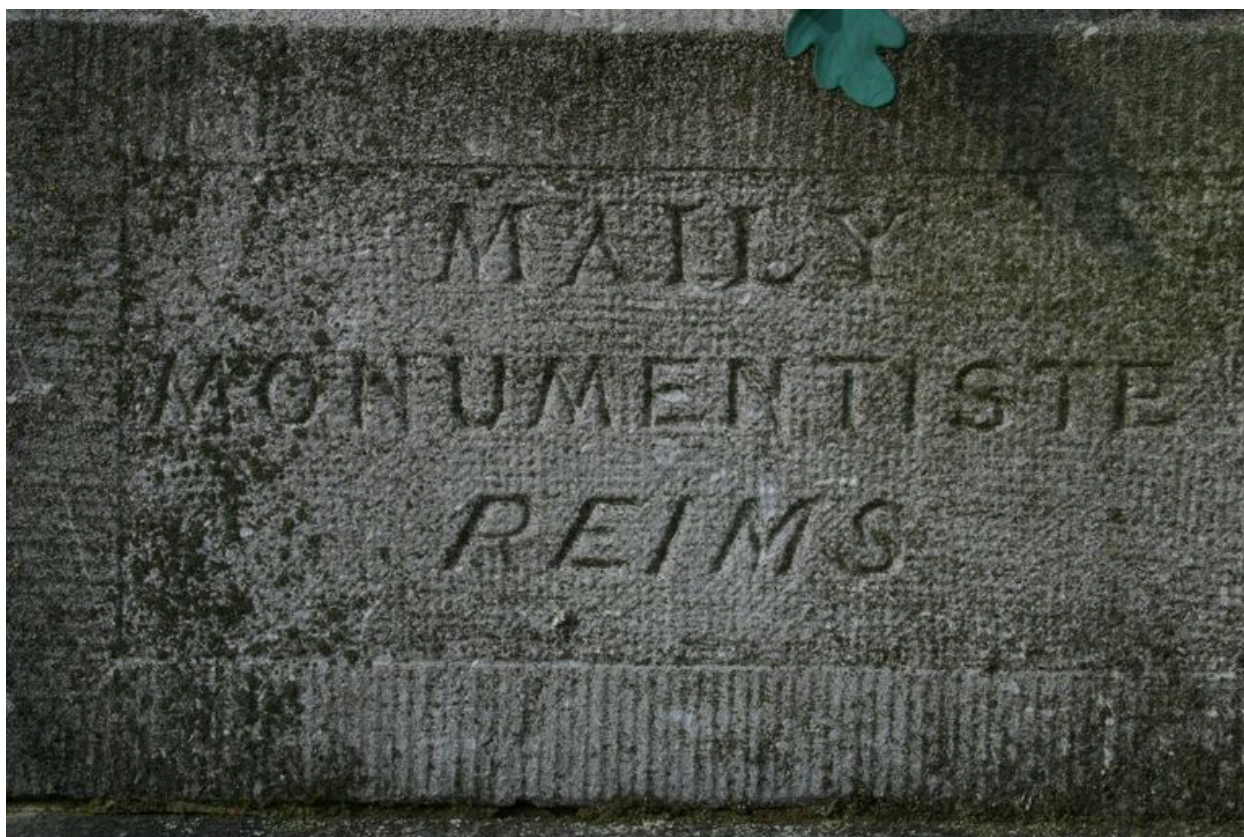
Détail de la signature.