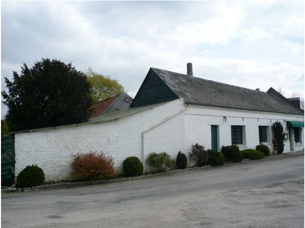
Vue des étables à cochons dans le prolongement du logis.