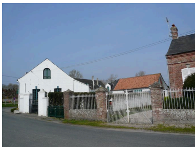
Vue des bâtiments depuis l'est. IVR22_20078005707NUCA