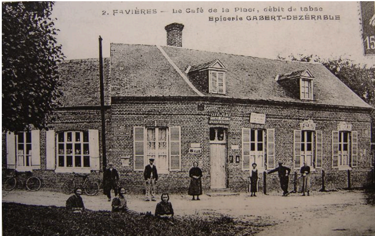
Vue du café au début du 20e siècle.