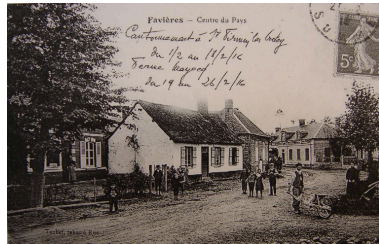
Vue du centre-village au début du 20e siècle.