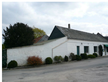
Vue des étables à cochons dans le prolongement du logis. IVR22_20078005708NUCA