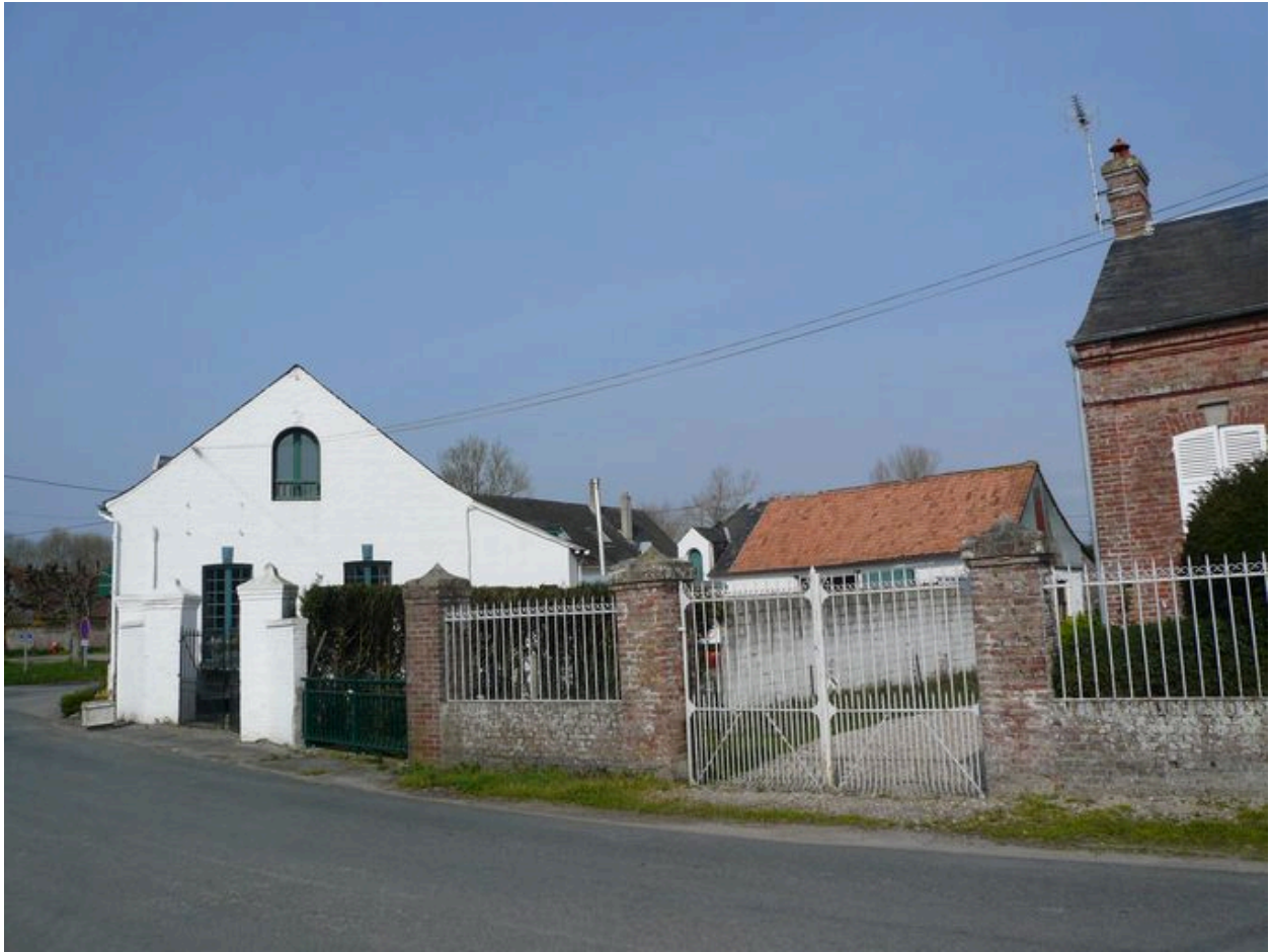
Vue des bâtiments depuis l'est.