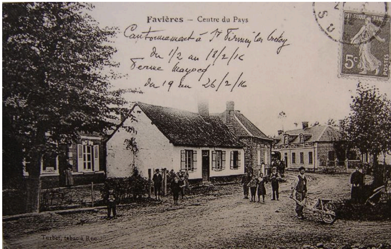
Vue du centre-village au début du 20e siècle.