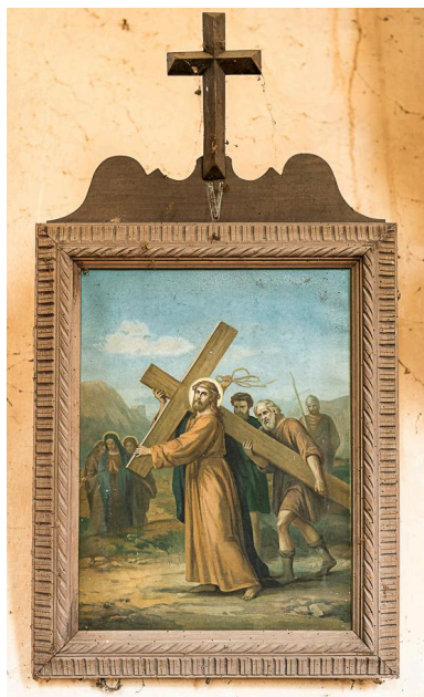
Station 5 du chemin de croix : Simon le Cyrénéen aide Jésus à porter sa croix, impression sur carton, 1er quart du 20e siècle.