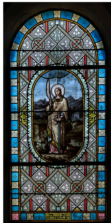
Verrière figurée et grisaille (baie 3) : sainte Philomène, atelier Tallon à Saint-Quentin, 1901. IVR32_20226000232NUCA