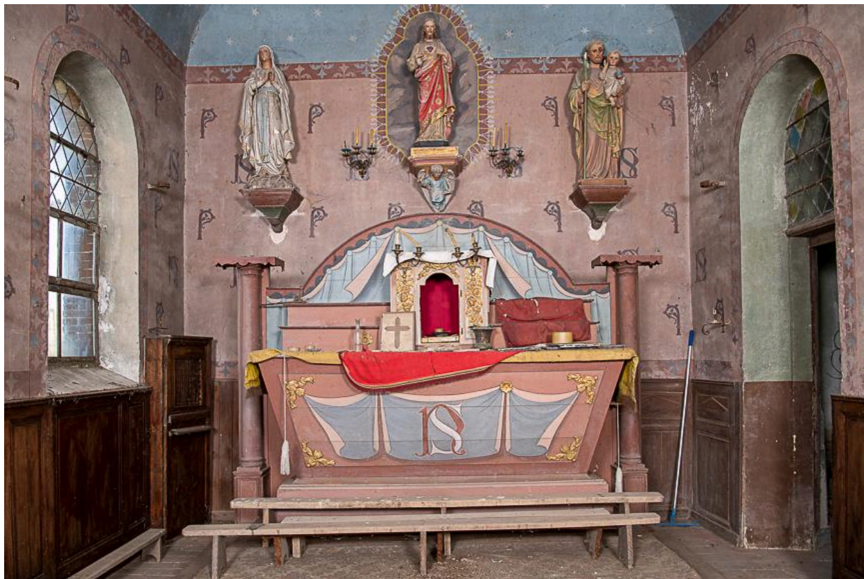
Vue générale du chœur.