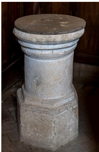
Fonts baptismaux, pierre, 17e siècle (?).