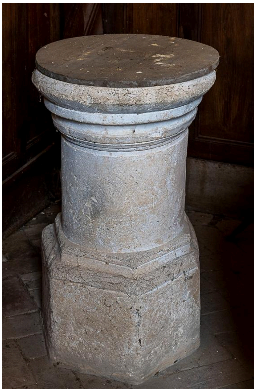
Fonts baptismaux, pierre, 17e siècle (?).