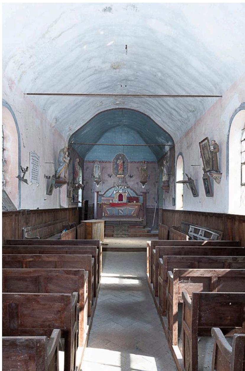
Vue générale vers le choeur.