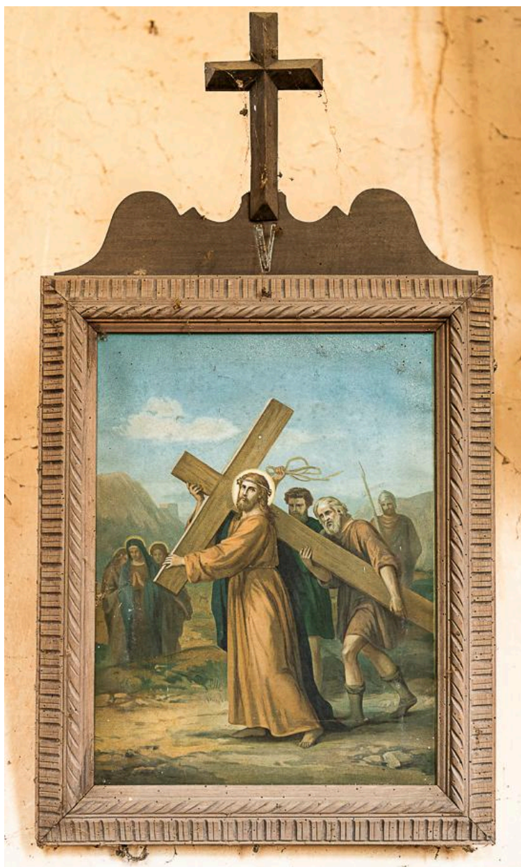
Station 5 du chemin de croix : Simon le Cyrénéen aide Jésus à porter sa croix, impression sur carton, 1er quart du 20e siècle.