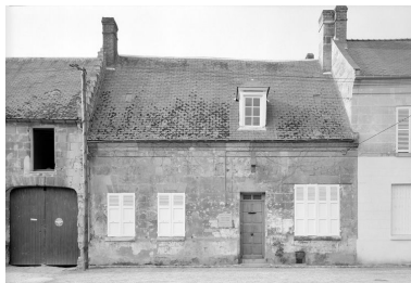
Élévation antérieure.