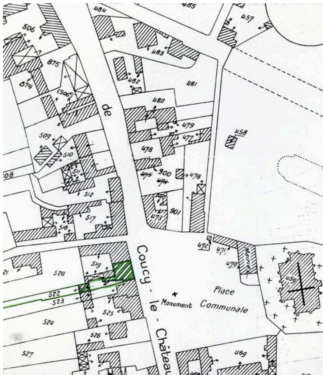
Plan de situation. Extrait du plan cadastral de 1962, section C2 522.