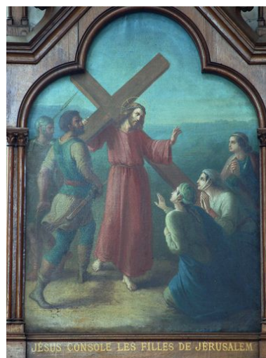
8e station (bas-côté sud) IVR31_20106202824NUCA