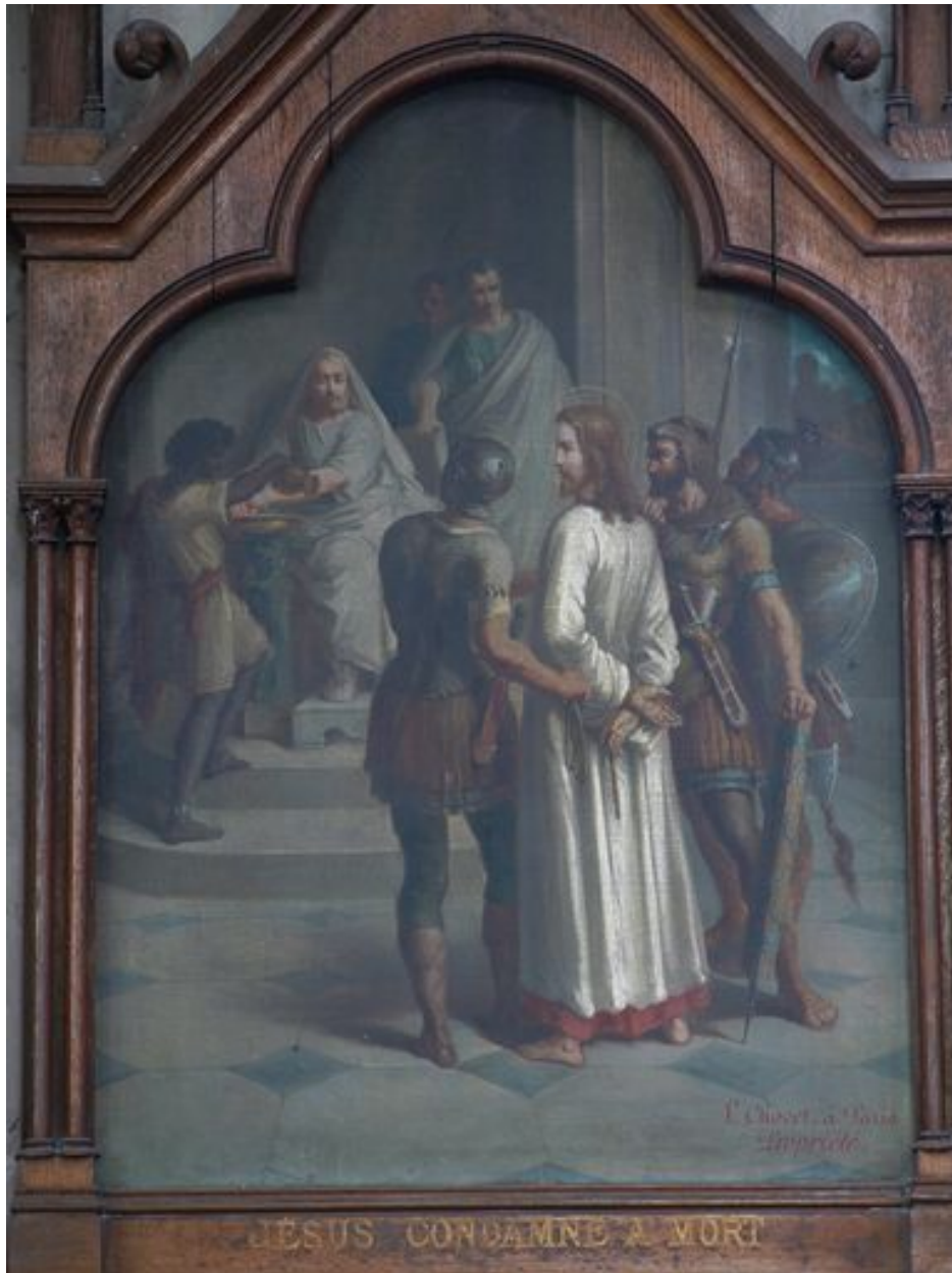
1ère station (bas-côté nord)