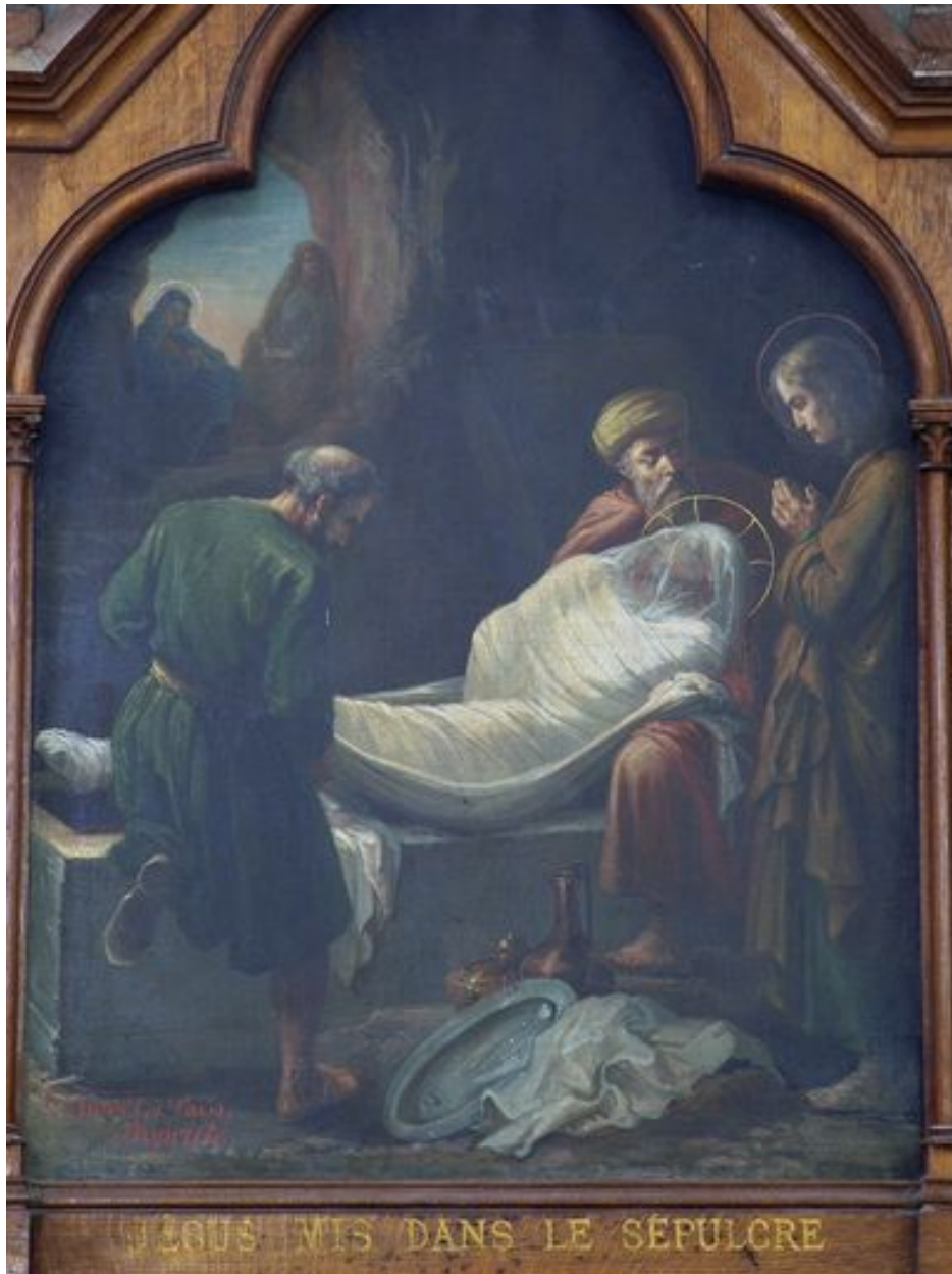
14e station (bas-côté sud)