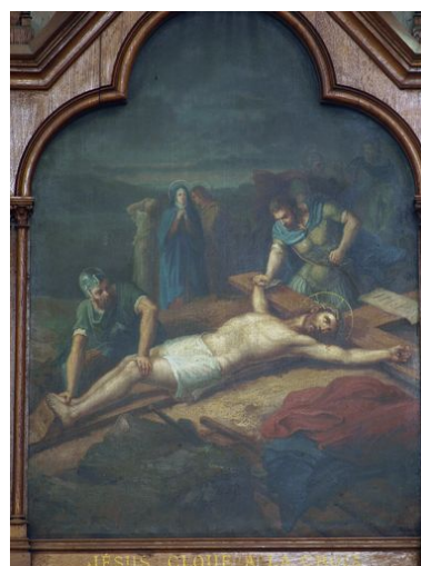
11e station (bas-côté sud) IVR31_20106202827NUCA