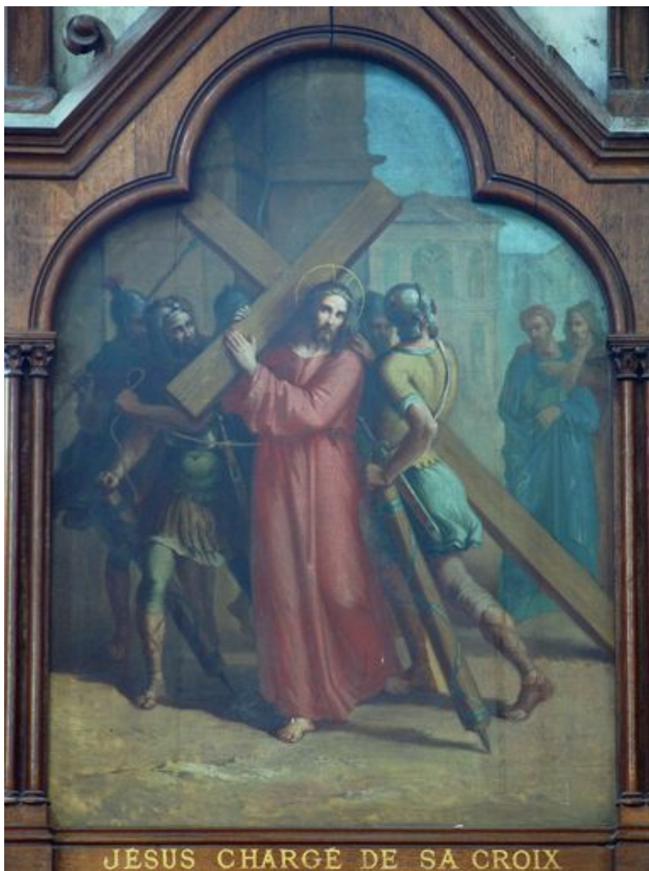
2e station (bas-côté nord)