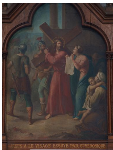
6e station (bas-côté nord) IVR31_20106202822NUCA