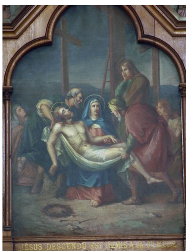
13e station (bas-côté sud) IVR31_20106202829NUCA