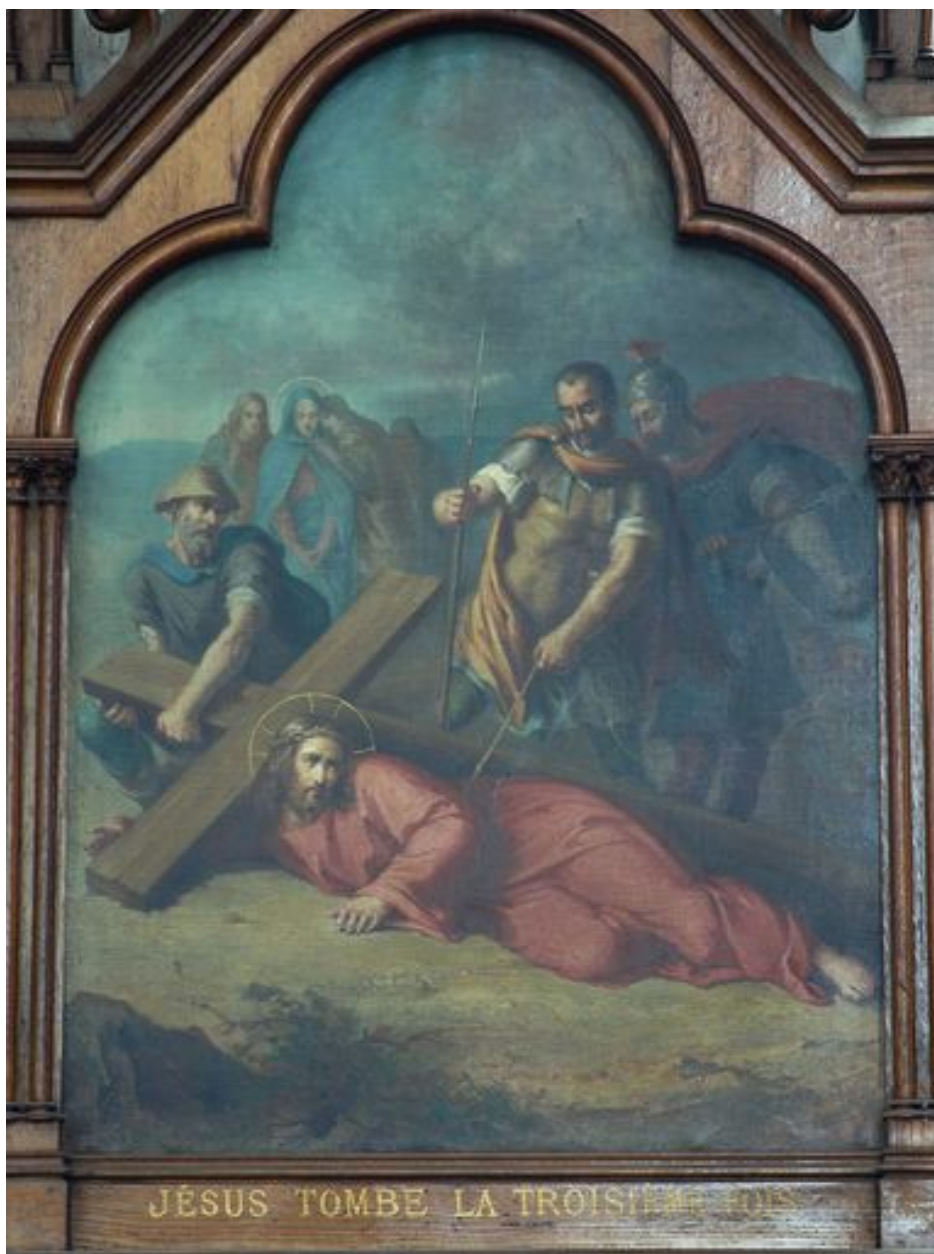
9e station (bas-côté sud)