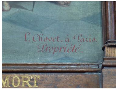
Détail : signature au bas de la 1ère station. IVR31_20106202817NUCA