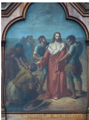
10e station (bas-côté sud) IVR31_20106202826NUCA