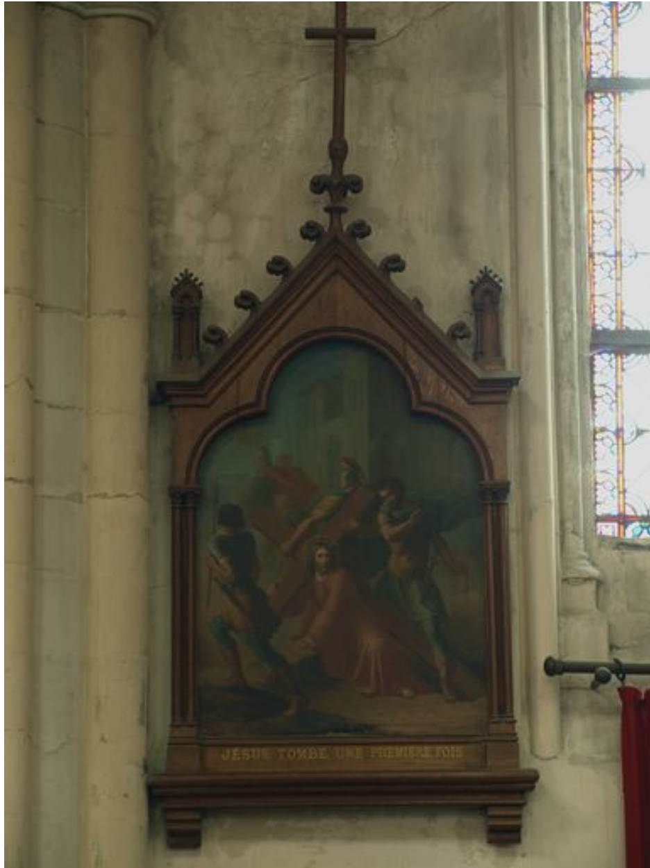
Vue générale, avec cadre (3e station)