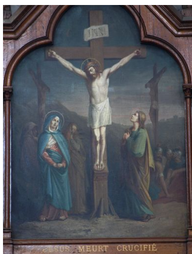
12e station (bas-côté sud) IVR31_20106202828NUCA