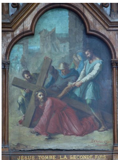
7e station (bas-côté nord) IVR31_20106202823NUCA