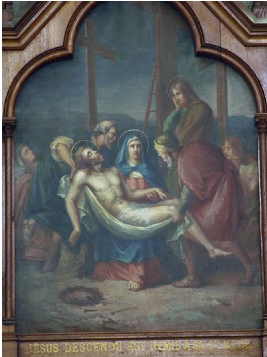
13e station (bas-côté sud)