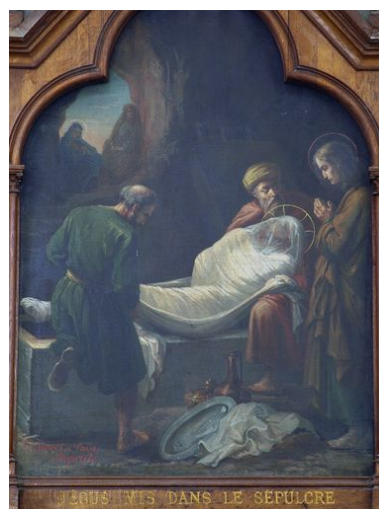
14e station (bas-côté sud) IVR31_20106202830NUCA