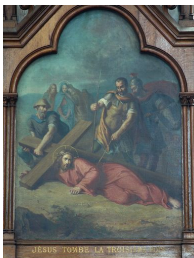
9e station (bas-côté sud) IVR31_20106202825NUCA