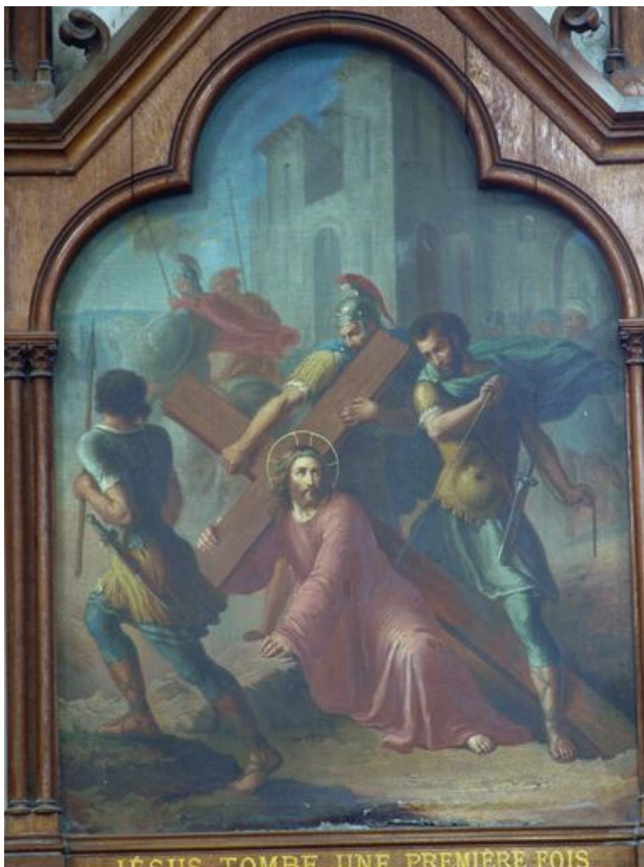
3e station (bas-côté nord)