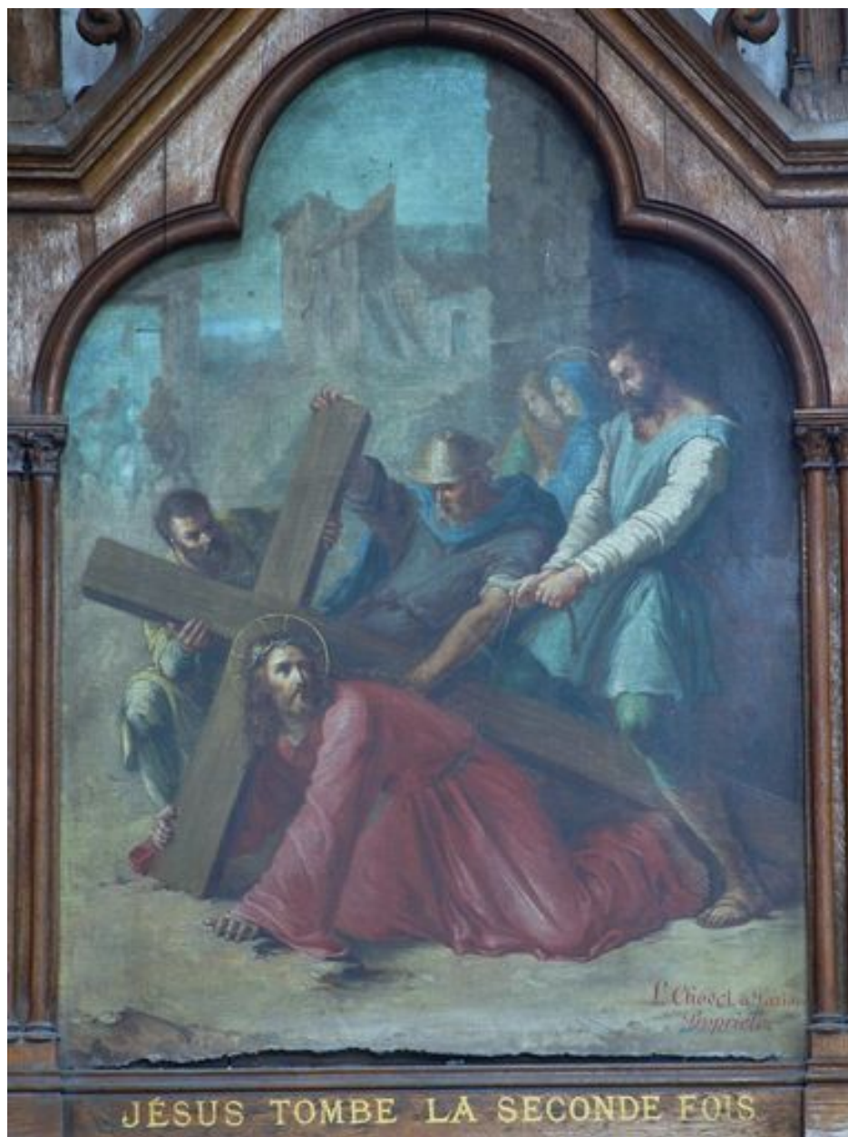
7e station (bas-côté nord)