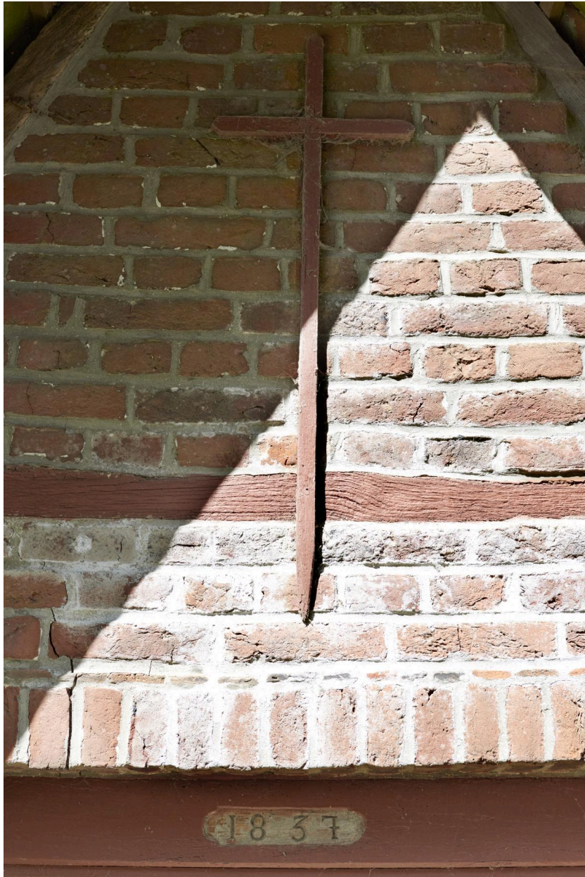
Détail du fronton de l'édifice.