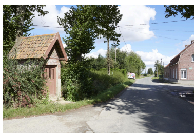
Implantation de la chapelle en bord de route. IVR32_20245903020NUCA