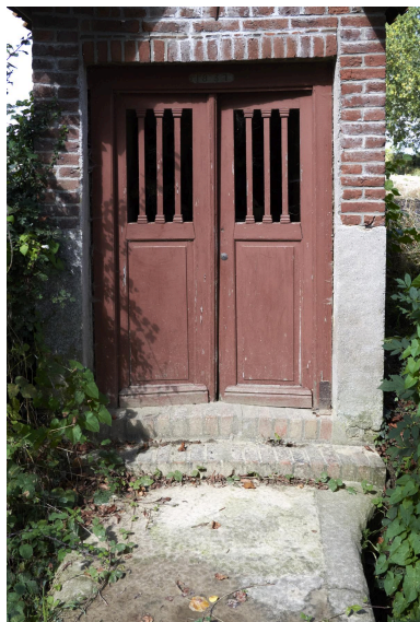
Détail de la porte et de l'entrée.