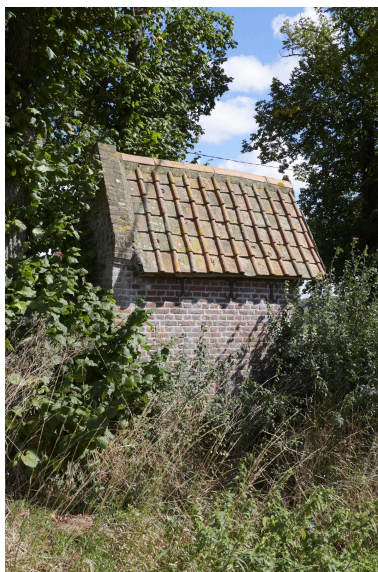
Arrière de l'édifice.