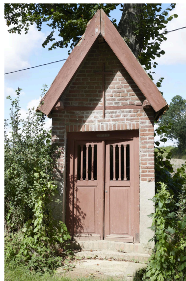
Façade sur rue.