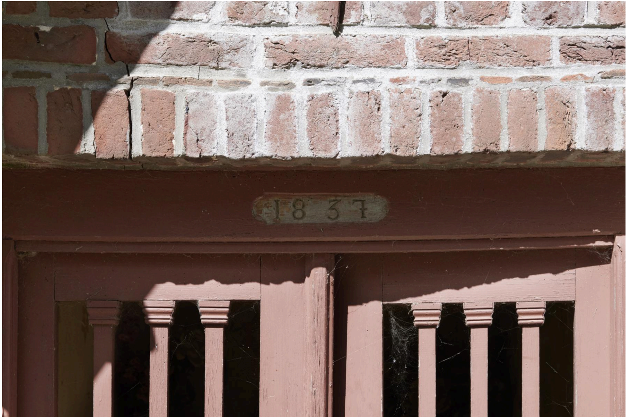
Détail de la date portée "1837".