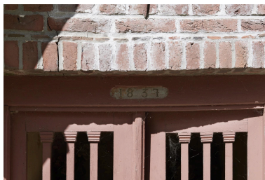
Détail de la date portée "1837".