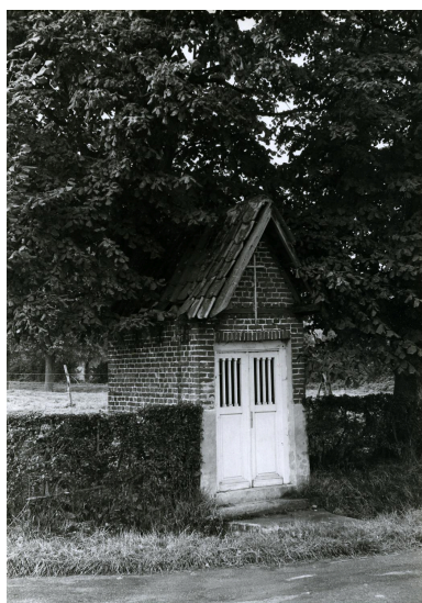
La chapelle en 1974, photographie en noir et blanc.