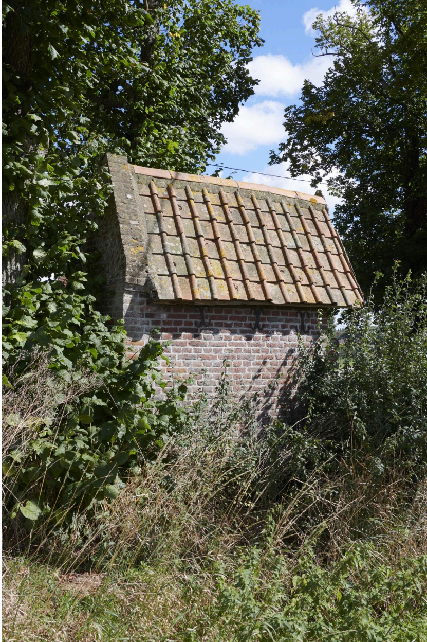
Arrière de l'édifice.