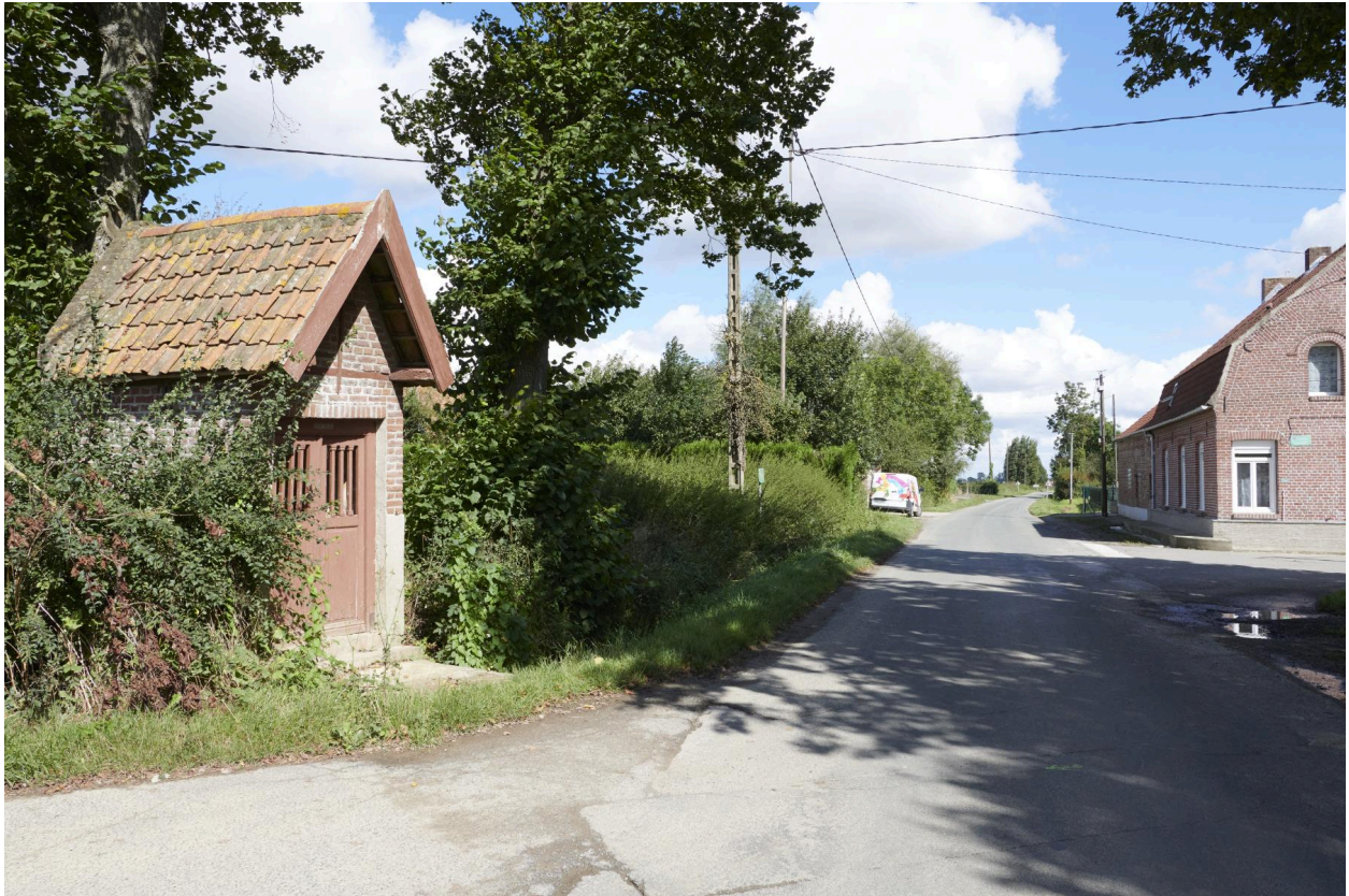
Implantation de la chapelle en bord de route.