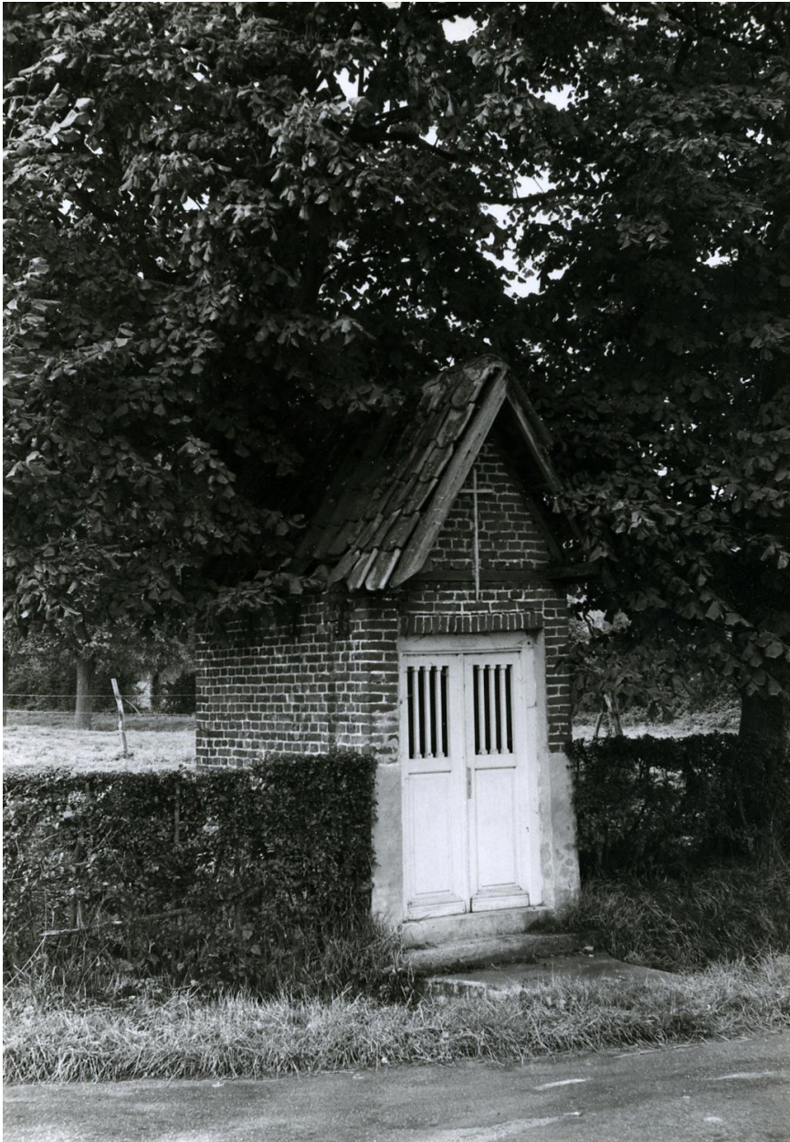
La chapelle en 1974, photographie en noir et blanc.