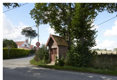
Implantation au croisement de deux routes. IVR32_20245903013NUCA