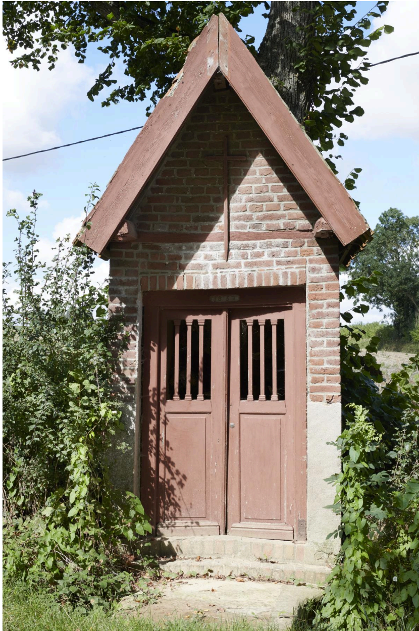
Façade sur rue.