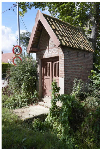
Façade et côté gauche.