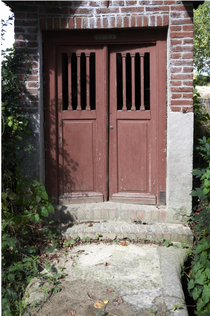
Détail de la porte et de l'entrée.