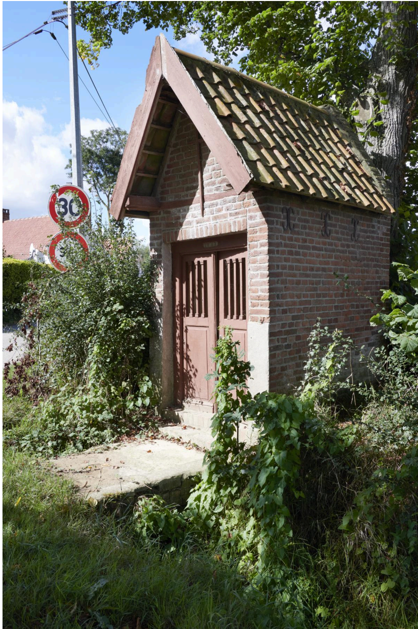
Façade et côté gauche.