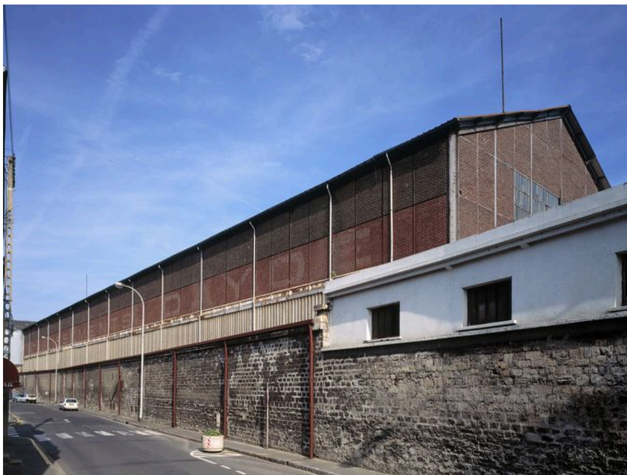
Halle de montage des ateliers Daydé-Pillé (Creil).