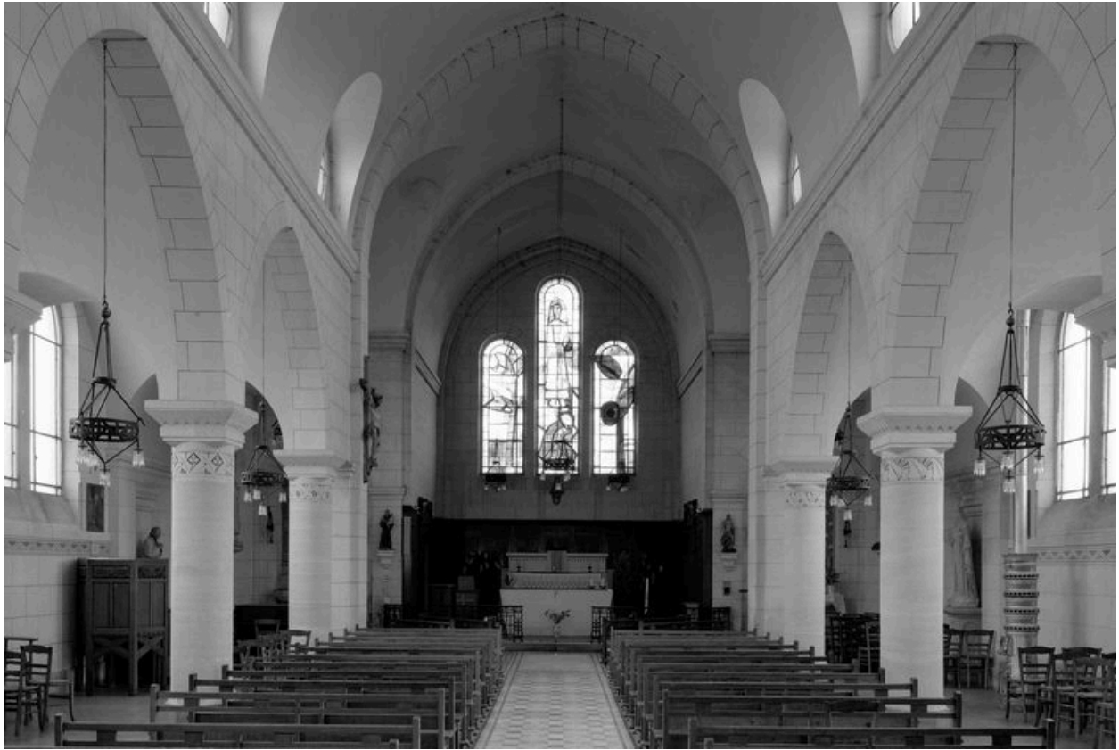
Vue intérieure vers le chœur.