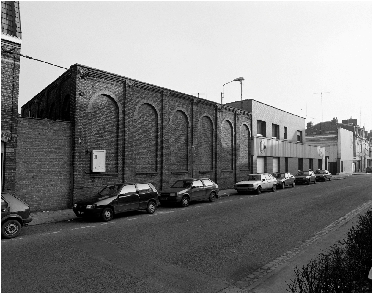
Élévation antérieure rue des Fusillés.