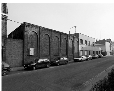
Élévation antérieure rue des Fusillés. IVR31_19915900100X