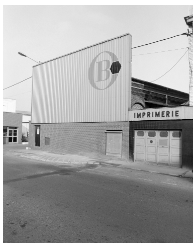
Entrée.