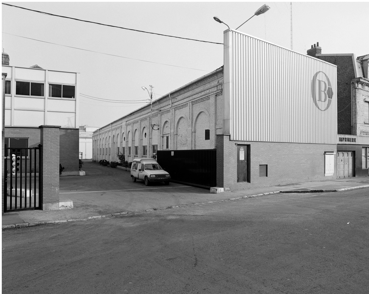
Cour vue depuis l'entrée.