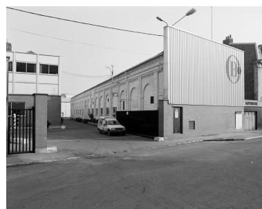
Cour vue depuis l'entrée. IVR31_19915900101X