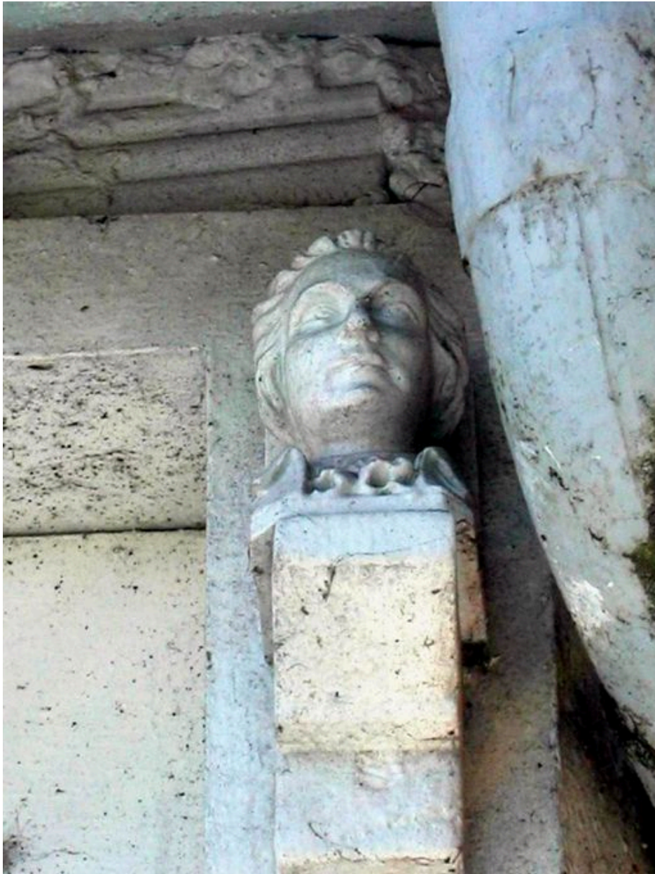
Effigie décorative placée près de la porte d'accès.