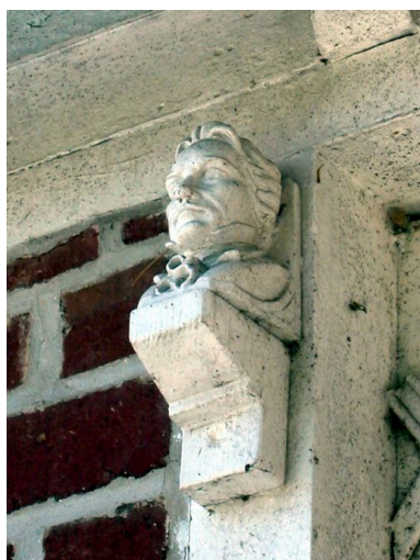
Effigie décorative placée près de la porte d'accès. IVR22_20048001365NUCA