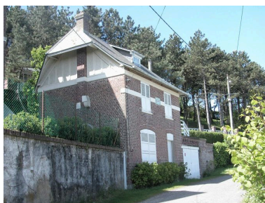
Vue d'ensemble et de trois-quarts.