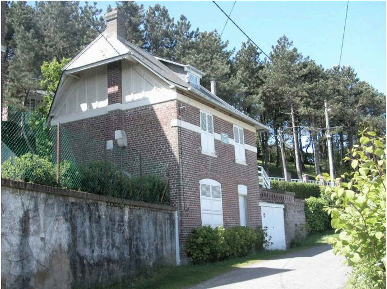
Vue d'ensemble et de trois-quarts.