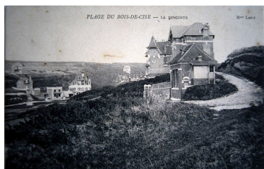
Château Margo avant transformation, carte postale, 1er quart 20e siècle. IVR22_20058000562XAB