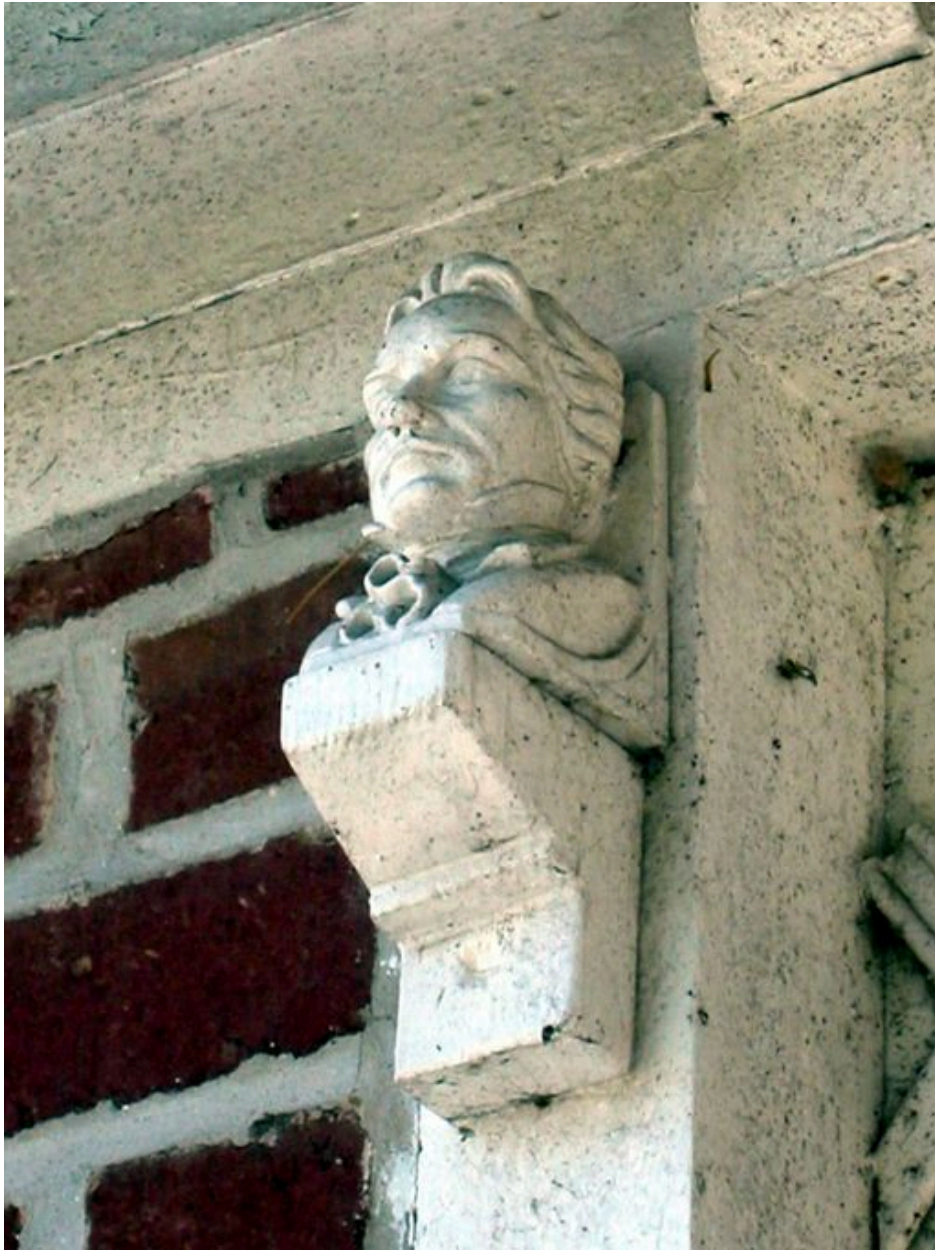
Effigie décorative placée près de la porte d'accès.