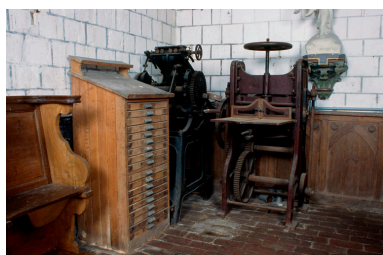
Machine à imprimer par typographie. IVR22_19988001184ZA