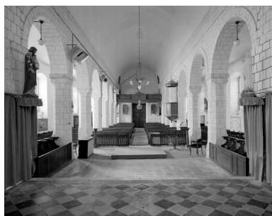
Vue intérieure, depuis le chœur. IVR22_19988001772V