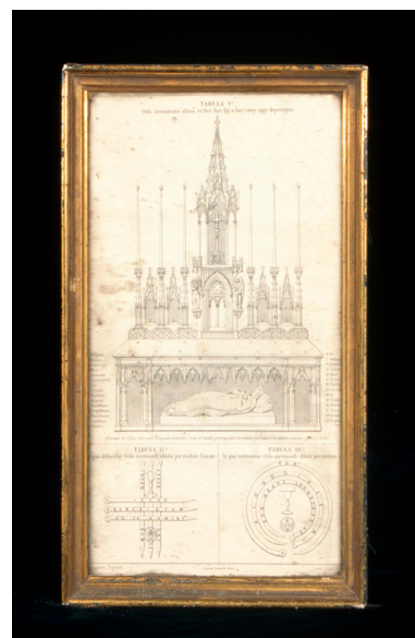
Gravure : manière d'encenser l'autel. IVR22_19998000573ZA