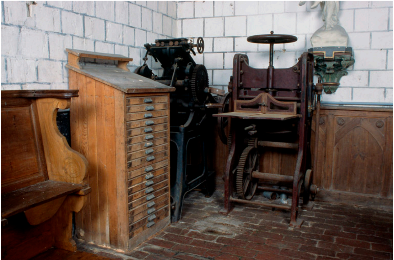
Machine à imprimer par typographie.