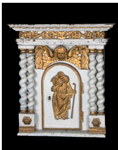
Tabernacle.