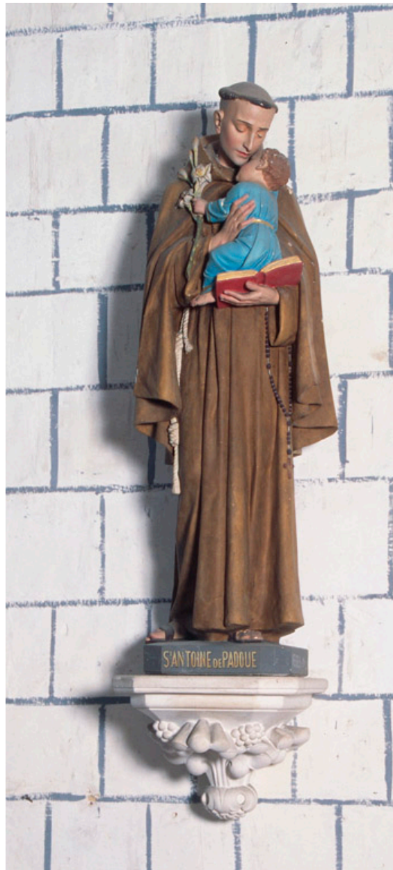
Statue : Saint Antoine de Padoue.