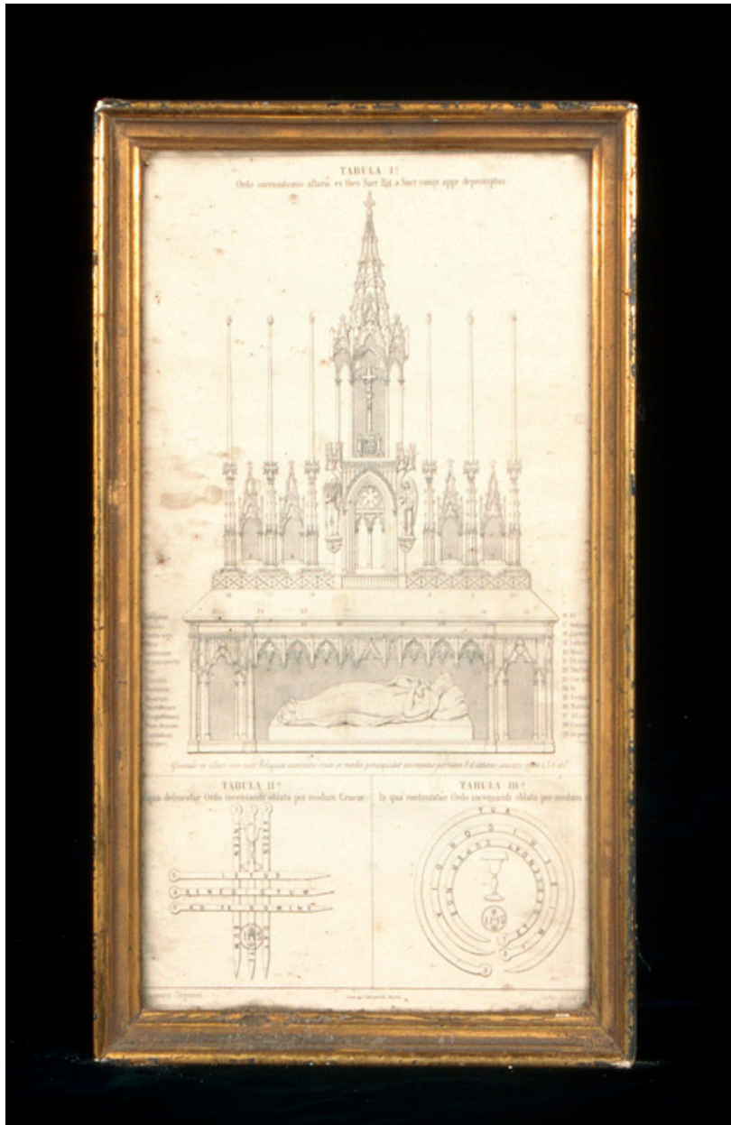
Gravure : manière d'encenser l'autel.