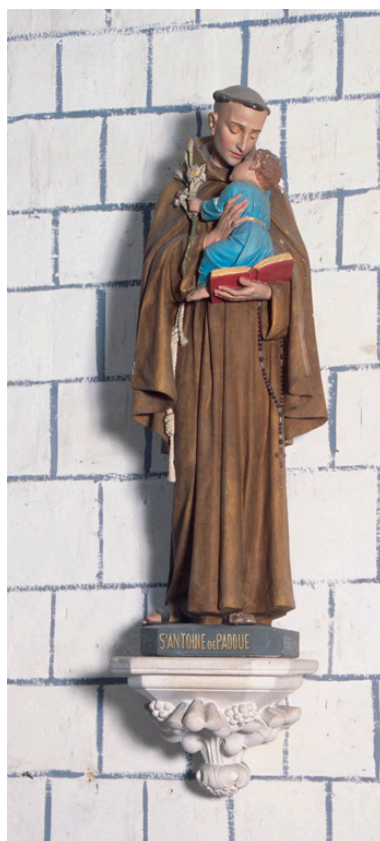
Statue : Saint Antoine de Padoue. IVR22_19988001186ZA