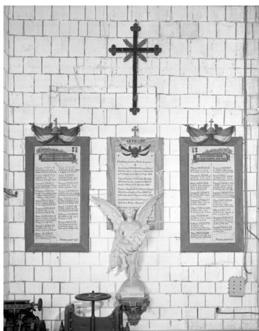
Tableau commémoratif des morts de la guerre de 1870-1871 et de la guerre de 1914-1918. IVR22_19988001168V