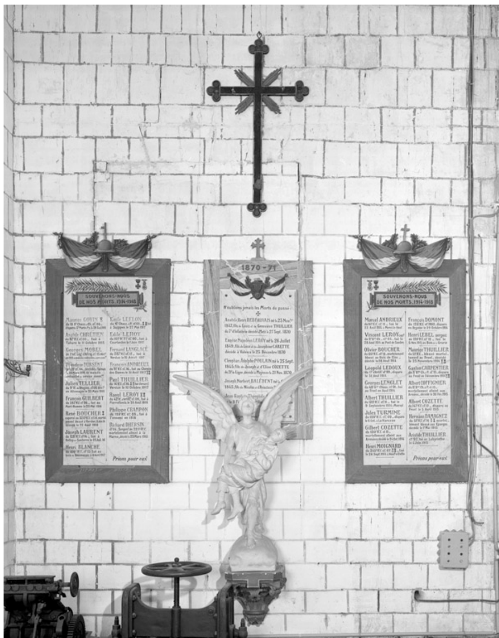
Tableau commémoratif des morts de la guerre de 1870-1871 et de la guerre de 1914-1918.