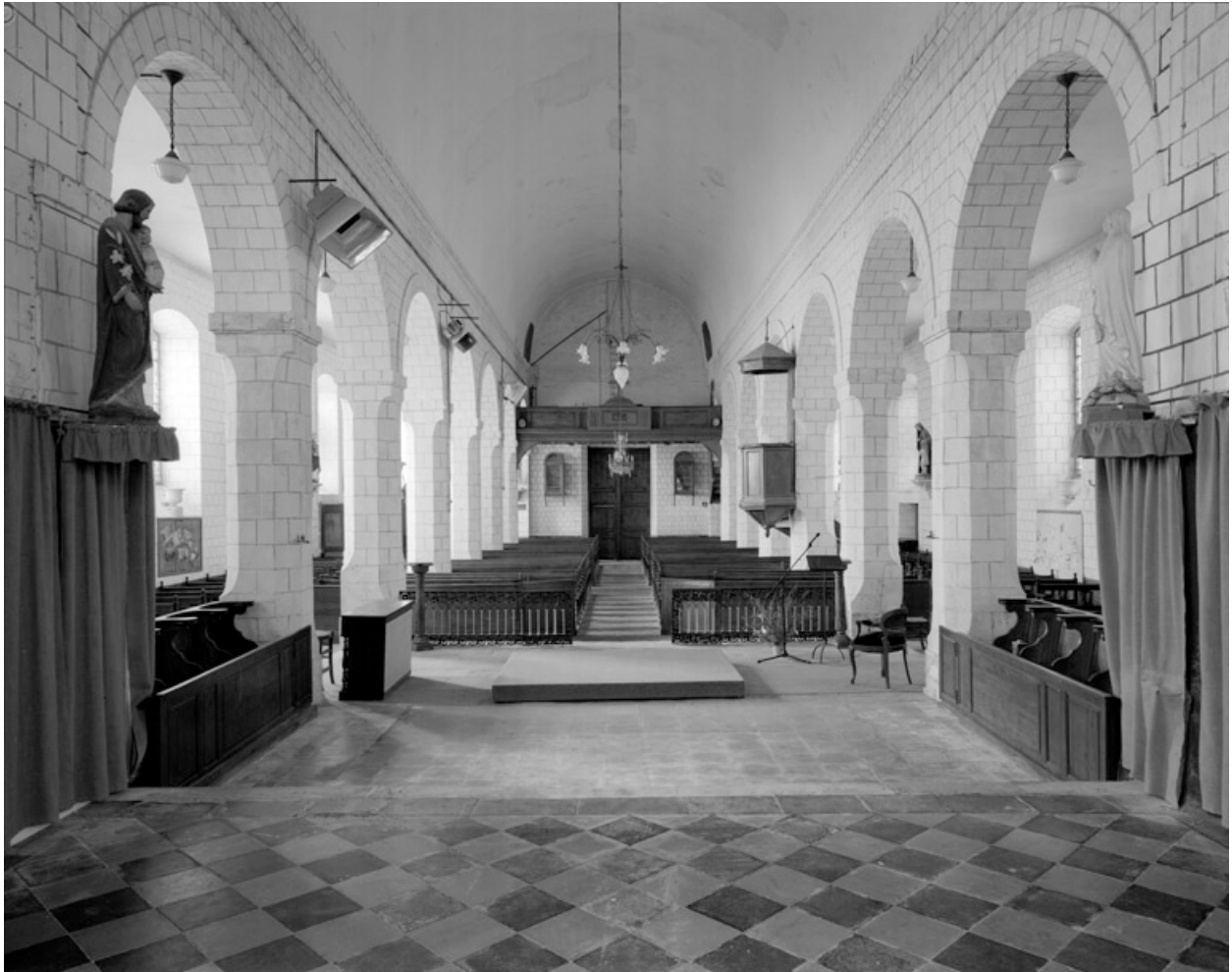
Vue intérieure, depuis le chœur.