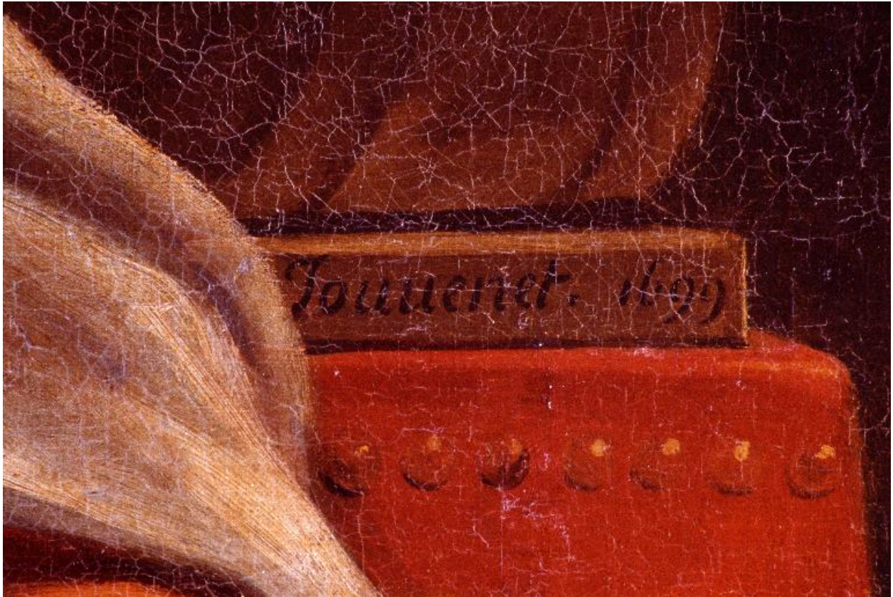
Détail du tableau : signature de Jean Jouvenet et date d'exécution de l'œuvre, peintes sur un accotoir du siège de sainte Anne.