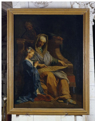
Vue générale du tableau.