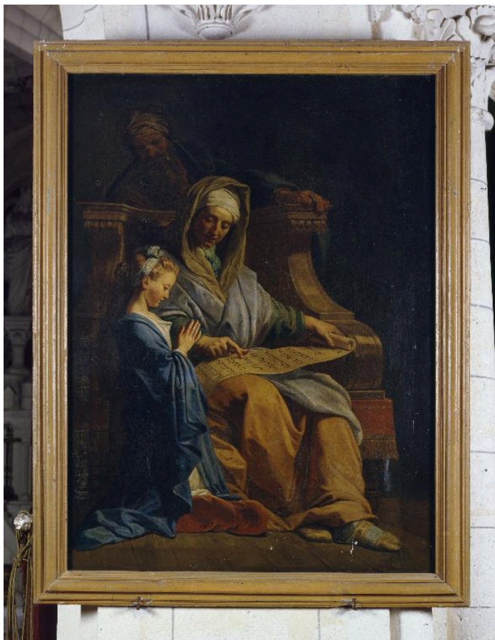
Vue générale du tableau.