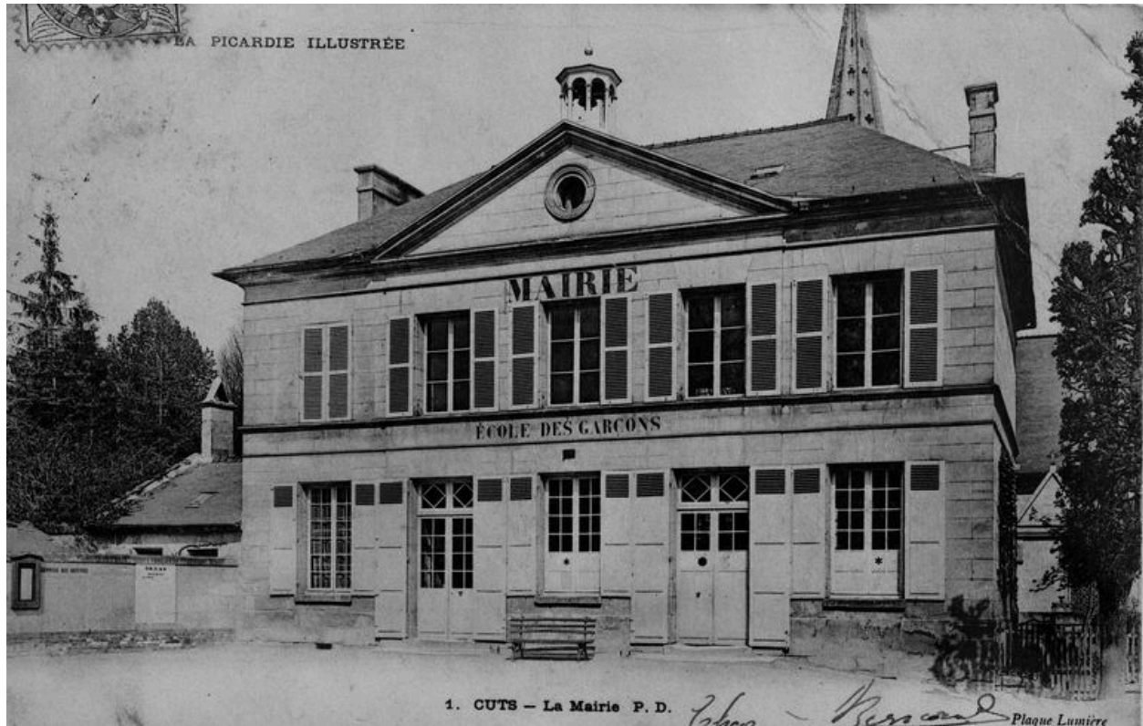
La mairie avant 1914.