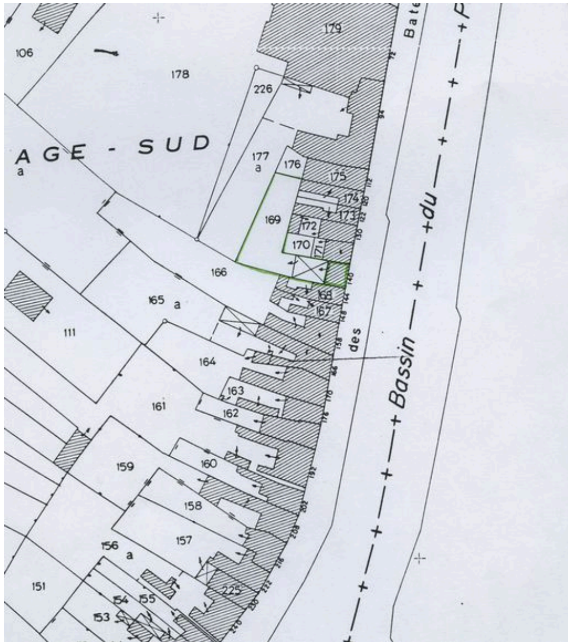
Plan de situation. Extrait du plan cadastral de 1982, section AB 169.