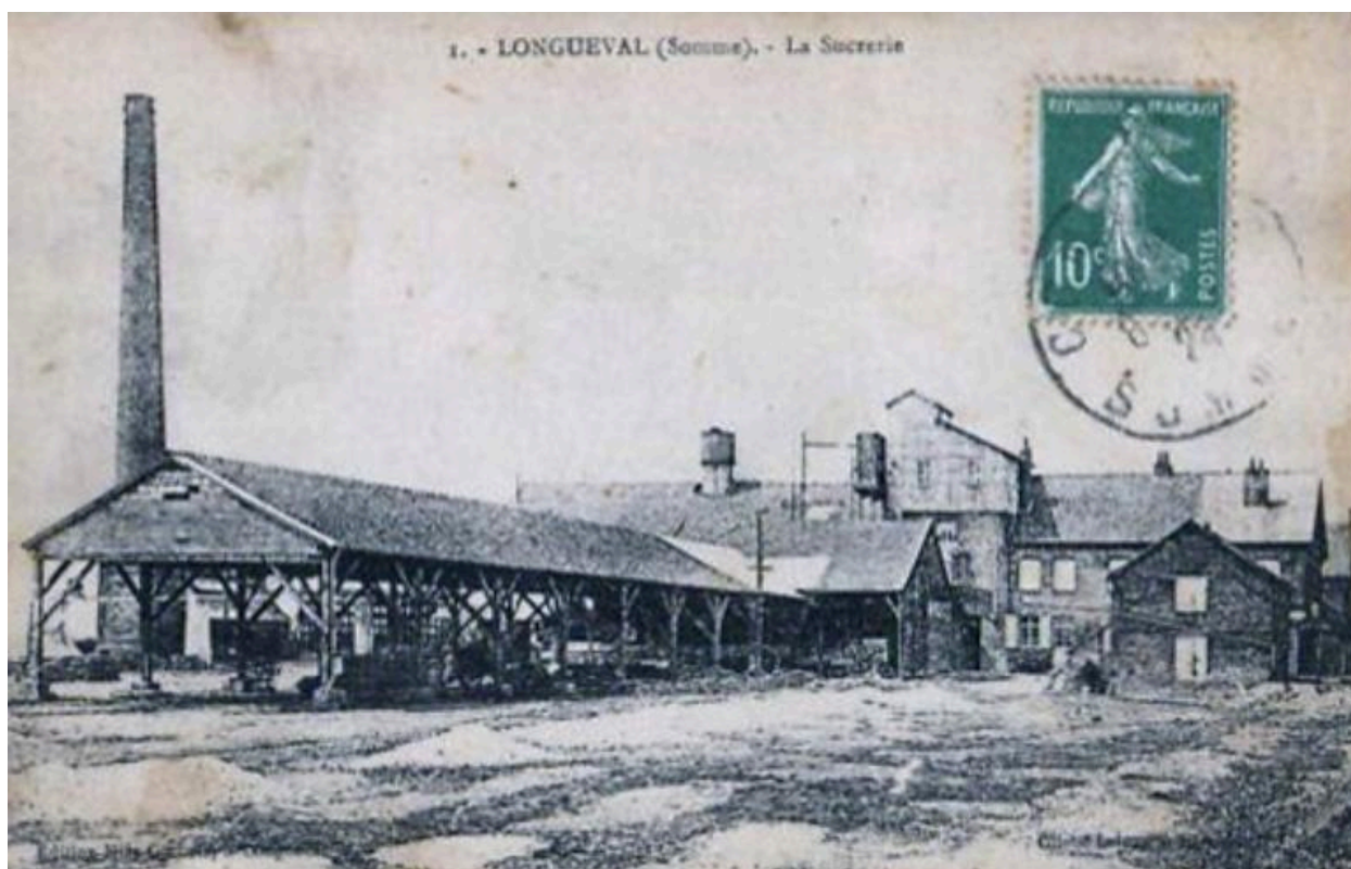
La sucrerie de Longueval, carte postale avant 1914 (coll. part.).