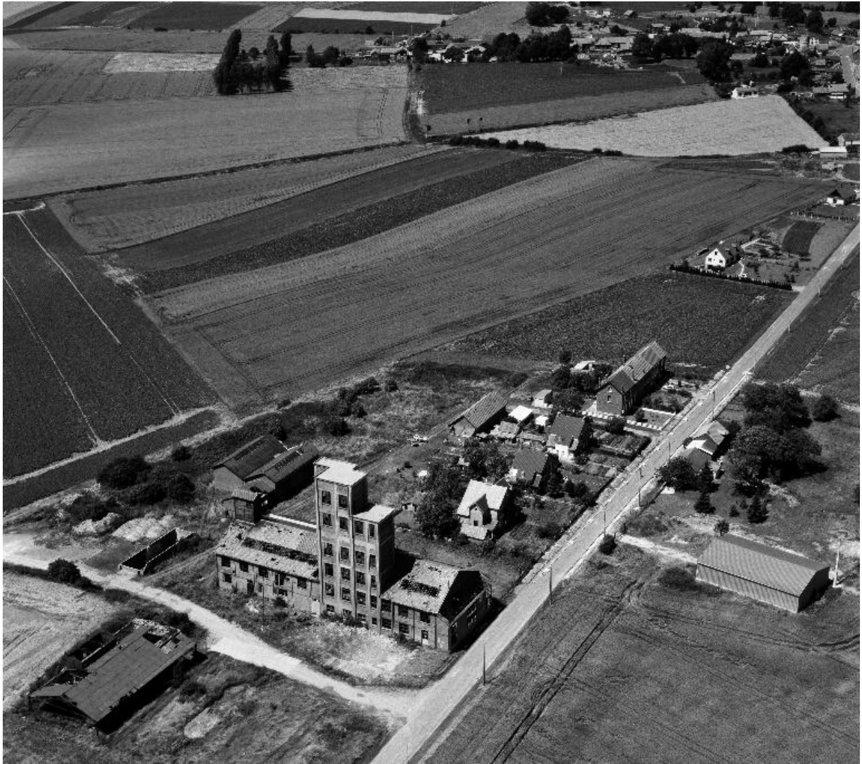
Vue aérienne, flanc sud-est.