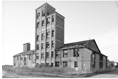
Vue d'ensemble de la râperie depuis le sud.