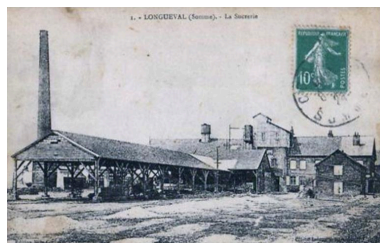
La sucrerie de Longueval, carte postale avant 1914 (coll. part.).