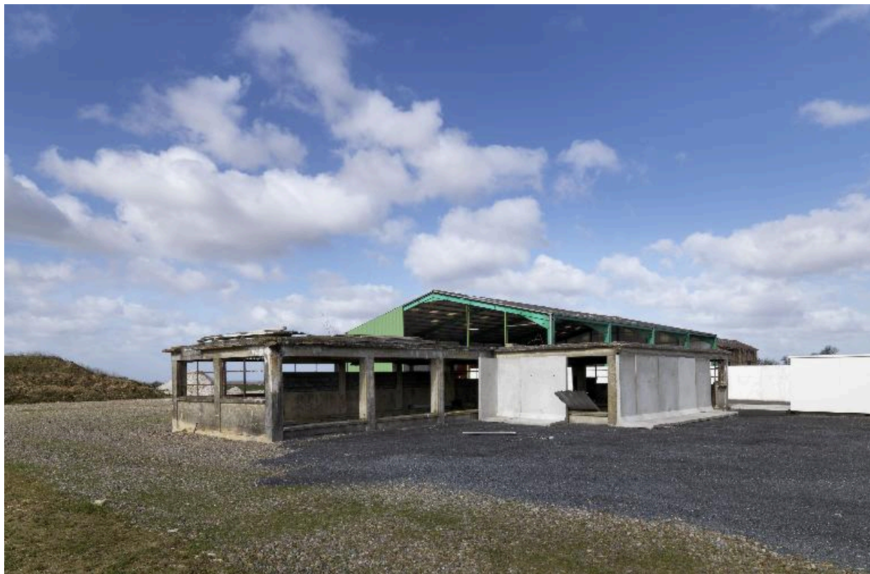
Vestige de l'ancienne sucrerie.