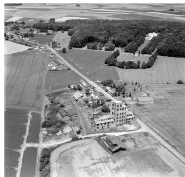
Vue aérienne, flanc sud-ouest.