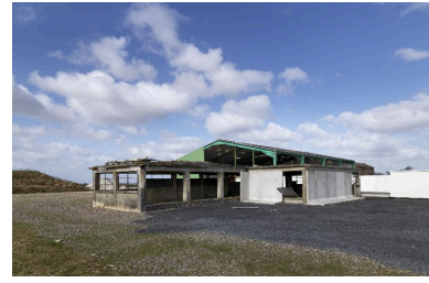
Vestige de l'ancienne sucrerie.