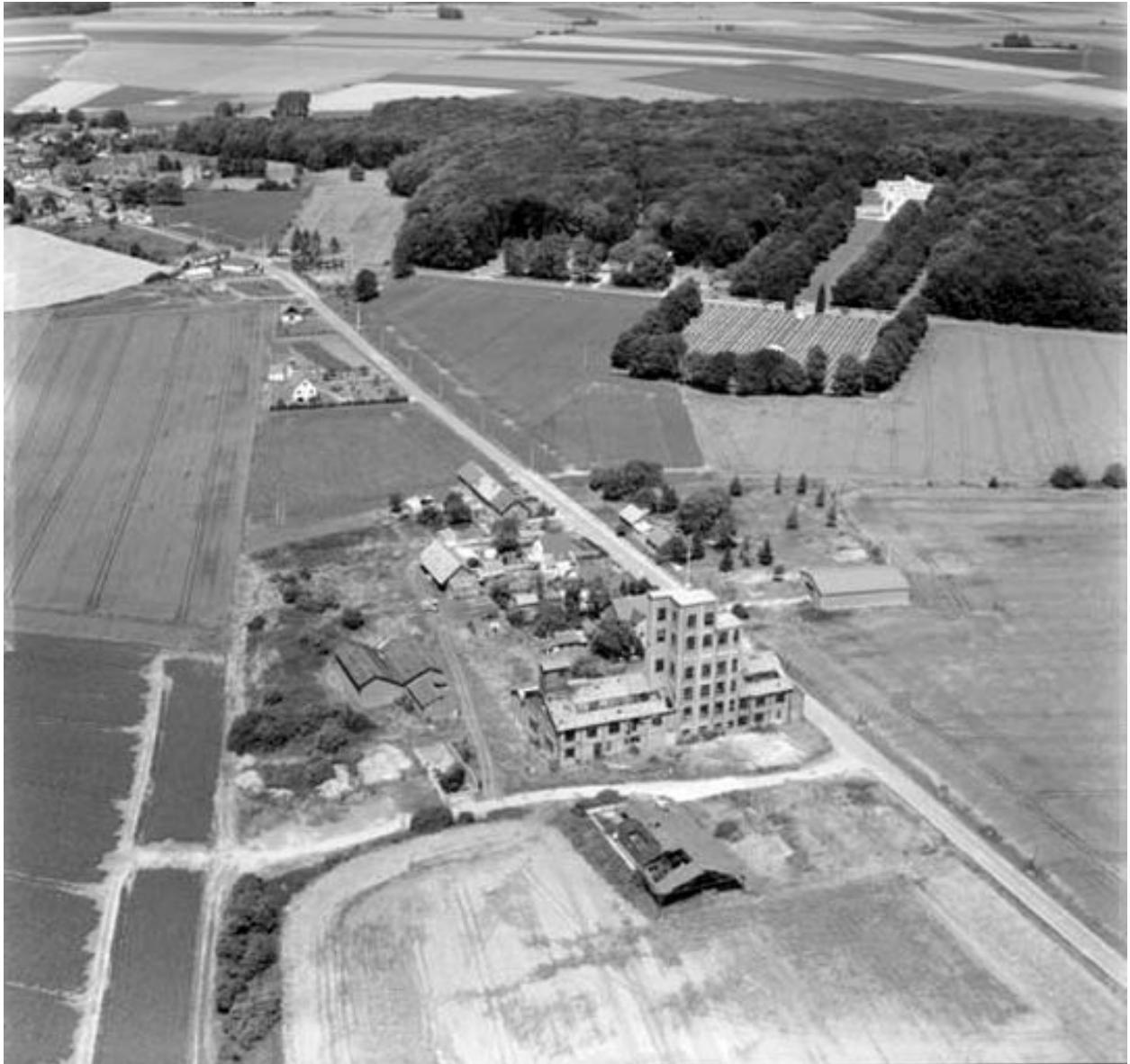
Vue aérienne, flanc sud-ouest.