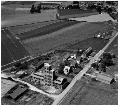
Vue aérienne, flanc sud-est.