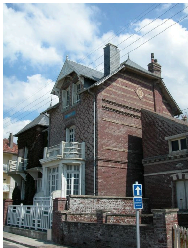
Elévation latérale droite. IVR22_20048001694NUCA