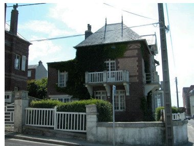
Elévation latérale gauche. IVR22_20048001693NUCA