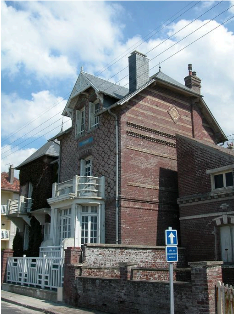
Elévation latérale droite.