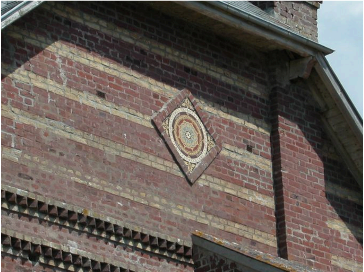
Détail du décor de céramique sur l'élévation latérale droite.