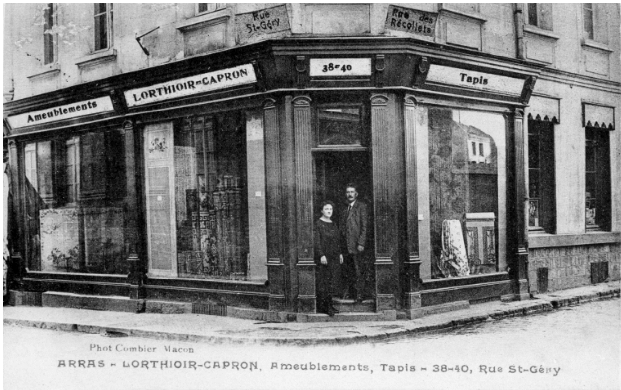
Arras. Maison Lorthioir-Capron. Carte postale, vers 1925-1930.