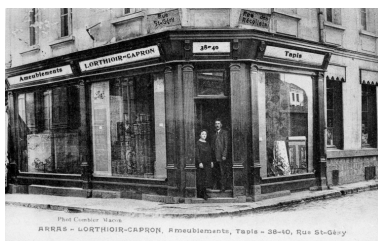
Arras. Maison Lorthioir-Capron. Carte postale, vers 1925-1930.