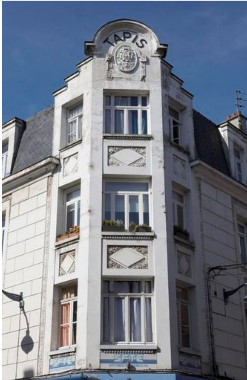
Angle aux formes et aux motifs Art déco.