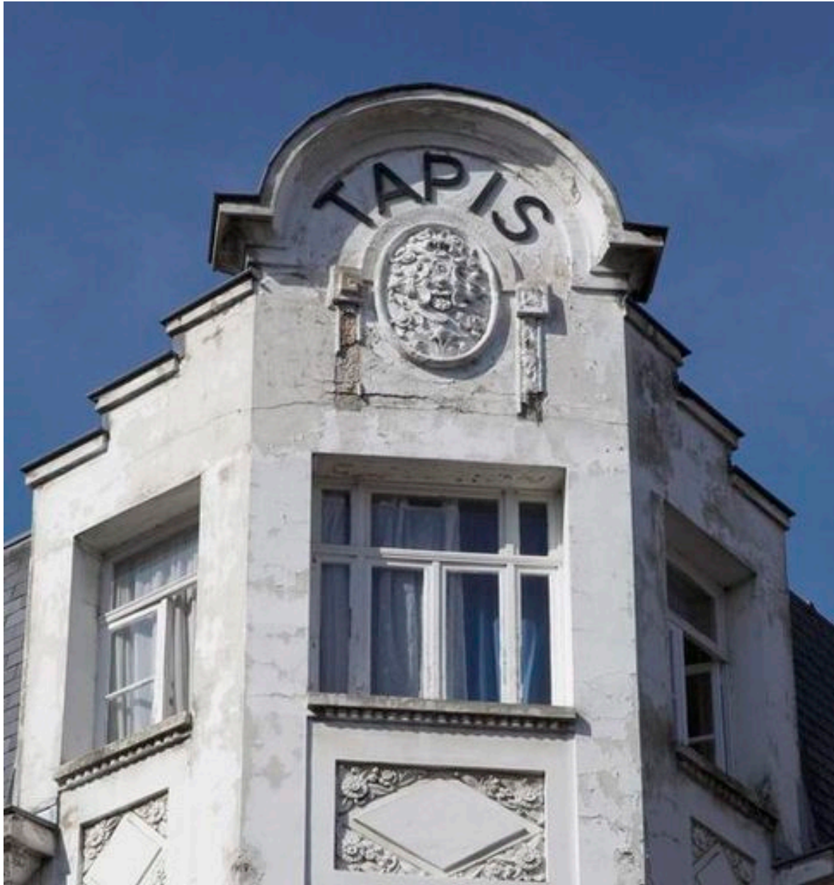
Fronton-pignon à redents, orné d'un bas-relief floral en médaillon et d'un élément scirptural datant de la reconstruction de l'immeuble dans les années 1920.