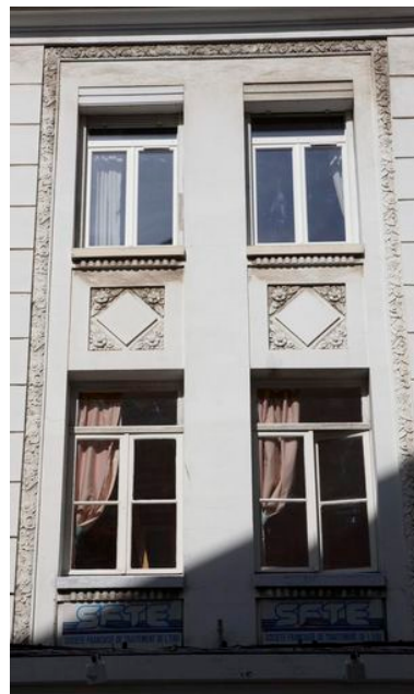
Encadrement, allèges sculptées et appuis de baies aux motifs et aux formes Art déco.