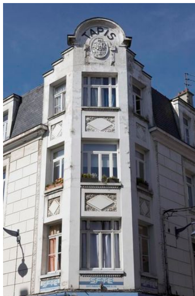
Angle aux formes et aux motifs Art déco. IVR31_20096200198NUCA