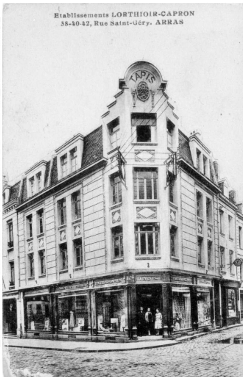
Etablissement Lorthioir-Capron. 38-40-42 rue Saint-Géry. Arras. Carte postale, vers 1925-1940.