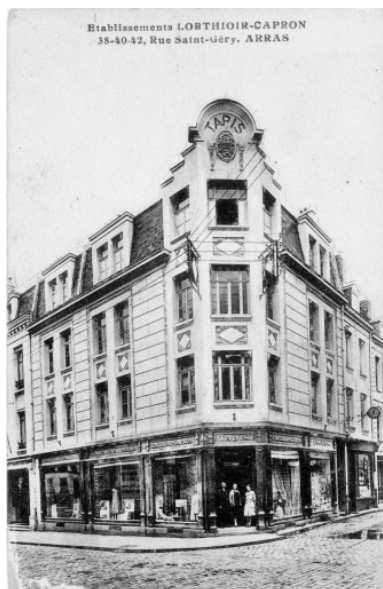
Etablissement Lorthioir-Capron. 38-40-42 rue Saint-Géry. Arras. Carte postale, vers 1925-1940 (AD Pas-de-Calais ; 38 FI 967). IVR31_20096200063XB