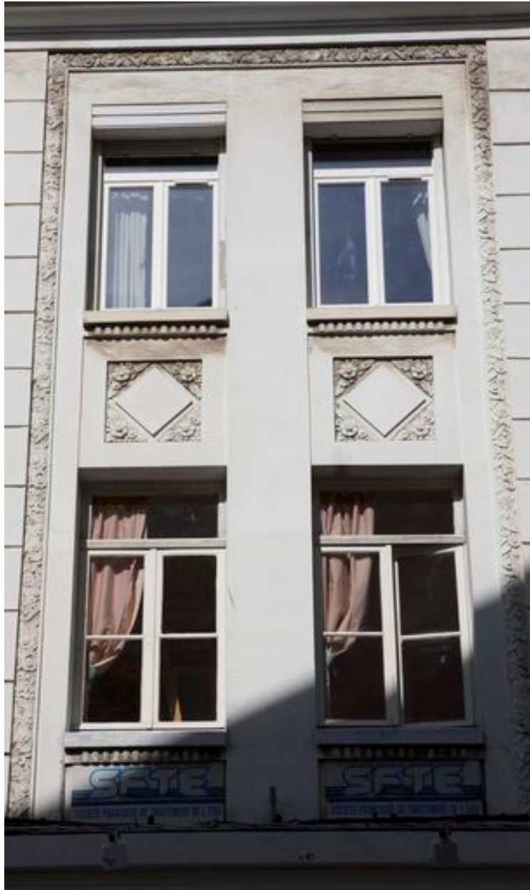
Encadrement, allèges sculptées et appuis de baies aux motifs et aux formes Art déco.