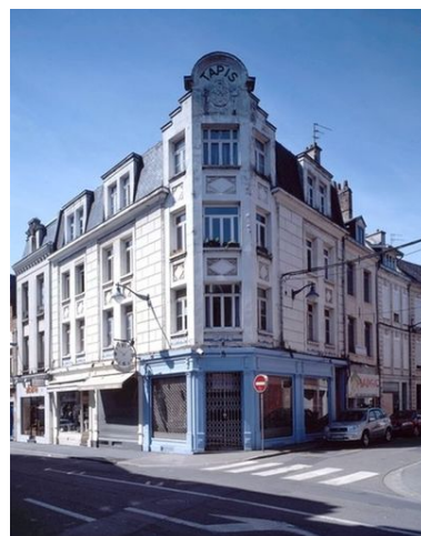
Vue générale. IVR31_20086200119VA