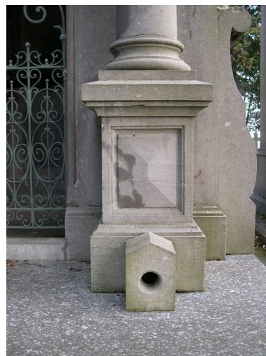
Vue de l'aération du caveau. IVR22_20078010362NUCA