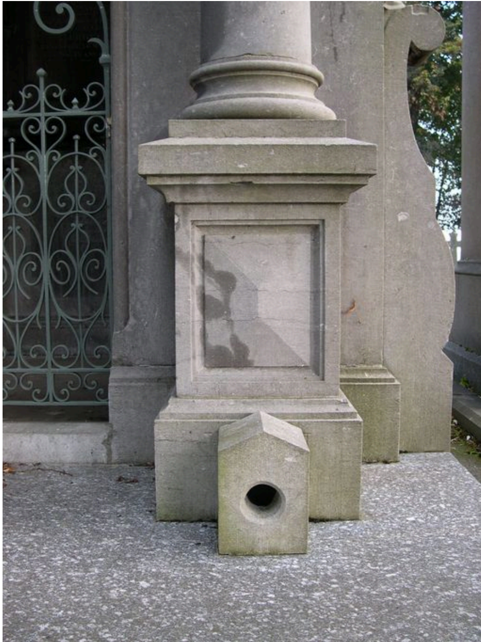
Vue de l'aération du caveau.